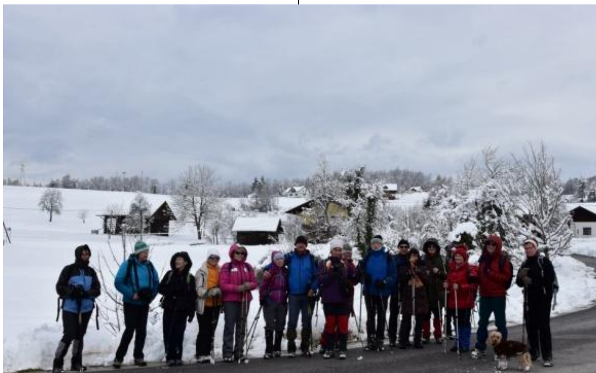
Pred naseljem Dobrava pri Stični

Lepi pogledi na pokrajino so kar klicali po tem, da je potrebno narediti skupinsko fotko udeležencev tokratnega izleta.