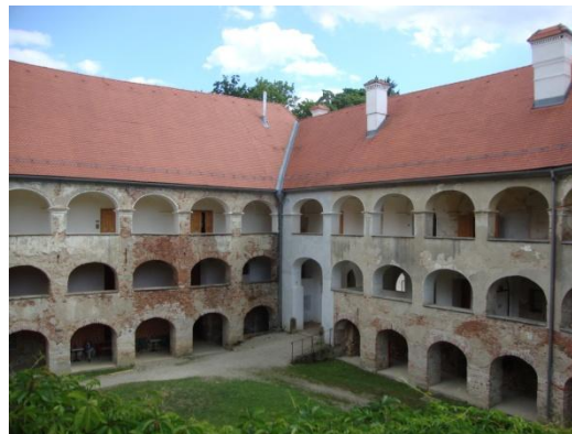
Pogled na grad z grajskega dvorišča

grad obnavlja. Ideja o združitvi obmejnih regij v območje varovanja narave in v park treh dežel je za obnovo gradu prispevala k iskanju državnih in evropskih denarnih sredstev.