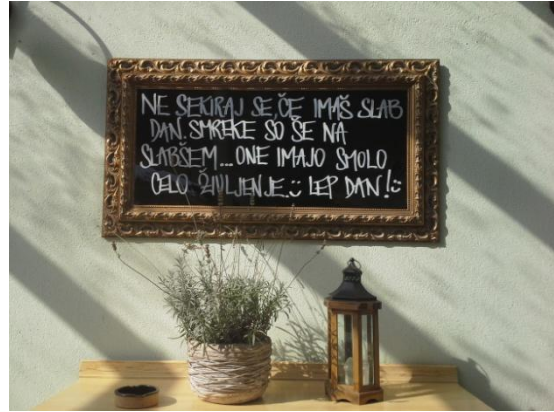
Napis na steni:

Po dobri poldrugi uri hoje smo bili ponovno na izhodišču. Ker smo imeli časa dovolj, smo si vzeli nekoliko več časa za zasluženo kavico v prijetnem lokalčku v središču mesta. Lokal je vzor, kako lahko gresta razvoj in napredek skupaj z naravo. Pokrita terasa je imela v strehi kar dve veliki odprtini, da dveh mogočnih dreves niso posekali, istočasno pa sta dajali terasi prijeten občutek stika z naravo. Na steni lokala pa je bil spodbuden napis za ljudi, ki se prevečkrat jezimo zaradi majhnih in nepomembnih stvari.