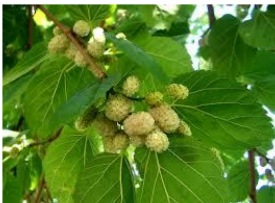
Plodovi črne in bele murve

Svila danes nima več tako prestižne vloge, kot jo je imela nekoč, ko je bila predvsem domena posvetnih vladarjev in avtoritet. Tehnologija izdelave svile ali svilogojstvo pa je bilo kar nekaj tisočletij skrbno varovano. V Sloveniji so sviloprejke dobivali iz Italije. V času vladavine Marije Terezije je le-ta spodbujala tovrstno gospodarsko dejavnost. Tisti, ki so bili pripravljene zasadi murve in se ukvarjali s svilogojstvom, so bili nagrajeni, zato se je za to panogo počasi navdušilo tudi kmečko prebivalstvo. Najprej pa so se s tem ukvarjali v premožnejših družinah. Konec 17. stoletja in v začetku 18. stoletja je pri nas napočila zlata doba svilogojstva.