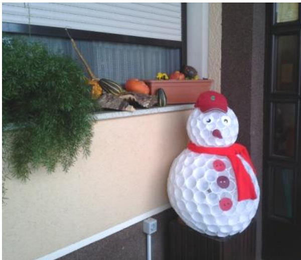
Snežak iz plastičnih lončkov na kmetiji Pr'Okornu

Po dveh uricah hoje smo prišli na Pristavo nad Stično, ki leži na položnem in razglednem goličavnem prevalu. Od tu se razprostira lep razgled na Gorjance. Zavili smo do turistične kmetije Pr'Okornu. Pred vhodom je bil postavljen zanimiv snežak, izdelan iz plastičnih lončkov. Dokaz, da se tudi odpadni plastični material da koristno uporabiti. Takšen snežak pa služi svojemu namenu tudi takrat, ko narava ni radodarna s snegom ali ko se ponuja odjuga.