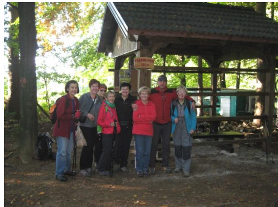
Dosežena najvišja točka Trebnjega vrha

Po dobri urici hoje smo že prišli na našo najvišjo točko, Trebnji vrh, ki se ponaša s 581 m nadmorske višine.