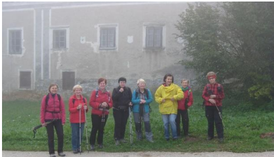
Pri trebanjskem gradu se je pričela naša pešpot.

trajala dolgo, zato jutranje kavice nismo potrebovali. Ustavili smo se pri trebanjskem gradu, kjer smo parkirali, in pričeli našo peš pot.