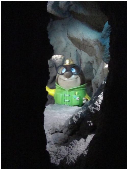
Maskota OLI, ki nas vodi po Vulkaniji.

Nato si ogledamo še največji grad v Sloveniji. Grad se nahaja v istoimenskem naselju in stoji na strmem griču iz bazaltne tufa, grad je eden največjih grajskih kompleksov na Slovenskem. Na tem mestu je prvotno stala utrdba, grad pa je prvič omenjen leta 1214. Po pripovedovanju naj bi grad začeli graditi vitezi templjarji. Današnji obseg je grad dobival od 16. do 19. stoletja, grad je imel skozi stoletja več lastnikov.