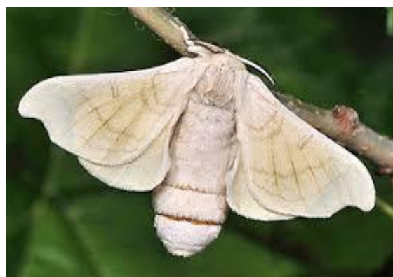
Metulj – sviloprejka

Svila danes nima več tako prestižne vloge, kot jo je imela nekoč, ko je bila predvsem domena posvetnih vladarjev in avtoritet. Tehnologija izdelave svile ali svilogojstvo pa je bilo kar nekaj tisočletij skrbno varovano. V Sloveniji so sviloprejke dobivali iz Italije. V času vladavine Marije Terezije je le-ta spodbujala tovrstno gospodarsko dejavnost. Tisti, ki so bili pripravljene zasadi murve in se ukvarjali s svilogojstvom, so bili nagrajeni, zato se je za to panogo počasi navdušilo tudi kmečko prebivalstvo. Najprej pa so se s tem ukvarjali v premožnejših družinah. Konec 17. stoletja in v začetku 18. stoletja je pri nas napočila zlata doba svilogojstva.