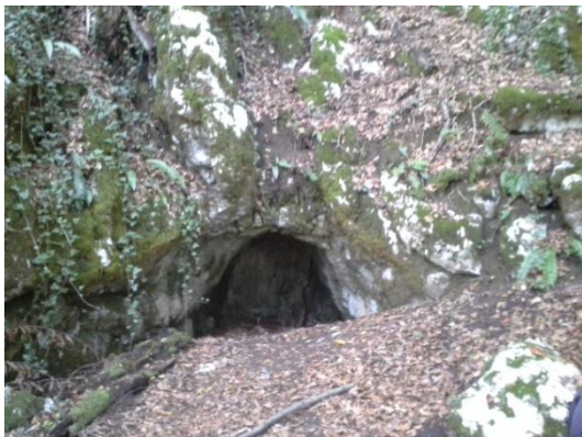
Mala jama, v kateri domujejo netopirji.

Hoja po gozdu je bila prijetna. Skupaj smo iskali gobe in opozarjali dve najbolj navdušeni gobarki na spregledano sirovko, veliki dežnik ali golobico. Jurčka žal nismo našli nobenega. Očitno so domačini skrbno prečesali celoten teren. Poti v gozdu je bilo resnično veliko, zato smo se dvakrat ali trikrat kar družno odločili, po kateri naj zavijemo. Glede na našo izbiro smo nato prišli do velikih skalnih gmot, po katerih smo se morali spuščati previdno kot v pravem gorskem svetu. Kmalu sta nas napis na skalah informirala, da smo šli po poti Velike in Male jame. Pri vsaki smo nekoliko postali in občudovali stvaritev narave. Pri slednji smo celo opazili tri netopirje, ki so prihajali iz jame in se urno vračali vanjo. Verjetno z našo prisotnostjo niso bili zadovoljni, ker jih po nekajminutnem opazovanju ni bilo več na spregled. Imeli smo izredno srečo, da smo jih videli, saj so nočno aktivne živali. Med sesalci so edini, ki so sposobni aktivnega leta.