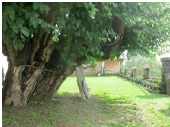
Mogočna stara murva

Murva je hitro rastoče listopadno drevo. Izvira iz Azije, kjer jih uporabljajo za gojenje sviloprejk, ki se hranijo z listi murv. Zraste od 10 do 15m visoko z gosto krošnjo, ki poleti daje hladno senco. Pri nas sta poznani bela in črna murva. Plod murve dozori konec junija. Iz njega kuhajo marmelade, sokove in sirupe, nekoč pa so bile murve sladkor za reveže. Sadili so jih za hrano sviloprejk. Murva je na Primorskem to, kar je lipa za osrednjo Slovenijo. Mogočna drevesa najdemo še sedaj na vaških trgih in parkih, pod katerimi, se v senci srečujejo domačini.