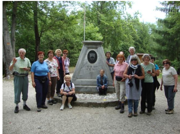
Na vrhu Tromejnika 390 m pri tromejni piramidi

razmejitvena črta deloma določena tudi z železno ograjo, ki je bila po osamosvojitvi Slovenije odstranjena. Kasneje je bil na Tromejnik dodan slovenski grb. Zaradi gozda vrh ni razgleden. Dostop do Tromejnika je mogoč iz vseh treh držav.