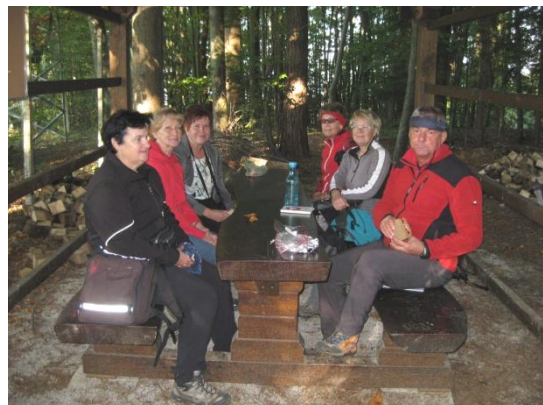
Počitek po osvojenem cilju

Vrh je poraščen predvsem z bukovimi drevesi in ni razgleden. Je pa na najvišji točki postavljen neke vrste kozolec z mizo in klopmi, kjer smo se okrepčali, odpočili in vpisali v planinsko knjigo.