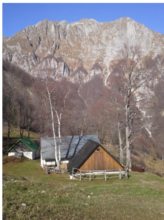
Na planini Laška seč smo bili deležni domačega zeliščnega šnopčka.

Proti planini Medrje smo se spustili po drugi strani in bili na planini Laška seč deležni prijazne postrežbe mladih fantov in dekleta v obliki domačega ustekleničenega poživila, ki nam je ravno prav ogrelo ude, saj je že kar pošteno zahladilo.