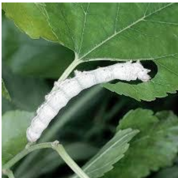
Gosena se hrani z murvinim listom.