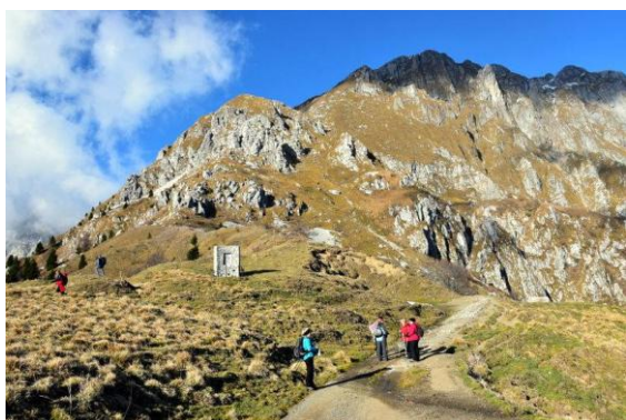
Od planine Sleme proti planini Medrja

Proti planini Medrje smo se spustili po drugi strani in bili na planini Laška seč deležni prijazne postrežbe mladih fantov in dekleta v obliki domačega ustekleničenega poživila, ki nam je ravno prav ogrelo ude, saj je že kar pošteno zahladilo.