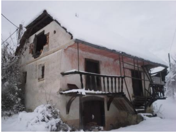
Zanimivo leseno stopnišče na pročelju starinske hiše

Po dveh uricah hoje smo prišli na Pristavo nad Stično, ki leži na položnem in razglednem goličavnem prevalu. Od tu se razprostira lep razgled na Gorjance. Zavili smo do turistične kmetije Pr'Okornu. Pred vhodom je bil postavljen zanimiv snežak, izdelan iz plastičnih lončkov. Dokaz, da se tudi odpadni plastični material da koristno uporabiti. Takšen snežak pa služi svojemu namenu tudi takrat, ko narava ni radodarna s snegom ali ko se ponuja odjuga.