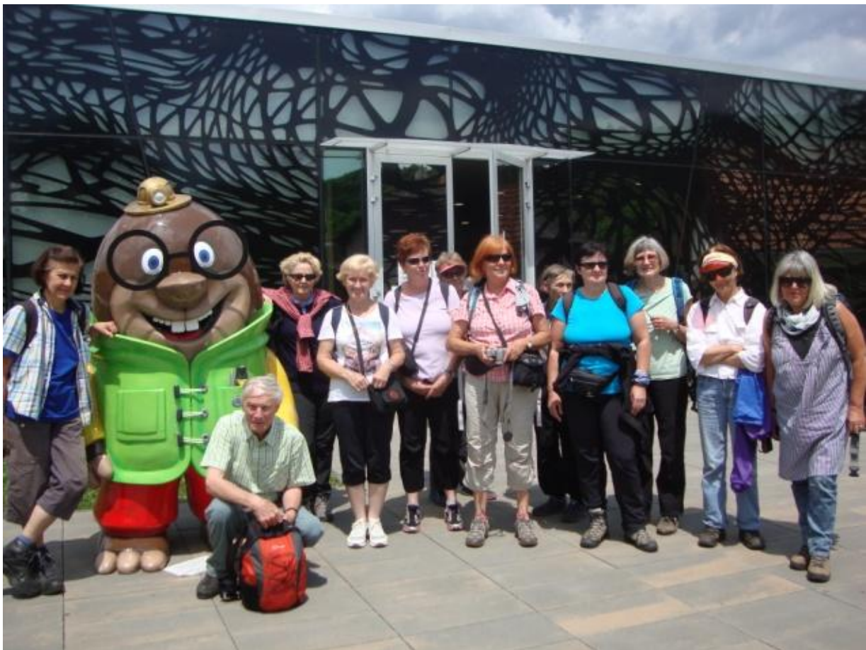
Pred vhodom v Vulkanijo

Pred Vulkanijo v bivši Lednarjevi usnjarni je Geološki muzej, kjer so kamnine z Goričkega. Spoznamo olivin, zeleni smaragd, ki ga je cenila Kleopatra in po katerem je dobila ime maskota za Vulkanijo OLI. Prikazan je vodni krog in slatinski vreli.