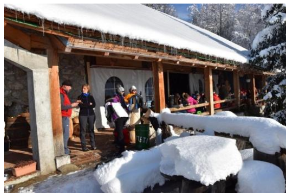
Postanek pri Lavričevi koči

Ob poti nas je lepo oblikovana markacija informirala, da je naša pot tudi del Viridine krožne peš poti. Pot je dobila ime po zgodovinski osebi Viridi Visconti, ki je od leta 1391 do 1414 živela na Pristavi nad Stično. V lovski gradišč se je preselila, ko se je umaknila iz javnega življenja na cesarskem Dunaju po tragični smrti svojega soproga avstrijskega nadvojvode. Žal so od njenega nekdanjega bivališča dandanes ostale le še ruševine. Ideja za postavitve te poti je bila uresničena leta 2000. Vsako leto je tudi organiziran pohod po tej poti, in sicer zadnjo nedeljo v mesecu marcu.