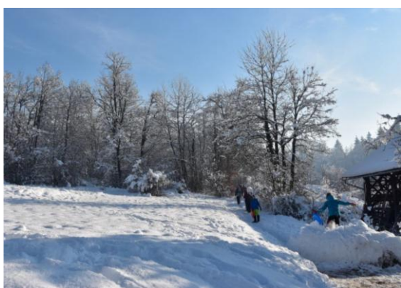
Neokrnjeni bleščeči sneg

Že na Škofljici se je sivina pričela tanjšati in kmalu nato so nas pozdravili topli sončni žarki. Parkirali smo v Stični in se nato prav vsi odločili, da gremo peš proti našemu cilju, čeprav je bil na voljo tudi avtobus, če bi kdo ocenil, da je pot zanj prenaporna.