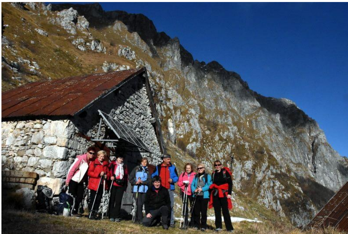
Naš končni cilj, planina Sleme