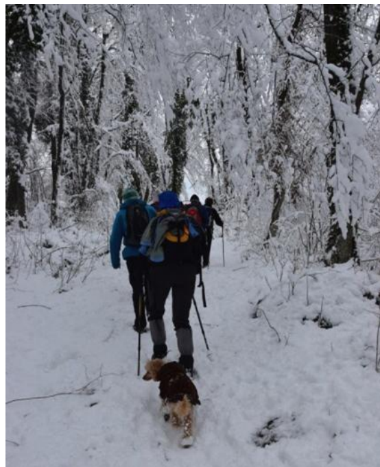
Pot je popestrila psička Bibi.

Iz gozda smo nato prišli do razglednih travnikov, kjer leži vasica Dobrava pri Stični.