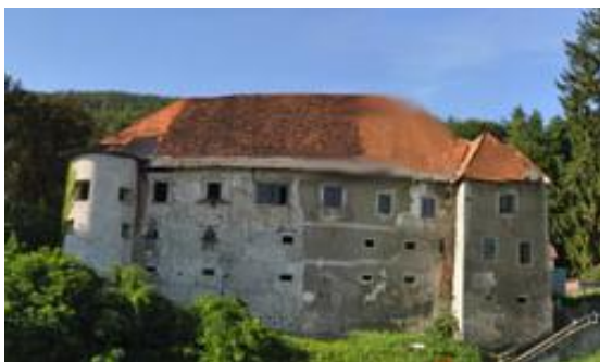
Trebanjski grad

Na internetnih straneh sem pridobila podatke, da se je grad v virih prvič omenjal leta 1386, njegov začetek pa menda sega tja v leto 1000. Lociran je na mirnem gozdnem pobočju nad rečico Temenico. Menjal je več lastnikov, med njimi so bili tudi grofje Celjski in Habsburžani. Današnje lepo zunanjo podobo z vogalnimi krožnimi stolpi in velikim notranjim dvoriščem je dobil v 16. stoletju. Leta 1799 ga je kupil oče Friderika Barage, tako da je bil grad vse do leta 1812 njihov dom. Po očetovi smrti je Friderik, kot petnajstletni fant podedoval grad in ga odstopil Gresslovim, ki so ga imeli v lasti do leta 1896.