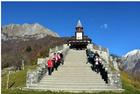
Pri znameniti cerkvi sv. Duha na Javorci

Najprej smo se povzpeli do Javorce, spominske cerkve svetega Duha. Cerkvica je ena izmed postaj na Poti miru, ki povezuje spomenike in ostaline prve svetovne vojne.