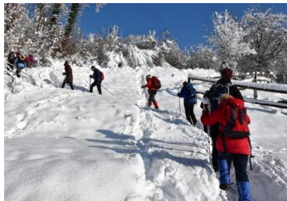
Pot v snegu je bila že nadelana.

je popestrila tudi psička Bibi, ki je tekala od lastnikov do drugih pohodnikov in nazaj.