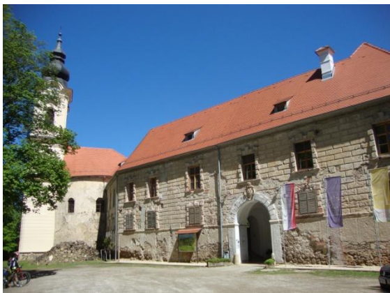
Zunanji izgled mogočnega gradu

Nato si ogledamo še največji grad v Sloveniji. Grad se nahaja v istoimenskem naselju in stoji na strmem griču iz bazaltne tufa, grad je eden največjih grajskih kompleksov na Slovenskem. Na tem mestu je prvotno stala utrdba, grad pa je prvič omenjen leta 1214. Po pripovedovanju naj bi grad začeli graditi vitezi templjarji. Današnji obseg je grad dobival od 16. do 19. stoletja, grad je imel skozi stoletja več lastnikov.