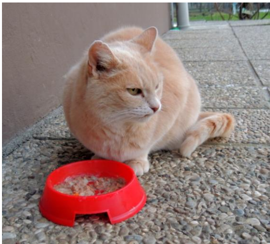
Breskvica-prav na to mesto je prišel ježek.

V hladnejših krajih prespi zimo, med spanjem znaša njegova telesna temperatura 4 stopinje C (običajna temperatura je 34 stopinj C), vdihne pa 10-krat v minuti. Srčni utrip je 20-krat na minuto, ko ne spi, pa 190-krat na minuto. Značilno za obe vrsti je, da jež z razpenjeno slino popljuje svoj kožuh. Zakaj to stori, ni znano. Če se čuti ogroženega, se zvije v kroglo in močno naježi bodice. V marcu se pričnejo pariti, parjenje traja tja do avgusta. Samica nosi 31 do 35 dni. Na leto povrže enkrat do dvakrat od 1 do 10 mladičev, običajno pa 3-4 mladiče.