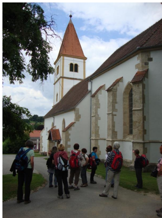
V naselju Grad skupina pred cerkvijo, posvečeno Mariji Vnebovzeti

Odpeljemo se v samo naselje Grad. Naselje Grad je v tesni povezavi z gradom, ki stoji na pomolu trde vulkanske skale strmega griča. Grad je eden od kotov velikega pomurskega trikotnika zdravilnih energetskih točk, drugi je Bukovniško jezero, ki je nastalo z zajezitvijo potoka Bukovnica, in tretji je Razkrižje.