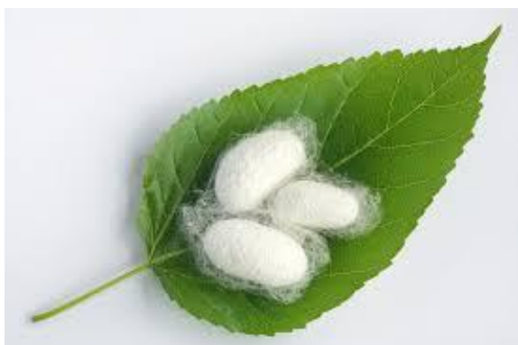
Kokoni sviloprejke na murvinem listu

Tudi to, sicer zelo razširjeno panogo, pa so na prelomu 19. stoletja pretresale številne težave. Po koncu prve svetovne vojne je trajalo kar nekaj časa, preden so ljudje obnovili svoja v vojni porušena domovanja. Med vojno so veliko murvinih dreves požgali za kurjavo, zato je bilo treba obnoviti tudi nasade murv. Sčasoma so se stvari normalizirale, vendar je prišla druga svetovna vojna, ki je razvoj spet ustavila, pa ne popolnoma. Še vedno so trgovali s sviloprejkami. Nekateri so prodajali jajčeca gosenic, drugi murvino listje. Sviloprejke morajo dobiti čim bolj sveže liste, ki ne smejo biti mokri ali uveli.