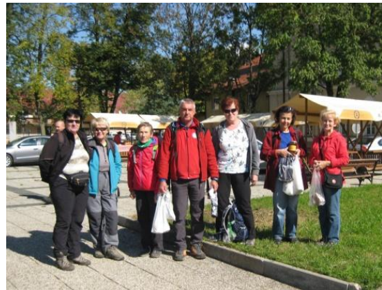
Za popoldn dan smo nabavili še slastne dobrote na domači tržnici.

Nato smo pohiteli še do bližnje tržnice, kjer smo že prej opazili, da domačini prodajajo svoje domače izdelke. Ponujali so razne slastne domače mesne izdelke, piškote, med, česen in druge dobrote, ki so kar klicali k nakupu.