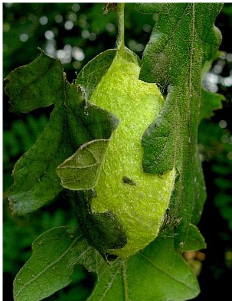
Kokon japonske sviloprejke

mestih Slovenije, o čemer so poročali, kasneje tudi na Hrvaškem, v Avstriji, Italiji, na Madžarskem in drugih državah. Ker jamamaj ni preveč dober letalec, se je vrsta počasi in postopno širila.