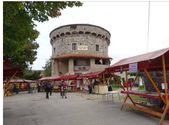
Na osrednjem trgu v Lokvi dominira kamniti stolp, ki je preurejen v vojaški muzej.

Zelo hitro smo prišli do znanega kraškega naselja Lokve. Vas je dobila ime po lokvah in lokvicah oz. kalu, kjer so napajali živino. V središču vasi stoji velik kamnit stolp, ki so ga leta 1485 zgradili Benečani za obrambo pred turškimi vpadi. Stolp je danes glavna veduta na vseh fotografijah tega naselja. Sedaj služi vojaškemu muzeju, ki je največja privatna zbirka različnih vojaških eksponatov v Sloveniji. Lahko se pohvali s številnimi domačimi in mednarodnimi priznanji ter plaketami. Sami si ga nismo ogledali, ker je bil v času našega obiska zaprt.