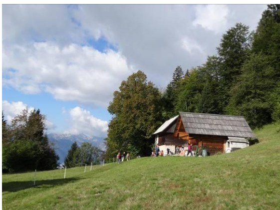
Prvi postanek na Planini Javornica.

Pot – kolovoz - ni bila markirana, a povsem nedvoumna, po njej gotovo ženejo govedo na sočne pašnike planin Javornice, Zajamnikov in Praprotnice. Sprva zelo lagoden vzpon se je stopnjeval v znosno strmino skozi gozd, nato pa se je kar nenadoma pred nami razprla zelena planina Javornica v vsej svoji širjavi, mehki in toploti. Ob dveh stajah smo počili in se okrepčali.