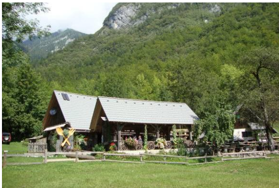
Okrepčevalnica pri slapu.

V bližini je odlična okrepčevalnica z bogato ponudbo okusne domače hrane, jabolčni in skutni zavitek. Tu smo se tudi mi okrepčali.