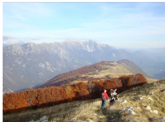
Končujemo turo, povratek na Planino Božica.

Prečimo vrhove Njivica 1602m, Puntarič 1561m, Ribežni 1518m, M. Muzec 1612m in vso to pot bomo prehodili še v obratno smer.