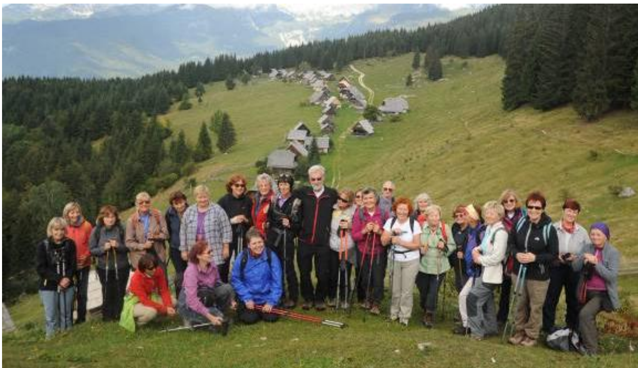
Veseli udeleženci izleta nad čudovito Planino Zajamniki.

Še malo ozke potke in že smo v gozdu na poti do Planine Praprotnice. Eni uhajajo v bregove za gobami, druge(i) sledijo vodniku in stokajo, da bi se morale(i) zapoditi po gozdu pa bi jih nabrale(i) polno, tretji si mislimo svoje. Ponovno postanek in hlajenje pregretim nog na skladovnici hlodov na Praprotnici, kjer traktorji že naznanjajo ceste in živinorejo.