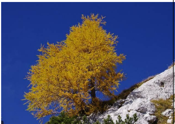
Macesen v Alpah, na izletu Zapotok – Velika vrata, v oktobru 2013

Iglice so spomladi živo svetlozelene barve, poleti temnejših zelenih odtenkov, preden v jeseni odpadejo, pa postanejo živo rumene barve. Moška in ženska socvetja vedno poganjajo iz istih poganjkov. Moška so majhna in rdeča, ženska pa so pokončni rjavorumeni storžki z na koncu zavihanimi luskami. Iz teh storžkov izpada seme, s katerim se macesen razmnožuje.