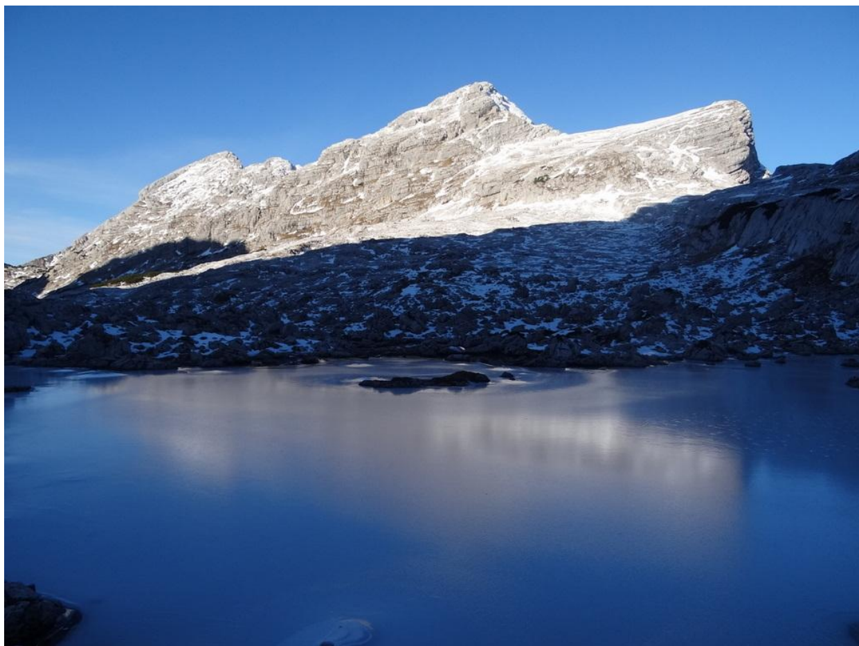
Zamrznjeno Zeleno jezero

Letnik XXXVIII – december 2013, št. 4 ISSN 1318-9484