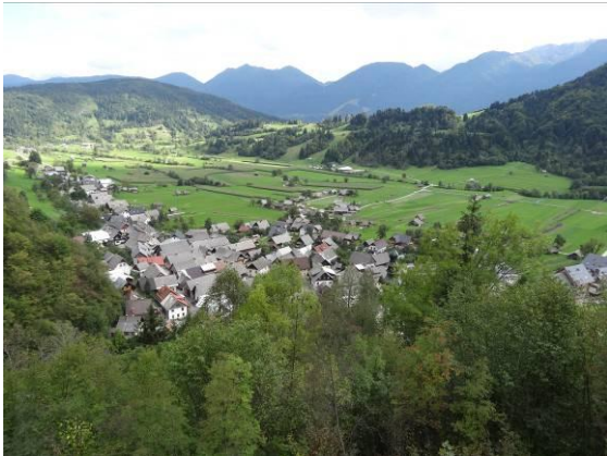
Pri povratku v dolino smo imeli prečudovit pogled na Srednjo vas.

Povratek in spust v Srednjo vas v Bohinju je bil čaroben in mehko udoben vsaj pol poti, zadnji del po kamnitem kolovozu pa se nam je utrujenim kar vlekel.