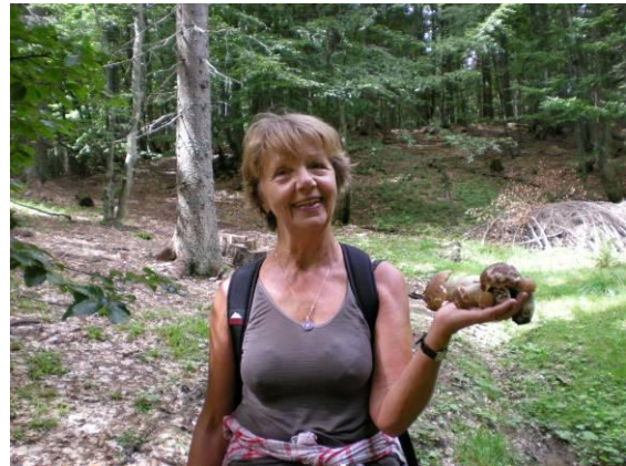
Na Jerebikovcu leta 2007.

Spoznali sva se pred mnogimi leti v podjetju »Iskra«, kjer sva bili zaposleni. Imeli smo zelo aktivno planinsko društvo in ko je v našem glasilu »ISKRA« prebrala o vabilih na planinske izlete, se nam je takoj priključila. Njena ljubezen do narave in planin je bila tolikšna, da ni zamudila nobenega izleta. Navdušila sem jo tudi za tek na smučeh. Nepozabni so spomini, ko sva po službi hiteli na avtobus do Lesc in potem peš na Jelovico. Vračali sva se že v temi, pa sem jo tolažila: »Nič se ne boj, saj nama luna sveti«. Včasih so bile zime z veliko snega in ko sva padli, sva padli na mehko. Neizmerno sva uživali čeprav sva bili utrujeni do onemoglosti. Joj, koliko je bilo smeha!