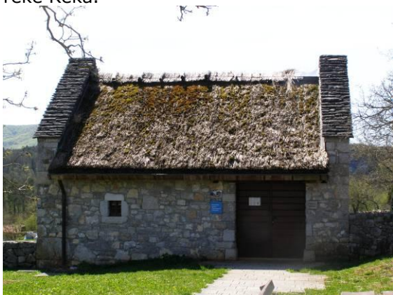
Lepo vzdrževan Jurjev skedenj.

V Škocjanu smo obiskali odprti muzej »Jurjev skedenj«, v katerem je miniatura etnološka zbirka Škocjanskih jam ter maketa prečnega prereza podzemnega kanjona reke Reka in parka Škocjanskih jam. Ustavili smo se tudi pri razglediščih pri cerkvi v Škocjanu, s katerih se lepo vidijo globoke udornice in prepadne stene reke Reka.