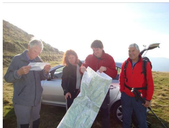
Jutro na Planini Božca.

Pot je dolga, tako smo se še v temi zbrali in vodnik je odpeljal štiri planince. Pot je vodila čez Predel do Učje. Od tu naprej pa po gozdni cesti. Imeli smo srečo, cesta je bila v dobrem stanju, da smo se lahko pripeljali na Pl. Božico, ki leži na višini 1405m.