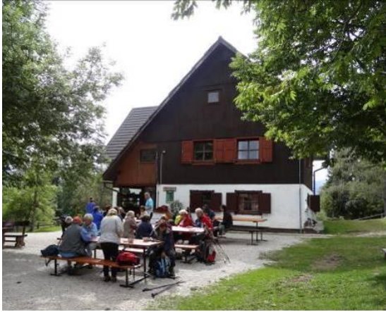
Pri koči na Uskovnici smo se okrepčali z različnimi jedmi na žlico.

Povratek in spust v Srednjo vas v Bohinju je bil čaroben in mehko udoben vsaj pol poti, zadnji del po kamnitem kolovozu pa se nam je utrujenim kar vlekel.