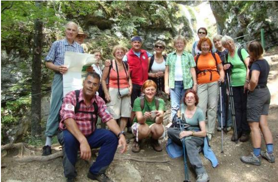
Udeleženci izleta pred slapom.

V bližini je odlična okrepčevalnica z bogato ponudbo okusne domače hrane, jabolčni in skutni zavitek. Tu smo se tudi mi okrepčali.