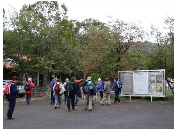
Naša hoja se je pričela pri znani kraški jami Vilenica.

Naša pešpot se je pričela pri kraški jami Vilenica. Znano je, da je Vilenica zaslovela že v 17. stoletju kot prva turistična jama v Evropi. Jama je nekoč močno burila domišljijo domačinov, ki so verjeli, da v njej prebivajo dobre vile. Tako je Vilenica dobila svoje ime. Jama je zanimiva za obisk zaradi bogastva kapnikov, v osemdesetih letih pa je postala stičišče slovenskih pisateljev in pesnikov, kasneje pa je prerasla v kraj za Mednarodni literarni festival.