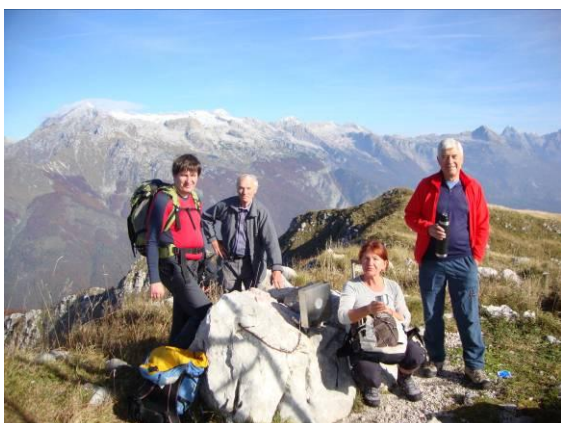
Kobariški Stol, 1673 m.