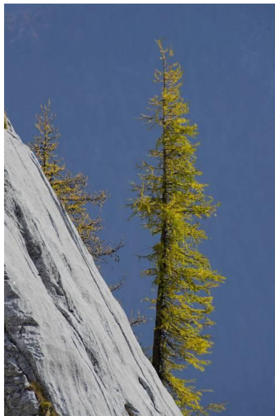
Visokogorski macesen pod Bavškim Grintavcem, oktober 2013

Macesnov les je težak, prožen in zelo trajen les, ki se uporablja v gradbeništvu predvsem za izdelavo čolnov, električnih drog, fasad, ograj in železniških pragov.