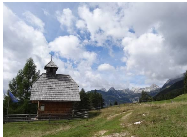
Ob Marijini cerkvici blizu Uskovnice je krasen pogled na naše očake.

vedno velja tisti vojaški izrek: »Kartu čitaj i seljaka pitaj.« Domačina pa nobenega od nikoder.