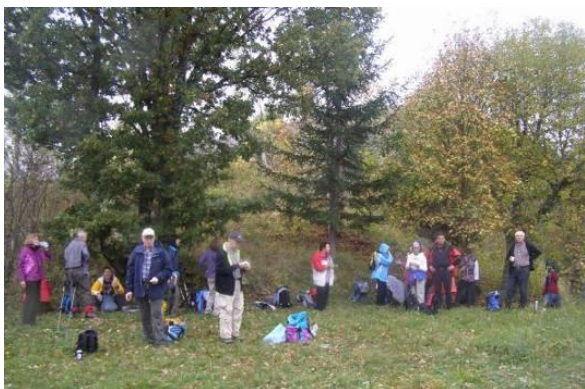
Med potjo smo imeli krajši postanek tudi za dobrote iz nahrbtnika.

Pot smo nadaljevali po kolovozih in travnikih ob reki Sušici proti koritu reke Reka. Sledil je kar strm spust do korita reke Reka. Občudovali smo temnomodro vodo v koritu Reke ter njeno moč, ki se je v mogočnih kraških stenah poglobljala in naredila neverjetne useke in soteske, ki najbrž očarajo vsakega obiskovalca, ki zaide v te kraje. Iz teh naravnih lepot korita reke Reka smo se povzpeli do vasi Naklo (ni na Gorenjskem), od tam po asfaltu v Matavun in naprej v Škocjan. Lepe kraške vasi, ki so nas očarale s svojimi lepimi hišami med kamnitimi ograjami in kamnitimi stezami.