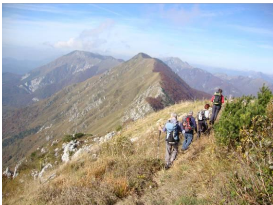
Naša pot poteka po grebenu, cilj se skriva.

Naša današnja pot poteka po grebenu s spusti in spet vzpenjanjem, tako imaš nekaj pravega planinskega občutka, vseskozi pa previdnost in siguren korak. Južna pobočja so strma, gola, porasla s travo globoko do Breginja, na severu se poraščena spuščajo v dolino Učjo.