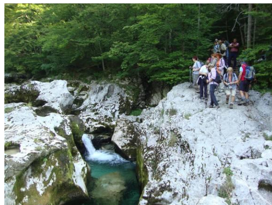
Ogled zanimivosti Mostnice.

Nadaljujemo do vstopne blagajne in nato po levem bregu. Potok Mostnica je v skalo vrezal 2km dolga korita, ki ponujajo zanimiv, nezahteven izlet v bohinjskem koncu. Struga potoka se na nekaterih mestih povsem zoži na 1m, korita pa so globoka do 20m.