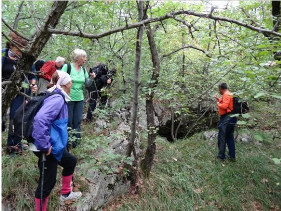
Pot nas je vodila mimo velike naravne kraške jame.

pastirji lahko zatekli v primeru slabega vremena.