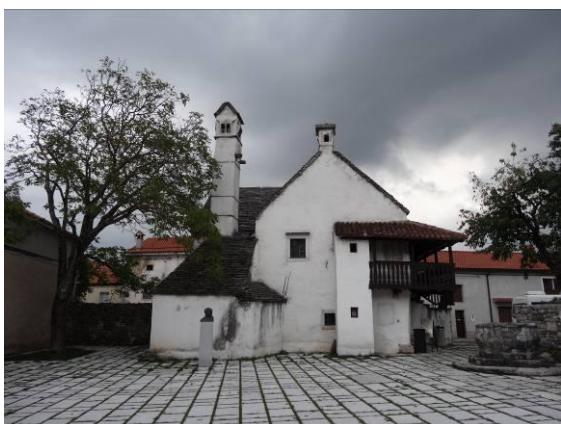
Rojstna hiša znane igralke Ite Rine v Divači je spremenjena v muzej.

Naš zadnji postanek pa je bil še v Divači, in sicer pri rojstni hiši ene naših prvih igralk Ide Kravanja z umetniškim imenom Ita Rina (1907 – 1979), ki se ji je uspelo uveljaviti tudi zunaj naših meja.