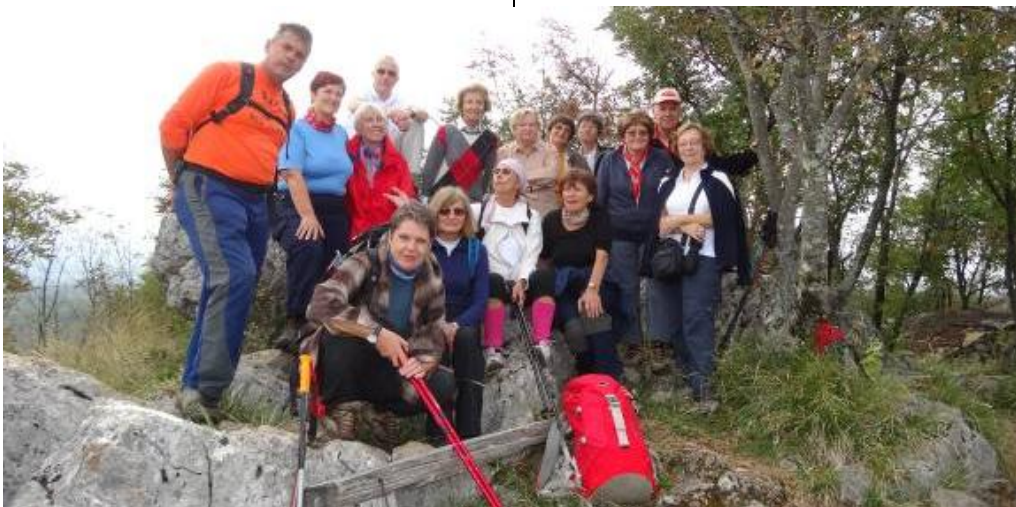
Brez velikih naporov smo osvojili vrh Starega tabora.

V znani kraški gostilni Muha, smo se najprej okrepčali z joto, poizkusiti pa je bilo potrebno tudi odličen kraški teran.