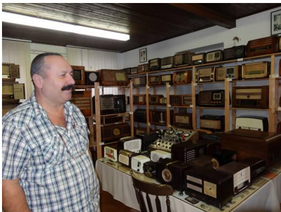
Zbiratelj starih radijskih sprejemnikov nam je ponosno razkazal svojo zbirko.

Na poti proti kombiju smo nekateri viharniki imeli to srečo, da nas je ogovoril domačin in povabil v bližnje poslopje na ogled njegove zasebne zbirke starih radijskih sprejemnikov. Na velikem prostoru se je gnetlo ogromno radijskih sprejemnikov najrazličnejših velikosti in oblik.