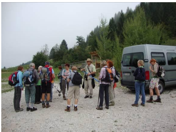
Jutro pred pohodom nad Staro Fužino.

Na poznopoletni dan, 7. 9. 2013, smo obiskali Korita Mostnice. Mostnica je alpski potok s koriti, draslami in slapovi, ki nam po panoramski poti skozi dolino Voje vse do Stare Fužine ponuja na ogled zanimivo delo narave.