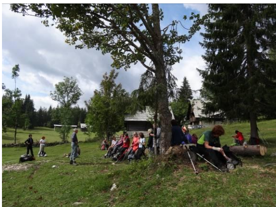
Prijeten oddih na Planini Praprotnica.

Še malo ozke potke in že smo v gozdu na poti do Planine Praprotnice. Eni uhajajo v bregove za gobami, druge(i) sledijo vodniku in stokajo, da bi se morale(i) zapoditi po gozdu pa bi jih nabrale(i) polno, tretji si mislimo svoje. Ponovno postanek in hlajenje pregretim nog na skladovnici hlodov na Praprotnici, kjer traktorji že naznanjajo ceste in živinorejo.