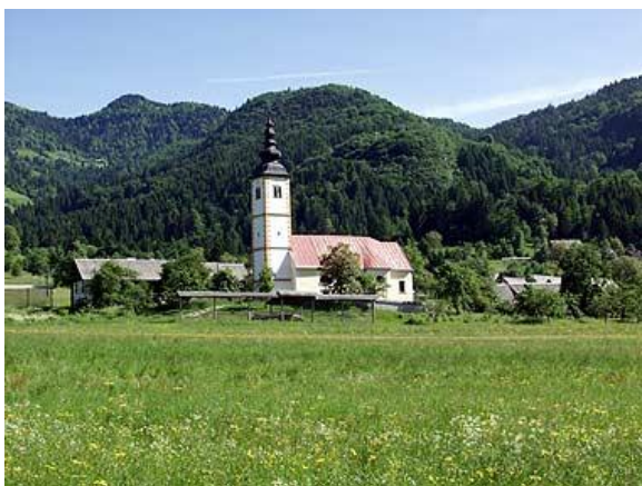
Naše izhodišče je bilo v bližini vasi Podjelje

Tokrat potreb po kavi ni bilo, zato jutra nismo zapravljali za postanke, poleta so nam dajali tudi obsijani vrhovi Julijcev in Karavank v spokojni jutranji svežini. Bolj ko smo se bližali Bohinju, bolj smo tonili v meglo. A hoditi smo začeli v vasi Podjelje, že dvignjeni nad mlečno cesto.