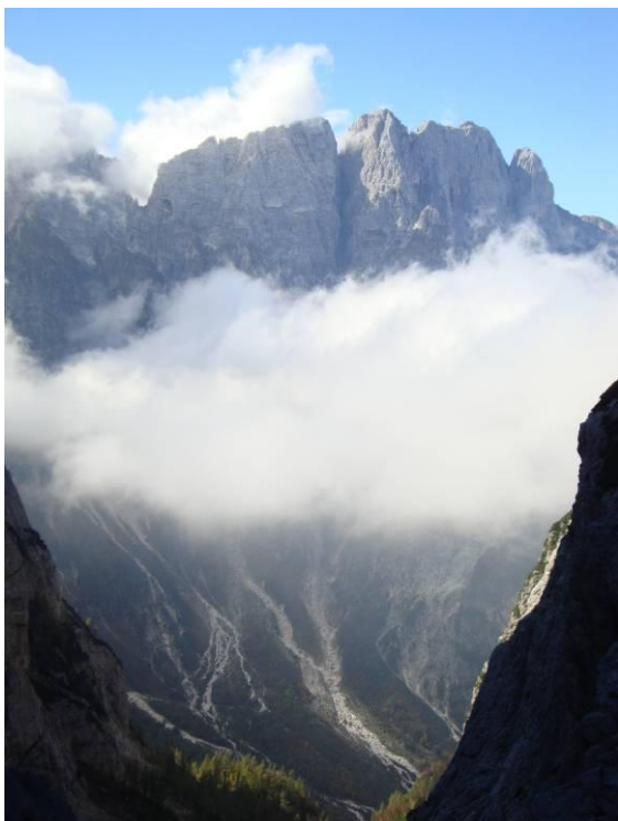
Pogled s sedla Nabois v Jezersko dolino in na Montaž.

opazovali čredo gamsov – le kaj so pasli na melišču med kamenjem? Dosegli smo sedlo, kjer se je odprl pogled na sončno stran v Jezersko dolino/Val rio del Lago z ostenjem mogočnega Montaža/Jof di Montasio. Na sedlu je hladno pihalo, zato se ne zadržimo dolgo, naredimo nekaj posnetkov in po isti stezi sestopimo, da ne bi ostali pri koči predolgo čakali, kajti koča stoji na senčni strani Alp. Tako jo v tem času ni grelo sonce, glede na lego je pa odlično izhodišče za obisk okoliških vrhov. Tu smo spoznali resničnost o senčni strani Alp.