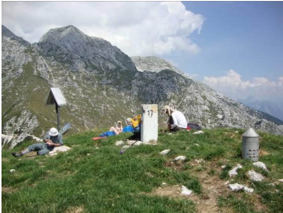
Počitek na vrhu osvojenega Skutnika.

Skutnik je mejni vrh, tako je označeno z mejnim kamnom, na italijanski strani z njihovim simbolom, na slovenski strani z miniaturnim Aljaževim stolpom. Kljub nezavidljivi višini je neverjeten razglednik.