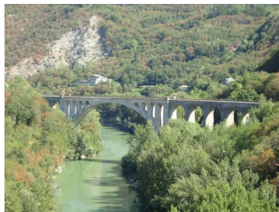
Železniški most čez reko Sočo.

Nadaljujemo do Solkana, spijemo kavo in se sprehodimo čez most nad Sočo, od koder si ogledamo kamniti železniški most - tehnični spomenik, ki je bil v času nastanka največji v Evropi, 200m dolg s 85m dolgim lokom iz klesanega kamna - še vedno je impozanten. Medtem si pogledamo še pogumneže, ki z mostu nad Sočo skačejo »bungee jumping« - noro. Solkan ima bogato zgodovino, med drugim prvo javno čitalnico. Na tabli čitalnice je napisan verz, ki ga je leta 1947 ob priključitvi Gorice Italiji napisal pesnik Oton Župančič: »Zlobne meje nimajo prihodnosti.« Kako resnična misel!