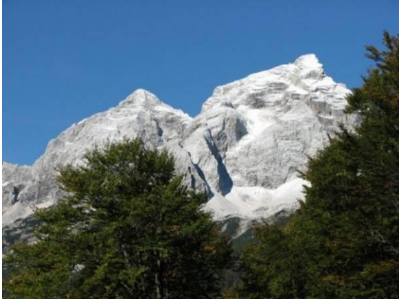
Ozebnik in Jalovec.

Zamaknjeno sem strmela v veličastno skalovje, ki ga je oblikovala narava, ko je po Jalovškem Ozebniku strahovito zagrmelo. Sonce je ogrelo sivo skalovje in kamenje, ki se je odkrušilo, je zgrmelo v globino proti dolini Tamarja. Zastal mi je dih, po hrbtu sem čutila mravljince in previdno sem se odmaknila od roba prepada.