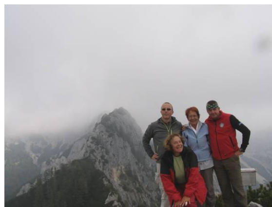
Na vrhu Dedca, ki se ponaša s 1583 m.