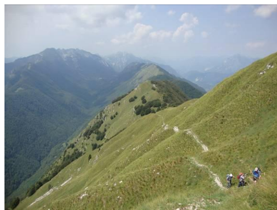
Pogled po grebenu pristopa.

Pripeljali smo se do konca asfaltirane ceste, tu smo začeli s turo. Dan je bil še mlad in vreme stabilno. Korak usmerimo cilju naproti. Da smo stopili na stezo, smo najprej morali zgubiti dobrih sto metrov višine. V zaselku Zgornja Slatina vstopimo na stezo, ki pripelje iz vasi Korito/Coritis, nato pa strmo v breg bukovega gozda. Pridemo na greben Pradolino, od tu naprej strmina popusti in steza zložno pelje po grebenu in razgled se odpre vse okrog nas.