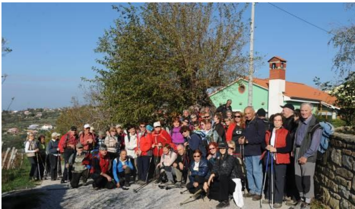
Vsi udeleženci pohoda pred mogočno murvo na Kolombanu.

lom peščenjaka. Iz peščenjaka so bili zgrajeni tako utrdba na Kaštelirju kot tudi cerkev v Starih Miljah, miljsko obzidje ter pomoli in valobrani v Tržaškem zalivu.