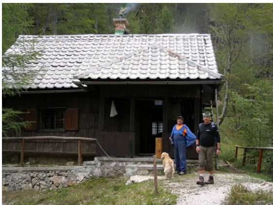
Lovska hiška, zgrajena za potrebe lova maršala Tita.

hiša , ki je bila zgrajena za potrebe lova maršala Tita in njegove družbe.