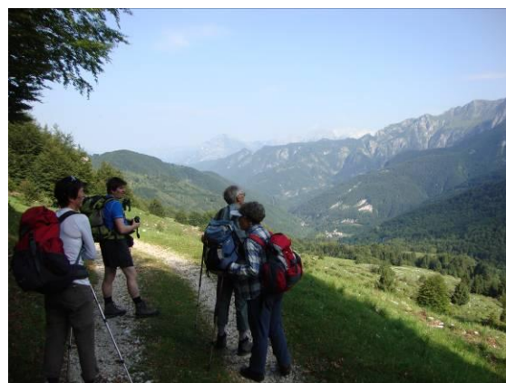
Jutro, pričetek naše ture.

pot«. Od tu naprej se pot še zoži in po strmi cesti pelje skozi vas Korito/Coritis, ki pa ni več stalno naseljena, naprej pod planino Kot/Coot, ki je zadnja planina v zatrepu doline Rezije. Pot je asfaltirana in mestoma tlakovana s kamni, do planine Kot/Coot so pred kratkim položili beton.