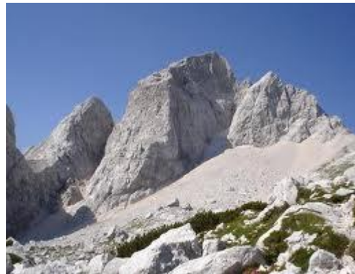
Mogočni Jalovec

Jalovcu, kjer je še nekaj snega in si bom na hitro in za silo pridobila nekaj izkušenj. Lepa, zahtevna in spoštovanja vredna gora.