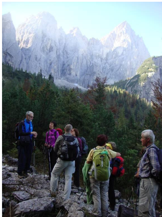
Krajši razgledi, od tu se že vidi koča.

Tu že vzremo naš cilj, ki ni več daleč, z vztrajnim korakom smo kmalu pri koči. Koča je velika, obnovljena, tokrat je bila že zaprta, ima pa tudi lepo zimsko sobo – bivak. To je bil naš današnji cilj. Okrepčamo se in ker imamo še dovolj časa, je vodnik predlagal, da se lahko povzpemo še na sedlo Sella Nabojs 1970 m.