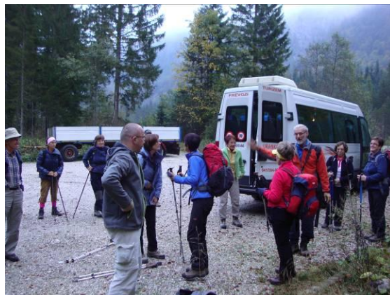
Jutro pred pričetkom ture.

razloži, katere vrhove vidimo in katere smo viharniki že obiskali