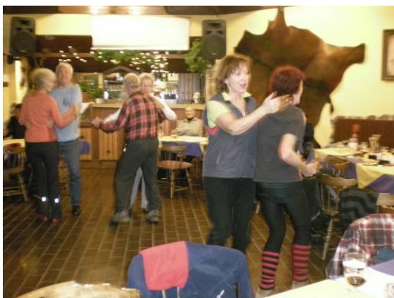
Veselo razpoloženje na Mengeški koči.