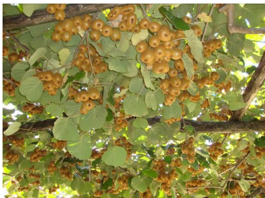
Kivi pri samostanu Kostanjevica.