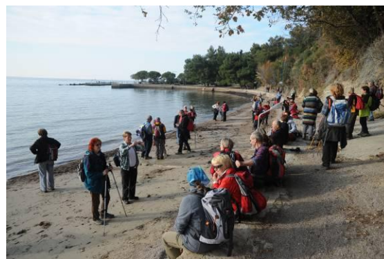
Pri Debelem rtiču so se udeleženci pohoda sprehodili prav do morske obale.

Preko kolovoza, speljanega med čudovitimi in prostranimi vinogradi, smo prišli do Debelega rtiča. Šli smo mimo mladinskega zdravilišča prav do obale in še zadnjič v letošnjem letu pomočili prst v slano vodo in poizkusili določiti temperaturo vode.