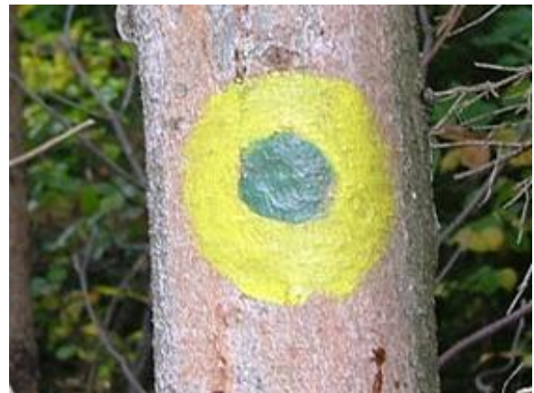
Markacija za učno pot.

Naravoslovne učne poti so speljane po gozdni, travnati ali grmičevnati pokrajini, kjer spoznavamo gozdne rastline, živali, tradicionalne obrti, naravne pojave ipd. Naravoslovne učne poti so običajno označene z zeleno- rumenimi markacijami.