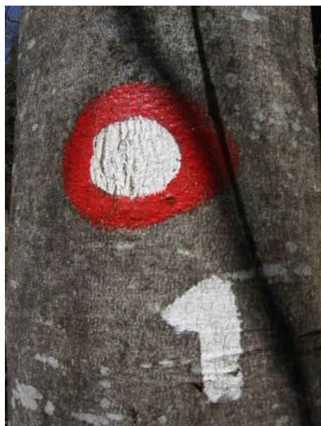
Knafelčeva markacija za Slovensko planinsko pot.

Poleg standardne markacije so včasih zraven pripisane tudi številke ali črke, ki dodatno označujejo pot. Med najbolj prepoznane se uvršča Slovenska planinska pot ali Transverzala, ki vodi od Maribora do Ankarana. Ta pot je bila prva vezna pot v Alpah. Po njenem zgledu so jih začeli urejati tudi v drugih alpskih regijah. Ta pot je označena s Knafelčevo markacijo in majhno številko 1. Zasavska planinska pot pa ima preko markacije črko Z.