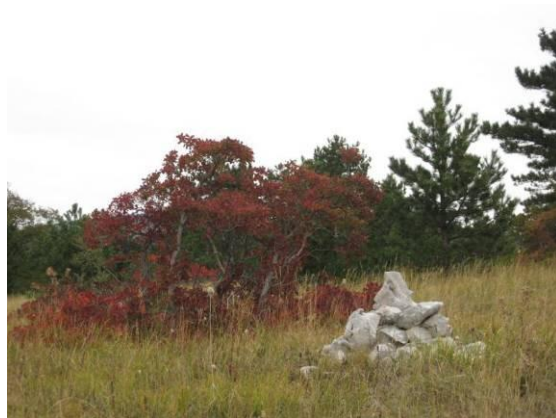
Kamniti možic na travniku.

Zelo staro, vendar še vedno aktualno in uporabno oznako za smer predstavlja tudi možic. Uporabljajo ga po vsem svetu. Gre za umetno postavljen kup kamnja. Sestavljen je iz različno velikih kamnov, ki se polagajo drug na drugega. Te oznake so še posebej pomembne na težavnem in gorskem terenu, v stepah in puščavah. Pohodniki, ki pridejo do možica, lahko dodajo nov kamen na vrh in ga tako ohranjajo, saj bi ga sicer naravne sile sčasoma uničile.