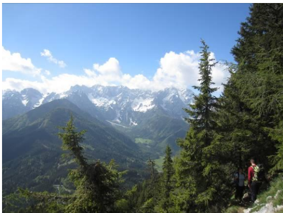
Razgled med potjo – dolina Ravenske Kočne in vrhovi nad njo.

Od tu nas je razveseljeval lep pogled na posamezne vrhove Kamniških in Savinjskih Alp nad dolino Ravenske Kočne, ki so bili še povsem zasneženi, medtem ko smo se mi vzpenjali po že popolnoma kopnem pobočju. Kratek vzpon, kjer nam je bila v pomoč jeklenica, nas je pripeljal na zahodna pobočja, kjer se nam je odprl pogled na najdaljši slovenski greben Košuto ter na mnoge druge vrhove.