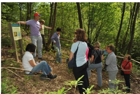
Na rastišču redke in zaščitene pontske azaleje pri vasi Brusnice.

Pozdravil jo je zdravilni gorjanski koren, ki ji ga je dal berač, ko mu je dala večerjo in prenočišče v gradu. Mladost ji je povrnila voda, ki jo je pila iz studenčka, da se je počutila mlado kot takrat, ko je šla k poroki. Studenček se v spomin na ta dogodek imenuje Gospodična. Tudi mi smo se osvežili in si seveda povrnili malo mladosti, da smo se lahko vrnili na izhodišče naše poti, kjer nas je čakal naš prevoznik, ki nas je odpeljal nazaj proti domu.