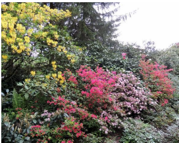
Rododendron ali sleč, od grmička do drevesa.

Ko sva zapuščala osrednji del arboretuma, sva srečevala vedno manj obiskovalcev. Z desne, iz gozda, sva poslušala žvrgolenje ptičkov, tu pa tam se je oglasila kukavica pa tudi kakšen kra-kra je bilo čuti. Posledice žleda so pridni delavci arboretuma že pospravili, so pa še vidni sledovi februarске katastrofe. Z leve sva občudovala v ravnih pasovih filigransko pokošene travnike in v daljavi ob poti vrsto pisano cvetočih slečev, ki so kar vabili k pritisku na sprožilec fotkiča. V slovo nama je pomahala kavka.