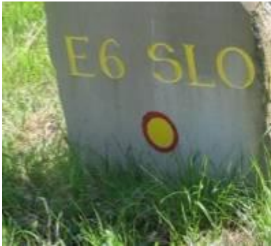
Markacija za evropsko pešpot.

Evropska pešpot E-7 pa poteka prek različnih evropskih dežel, od Atlantika – Sredozemskega morja – Gardskega jezera do južne Madžarske. Pot prihaja v našo državo iz Italije preko opuščenega mejnega prehoda Robič in se nadaljuje preko Porezna, Blegoša proti Škofji Loki, Vrhniki, do hriba Mačkovec (911 mnm), kjer se križa s pešpotjo E-6 in nadaljuje proti Krki, Dolenjskim Toplicam na Gorjance, do Kostanjevice na Krki, na Donačko goro, v Ormož, Moravske Toplice in Hodoš, kjer se pešpot na našem ozemlju konča, nato se nadaljuje po Madžarski.