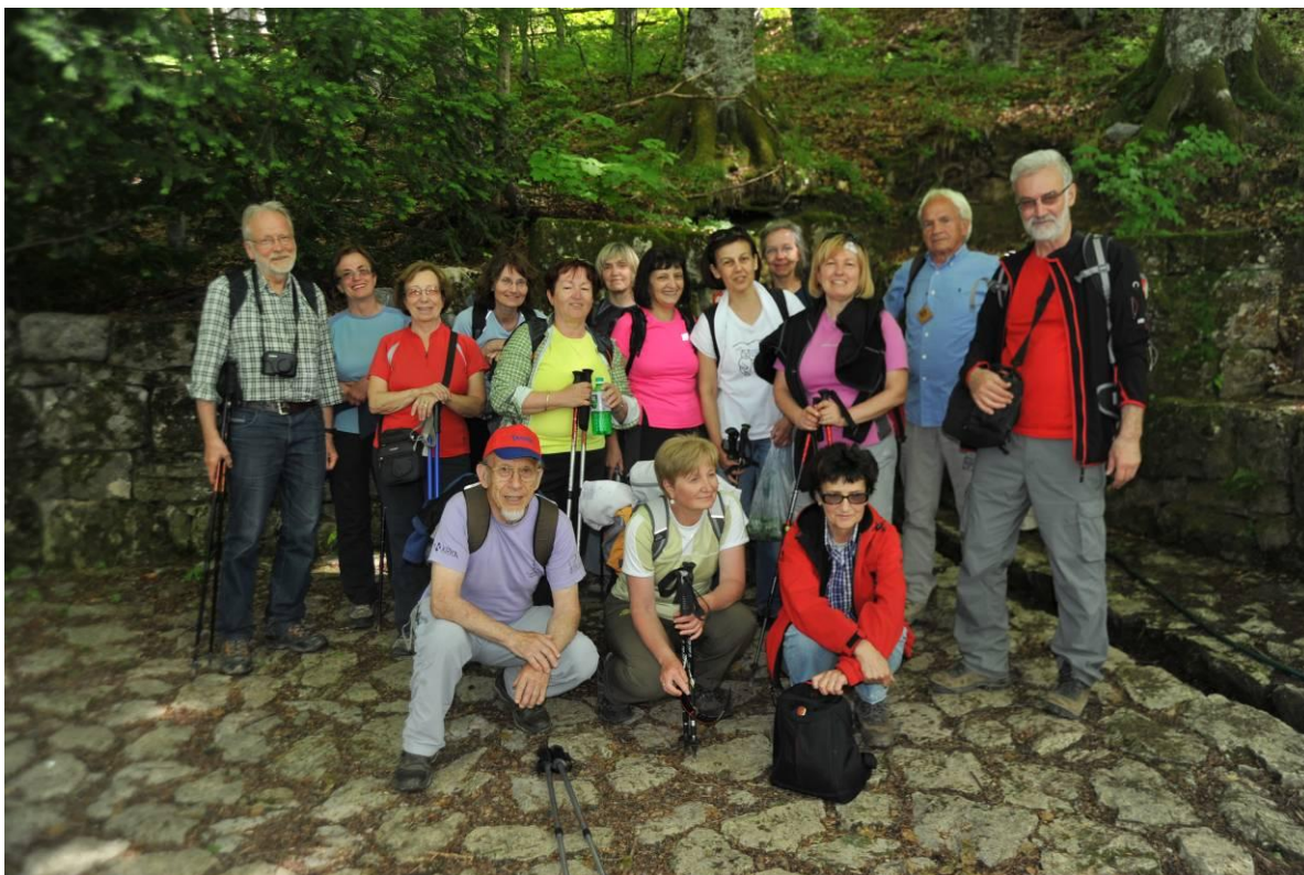
Vsi pomlajeni in polepšani pri izviru Gospodične.

Pozdravil jo je zdravilni gorjanski koren, ki ji ga je dal berač, ko mu je dala večerjo in prenočišče v gradu. Mladost ji je povrnila voda, ki jo je pila iz studenčka, da se je počutila mlado kot takrat, ko je šla k poroki. Studenček se v spomin na ta dogodek imenuje Gospodična. Tudi mi smo se osvežili in si seveda povrnili malo mladosti, da smo se lahko vrnili na izhodišče naše poti, kjer nas je čakal naš prevoznik, ki nas je odpeljal nazaj proti domu.