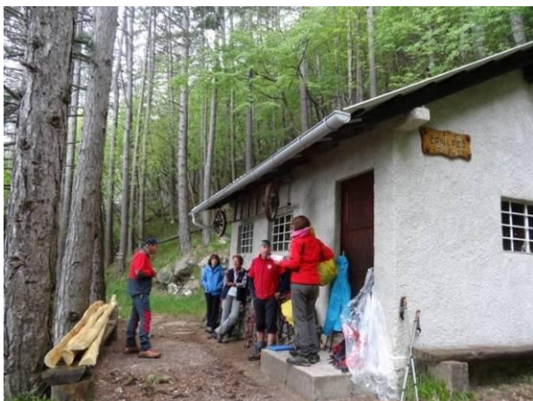
Počitek pri bivaku Črna peč, najvišji doseženi točki tokratnega izleta.

Na povratku v dolino smo pazili na naš korak, saj smo hodili po raznih stezicah in kolovozih, kjer so bili mokra trava in spolzko kamenje ter korenine.