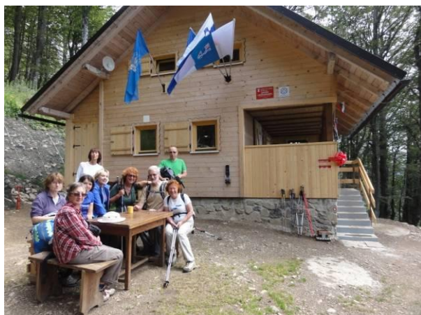
Nova brunarica Planinskega društva Preddvor v Borštu