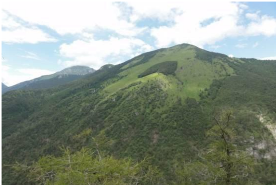
Zaplata sredi hriba je Hudičev boršt