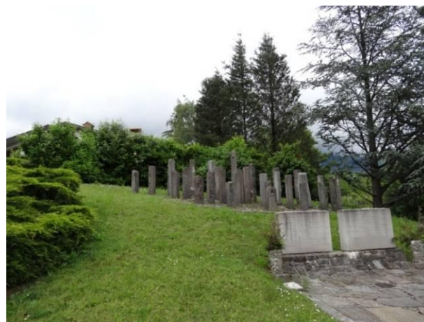
Spomenik padlim med drugo svetovno vojno v Vrtovinu.

Na začetku vasi Vrtovin pa smo si še ogledali enkratno zasnovan spomenik 28 padlim junakom in civilnim žrtvam v drugi svetovni vojni. Spomenik je zasnoval znani slovenski kipar Marko Pogačnik, ki ga poznamo kot avtorja grba v slovenski zastavi. Kamniti stebri predstavljajo položaj in višino posameznih vrhov v zaledju vasi, med katerimi je najvišji Kucelj.