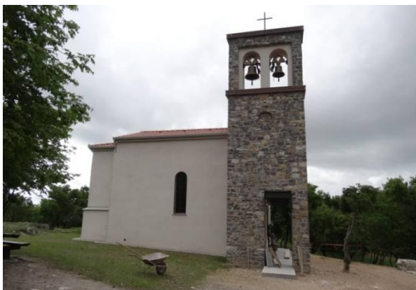
Cerkvica sv. Pavla na Školju.

Nato smo odšli na razgledno točko, kjer smo imeli kot na dlani velik del Vipavske doline. Lokalni vodnik nam je povedal, da so domačini to točko poimenovali tudi Na kresu, saj so prav na tem mestu v času turških vpadov in preteče nevarnosti kot opozorilo okoliškim prebivalcem po potrebi zakurili kres. Na Kresu pri cerkvi sv. Pavla je bilo tudi zbirališče uporniških kmetov iz Vipavske doline v času tolminskih puntov.