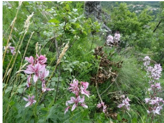
Lepa roza cvetlica, ki ji ne vem imena.

sviščev, kobulnic, kukavic, slizkov, strašnic, repuša, gorskega glavinca, itd. Izredno dominantna cvetlica v roza barvi, ki je spominjala na cvet lilije, me je še posebej prevzela, saj je doslej v naravi še nisem srečala. Kljub skrbnemu brskanju po internetu, da bi ugotovila ime te cvetlice, mi to ni uspelo.