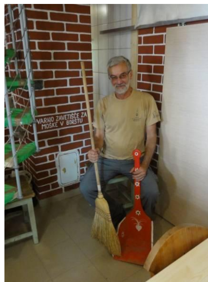
Varno zavetišče za moške.