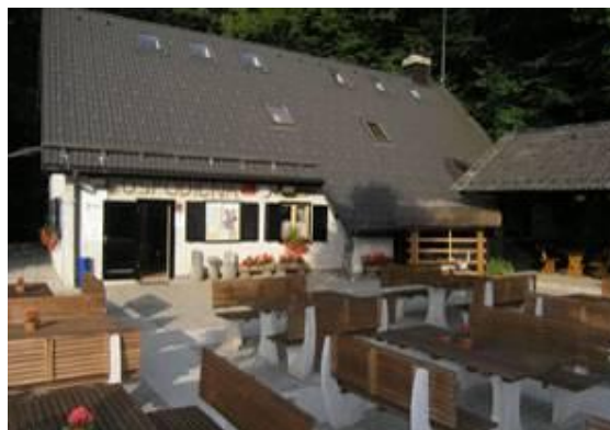
Planinski dom na Gosposodični

Prispeli smo do Planinskega doma pri Gosposodični (828m), ki so ga postavili Novomeščani. Med vojno pa je bil požgan, zato so leta 1949 na pogorišču postavili novo kočo, ki pa so jo večkrat prenovili.