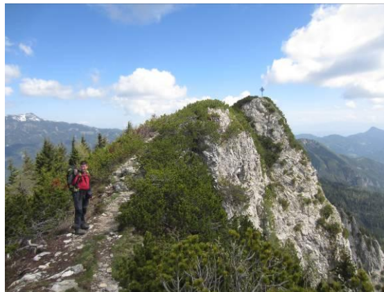
Zadnji del poti po grebenu do vrha.

Ta del je bil precej ruševnat. Do vrha smo morali premagati še strm vzpon ob jeklenici do grebena, po katerem smo se nato sprehodili do vrha (1759 m). Na njem stoji železen križ z napisom, ki nas Slovence verjetno nekoliko zbode: »Koroška, svobodna in nerazdeljena«.