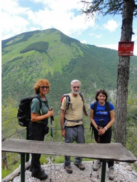
Izpod gore Javorov vrh, z ozadjem Hudičevega boršta, smo se nastavili fotografu Boštjanu.

Le 15 minut pod razglediščem je simpatična koč Iskre na hribu Sv. Jakoba, ki ima ime po cerkvi, imenovani po apostolu sv. Jakobu.