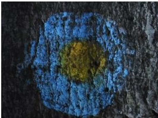
Markacija Poti kurirjev in vezistov.

Na naših planinskih poteh se velikokrat srečamo tudi z razvejano mrežo Poti kurirjev in vezistov NOV Slovenije, ki so označene z rumeno-modrimi markacijami. Modra barva predstavlja telekomunikacije, rumena pa pošto.