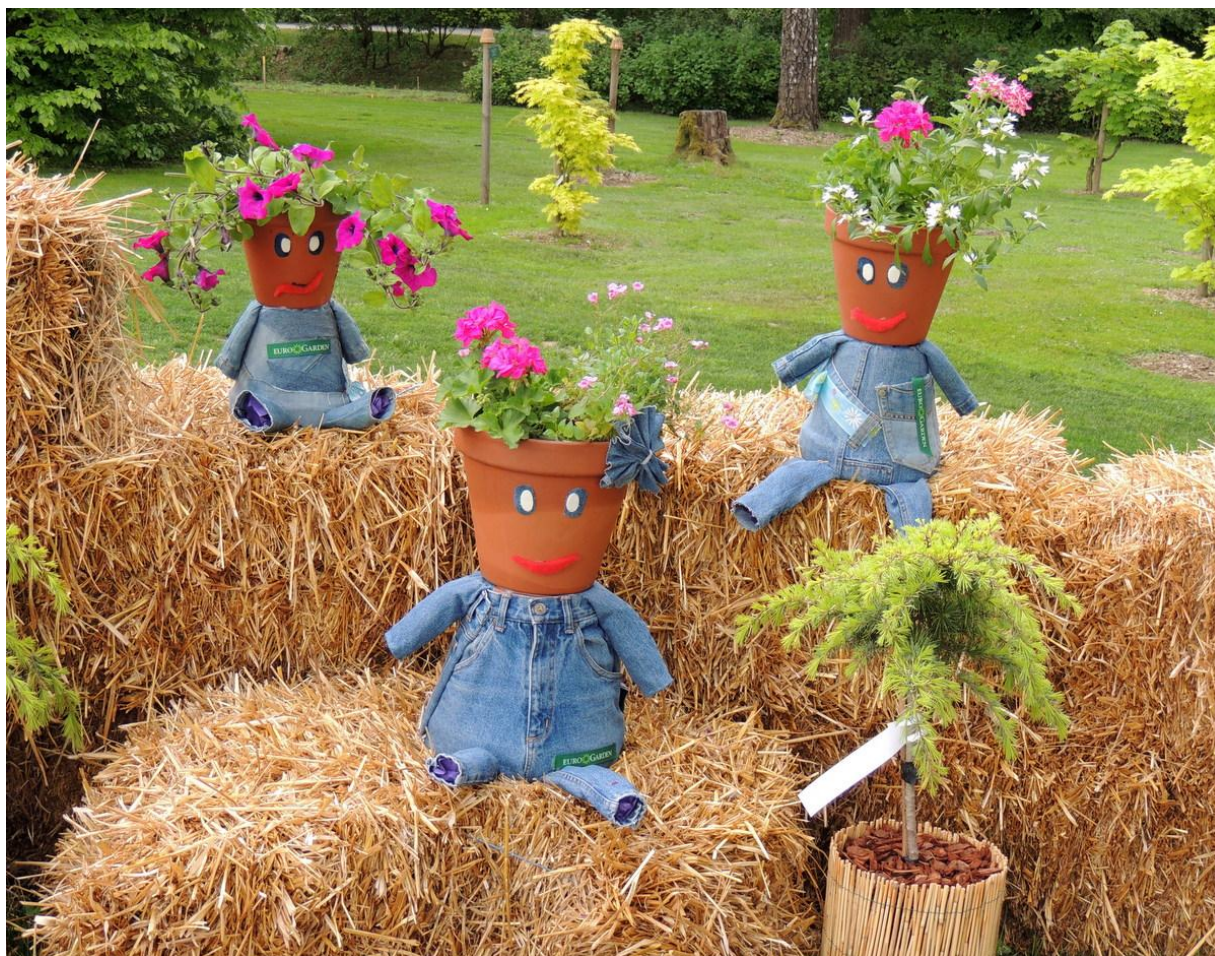
Igrivo razpoloženje v Volčjem Potoku

Letnik XXXIX – avgust 2014, št. 3 ISSN 1318-9484