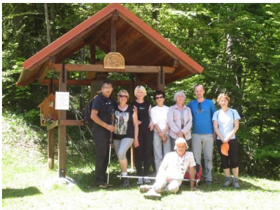
Prvi vmesni cilj je bilo sedlo Kot.