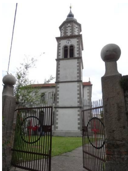
Cerkev sv. Marije v Vrtovinu.

Po dobri uri hoje smo prišli v vas Vrtovin. Gre za zelo staro naselje, saj obstajajo listine, da je že leta 1001 rimski cesar podaril območje te vasi ter številna druga naselja in posesti v last oglejski cerkvi. V središču vasi smo si ogledali zelo lepo baročno cerkev, posvečeno sv. Mariji. Cerkev hrani dragoceno opremo iz različnih obdobj. Med njo je poznogotska lesena plastika Marije z otrokom iz 15. stoletja. Preprost lesen križ na steni pa priča o tem, da je bila prva cerkev na tem prostoru postavljena že v 14. stoletju. Cerkev se ponaša tudi z najstarejšimi orglami v Sloveniji, na katere pa žal ni mogoče igrati, saj je bilo iz različnih vzrokov nekaj piščali prodanih.