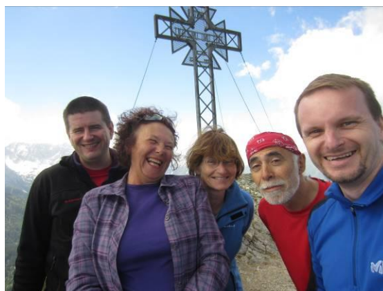
»Selfie« na vrhu Pristovškega Storžiča.

Na vrhu smo malce za šalo malce zares modrovali, da je bila tokratna planinska »odprava« pravzaprav netipična za Viharnik, od tod tudi naslov tega prispevka. Na planinskem izletu smo namreč prevladovali moški, tako da je bil vsaj enkrat odpravljen oziroma presežen matriarhat. Tudi starostno povprečje je bilo nižje kot običajno, tako da je tudi v tem pogledu izlet pomenil majhen odmik od uveljavljene prakse.