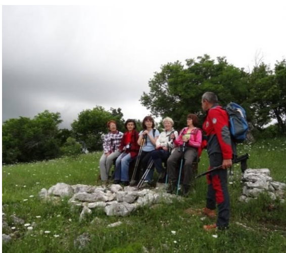
Na razgledni točki Na kresu.

Nato smo odšli na razgledno točko, kjer smo imeli kot na dlani velik del Vipavske doline. Lokalni vodnik nam je povedal, da so domačini to točko poimenovali tudi Na kresu, saj so prav na tem mestu v času turških vpadov in preteče nevarnosti kot opozorilo okoliškim prebivalcem po potrebi zakurili kres. Na Kresu pri cerkvi sv. Pavla je bilo tudi zbirališče uporniških kmetov iz Vipavske doline v času tolminskih puntov.