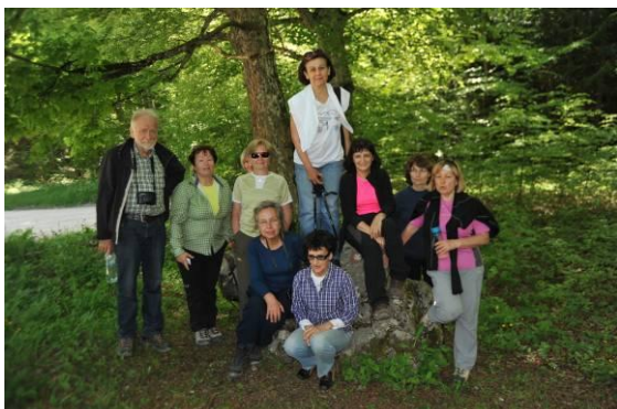
Hojo po Gorjancih smo začeli in zaključili pri Krvavem kamnu.

Pri Krvavem kamnu, ki se nahaja ob križišču poti, ki vodita z Gosposodične in Miklavža na Trdinov vrh, smo začeli naš planinski pohod. Krvavi kamen je kamniti osamelec na Gorjancih, ki ga spremlja mnogo legend, ena pravi, da kamen označuje mesto, kjer so pri določanju meje živa zakopali nedolžna fanta in dekle, njun grob pa zaznamovali s kamnom, ki je dobil ime Krvavi kamen.