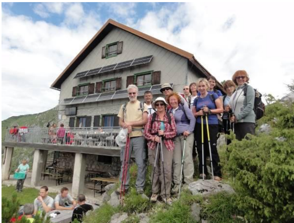
Viharniki pred Planinskim domom kokrškega odreda (1540) na Kališču.