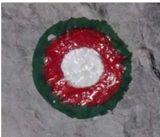
Markacija, ki označuje zeleno mejo.

Na naši severni meji lahko naletimo tudi na klasično belo-rdečo markacijo, ki je obdana z zelenim kolobarjem. Nekdaj je zeleni kolobar označeval zeleno mejo, obmejno območje z omejenim gibanjem.