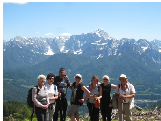
Pod Gorjansko planino – pogled na Julijske Alpe.

se naše oko lahko naužije takih lepot, je to samo še dodatna spodbuda, da so noge manj težke. Večinoma pa je pot, potem ko smo premagali ta vzpon, potekala po gozdni cesti in sama po sebi ni bila nič posebnega. Zanimiva se mi je zdela predvsem zato, ker je v posameznih delih izgledala kot nekakšna trasa mejnih kamnov, tako da smo izmenjaje se hodili po Italiji in Avstriji. V zadnjem delu poti smo spet prišli na »odprto« in znova lahko občudovali zasnežene mogočne vrhove Julijskih Alp. Odprti deli poti so prijetnejši tudi zato, ker je v tem delu zgodnje gorsko cvetje že bolj bohotno in tako bogati naše »pohajkovanje«. Po dveh urah in pol hoje od sedla smo prispeli na Gorjansko planino (Göriacher Alm).