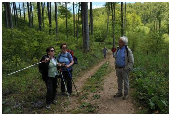
Na izletu je vedno tudi čas za klepet.

omenjena v listini iz leta 1447, danes pa so od nje vidne samo ruševine, nad katerimi so leta 2012 postavili streho.