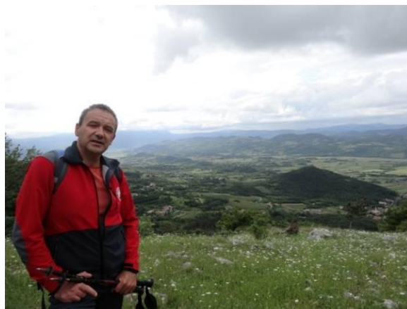
Lokalni vodnik pripoveduje zgodovinske dogodke.

Po približno urici in pol hoje proti našemu planinskemu vrhu pa so počasi pričele naletavati prve dežne kapljice. Nismo se vdali in nadaljevali pot v pričakovanju, da bo dež kmalu ponehal. Dež se ni dal in padal je vedno močnejše. Da bi bili vsi bolj optimistični, sta oba vodnika med potjo pripovedovala razne šale in anekdote.