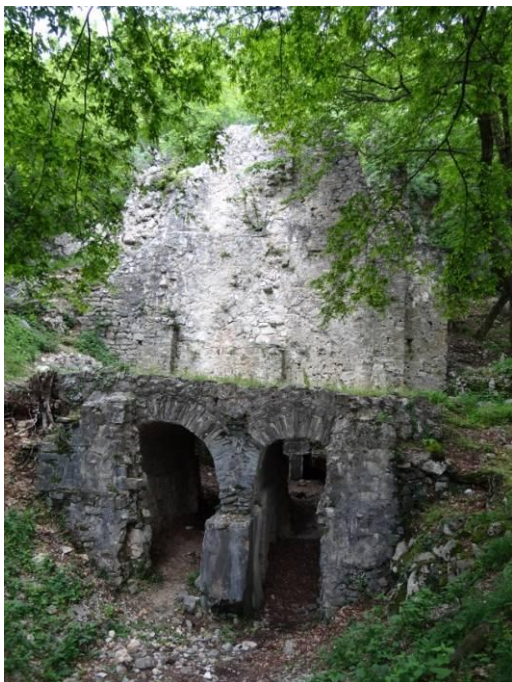
Vodni stolp, najbolj ohranjena tehnična antična stavba pri nas.

Pot nas je najprej vodila navkreber po bukovem gozdu. Naš prvi postanek je bil pri najbolj ohranjeni tehnični antični stavbi pri nas, vodnem stolpu. Antična stavba je hkrati tudi najvišja, saj meri 74 m. Lokalni vodnik nam je povedal, da so Rimljani ta objekt postavili v 5. stoletju ob studencu pitne vodne, saj je nedaleč stran potekala rimska cesta, ki je povezovala Oglej in Emono.