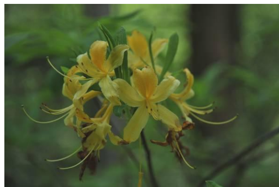
Rumeni sleč ali pontska azaleja.

Na poti smo si ogledali še posebno rastišče rhododendrona, ki je značilen samo za tisti predel in raste samo še na dveh krajih v Sloveniji. Dobre volje smo prispeli v Ljubljano, saj smo preživeli prečudovit dan.