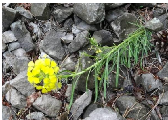
Endemit rebrinčevolistna hladnikija.

Na strmem grušču sem naenkrat zagledala rumeno cvetico. Odšla sem do nje in naredila posnetek. Kasneje se je pokazalo, da gre resnično za iskani endemit. Imeli smo izredno srečo, da smo jo videli, saj je v glavnem že odcvetela. Ime je dobila po ustanovitelju Botaničnega vrta v Ljubljani, Francu Hladniku.