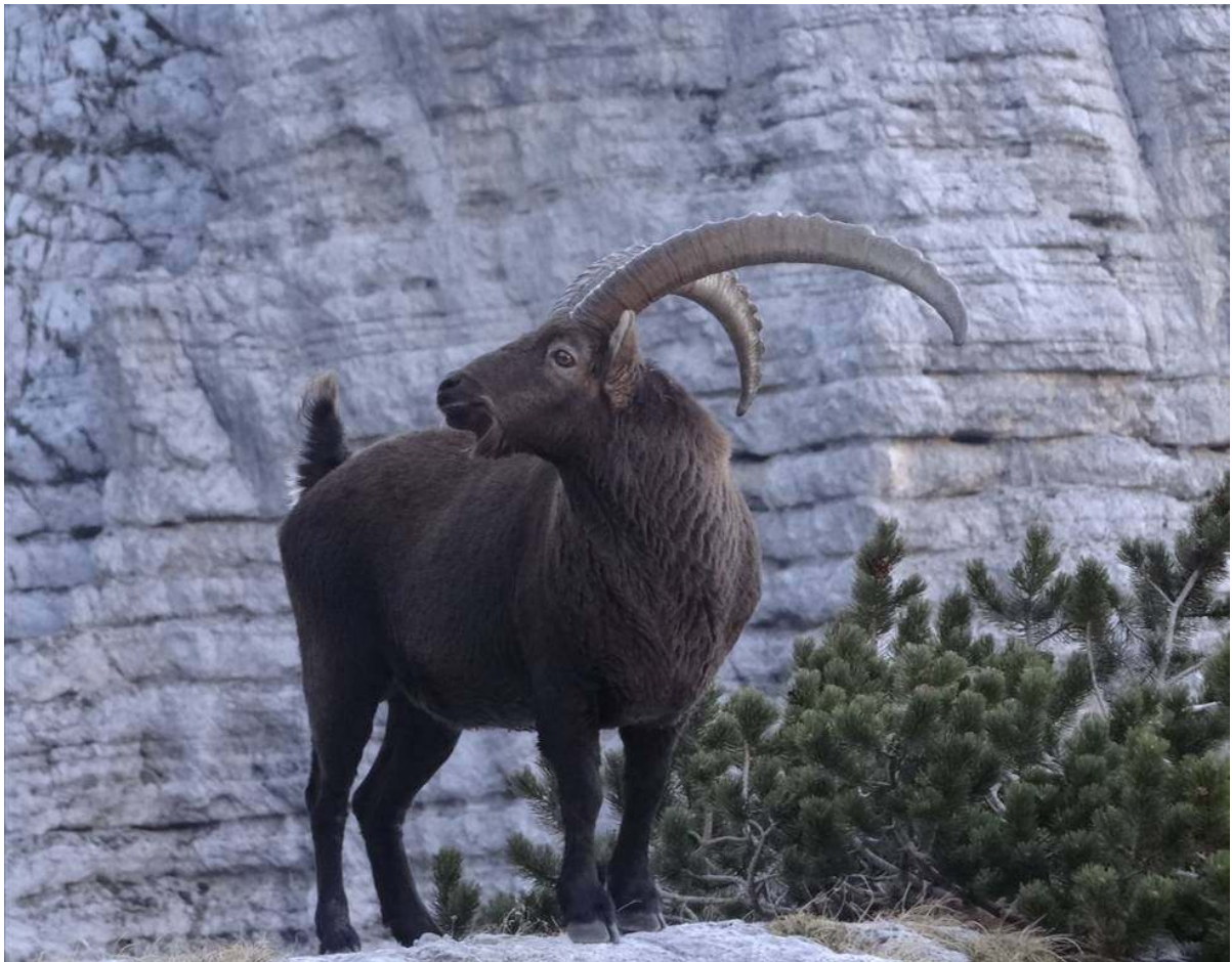
Kozorog pod Kriškimi podi

Letnik XXXVII – avgust 2012, št. 3 ISSN 1318-9484