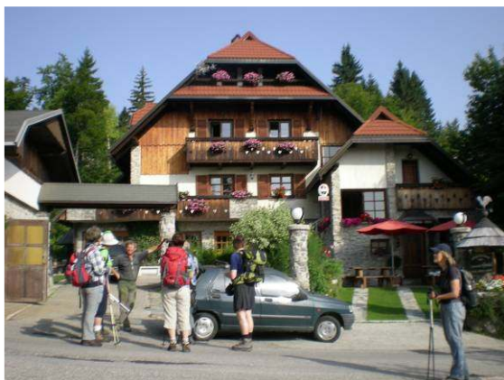
Planina na Vojskem – izhodišče izleta.

V soboto, 28. 7. ob 7. uri zjutraj, smo se zbrali dva viharnika in pet viharnic na parkirišču v Tivoliju in se pod vodstvom Grege z dvema osebnima avtomobiloma odpeljali po avtocesti do Logatca in naprej po lokalnih cestah preko Idrije na Vojsko, 1077 m. Vojsko je bilo izhodišče za izlet na Hudournik, 1148 m visoki vrh na Vojskarski planoti. Pot je potekala v začetku po vozni cesti, ki je bila na ravnini celo asfaltirana, v strminah pa makadamska.