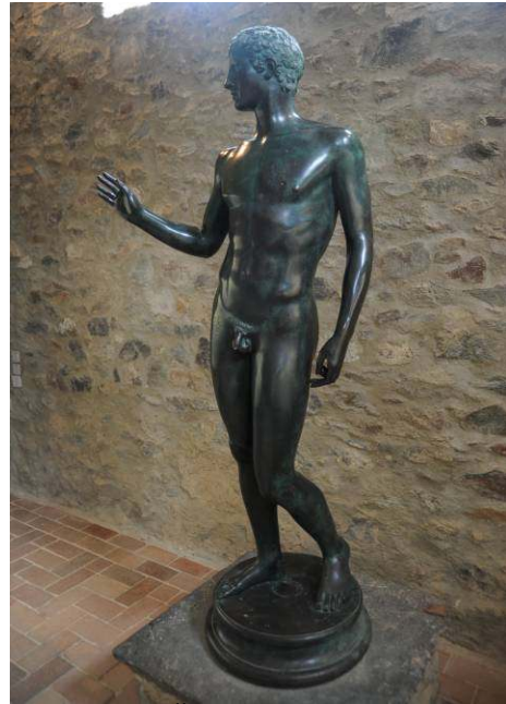
Mladenič s Štalenske gore.

Ostanki stavb naselja Noreja so bili odkriti leta 1948. Zgradbe so bile grajene po rimskem zgledu in so obsegale stanovanjske stavbe, delavnice, trgovine, javni trg z baziliko in javna kopališča.