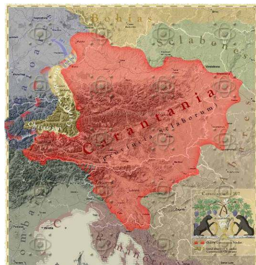
Karantanija leta 597

Toda prvi najdeni zapisi o ustoličevanju karantanskih knezov so nastali leta 595! Torej smo imeli že v šestem stoletju, ko smo kot divje »horde« pridivjali izza Karpatov, svojo državo s pravno ureditvijo (ustavo), svoje plemstvo (kosezi), svojo vojsko (hervarde), svoje prapore (zastave), svoje župane in župe (župi pravimo sedaj občina), lastne kneze, ki so jih naši pradedi volili zares demokratično.