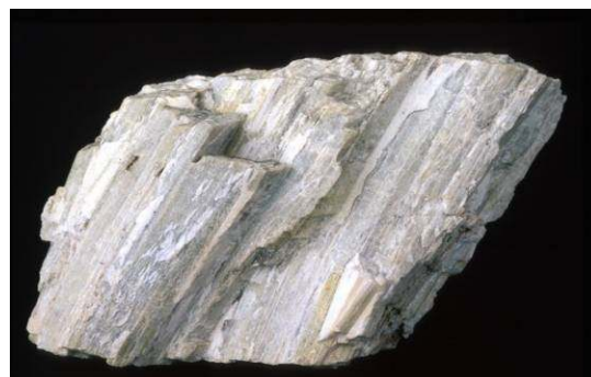
Zoisit, mineral, ki kristalizira rombično.

Na Svinški planini so leta 1804 prvič našli nov mineral, ki so ga poimenovali ZOISIT, po našem znanem baronu Žigi Zoisu, (1747 -1819) saj je bil med drugim tudi eden izmed vodilnih mednarodnih strokovnjakov mineralogije. Zapustil je okoli 5000 primerkov obsegajoče mednarodno znane mineraloške zbirke.