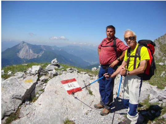
Še smo na pravi poti.

Mimo opuščene kasarne in skoz macesnov gozd smo se vzpenjali proti sedlu Farco di Lanza in pod grebenom prečili. Ves čas smo uživali v razgledih globin pod nami in v daljavi občudovali ozko silhueto zahodnih Julijskih Alp. Proti severu nismo imeli razgleda, ker je steza speljana po pobočju. Obšli smo kar nekaj robov, da smo prišli na sedlo, kjer se odpre pogled tudi na severno obzorje in globoko pod nami na planino. Od tu se še vidi vsa razsežnost in lepota planine.