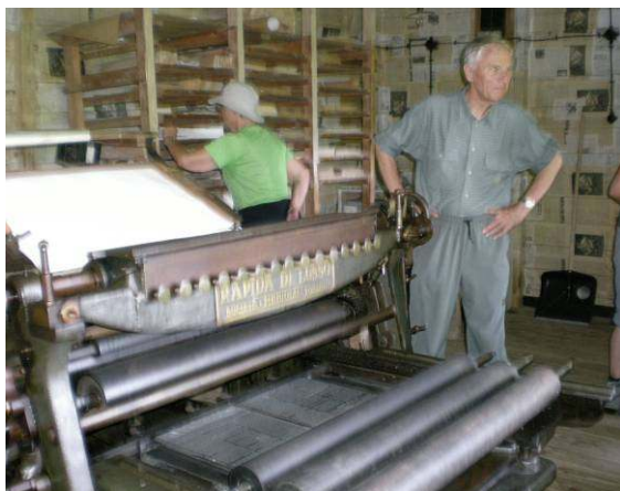
Tiskarski stroj, pripeljan, še vedno deluje.

Povratek nadaljujemo proti Vojskem. Tam se vkrcamo v avtomobila in se po makadamski cesti spustimo v dolino Trebušnice. Ogleđamo si še slap Pršjak in se preko Spodnje Idrije vrnemo v Ljubljano.