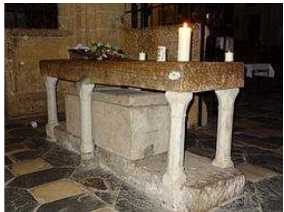
Modestov grob pri Gospe Sveti.