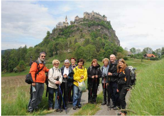
Udeleženci izleta pred našim ciljem.

dokument, ki omenja Ostrovico, je listina iz leta 860, v 11. stoletju pa je na vzpetini že stala utrdba.