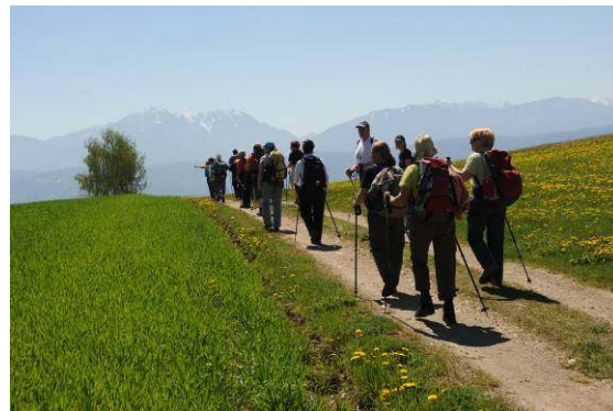
Slikovita pot proti Štalenski gori.

Pri Mariji Sveti smo zavili na božjo pot proti Štalenski gori. Koračili smo mimo velikih zoranih polj, ki so s svojo rjavo barvo samo še poudarjala modrino neba, mimo živozelenih površin jarega žita, zavili v smrekov gozd, po poti, ki jo je na levi strani spremljala močvara. Žab nisem slišala – verjetno so se zaradi toplega vremena letos že vse poženile (ali pa jih zaradi kakršnihkoli kemikalij sploh ni več?). Pot je bila tako položna, da nismo niti opazili, da se vzpenjamo. Počasno, neopazno vzpenjanje se je nadaljevalo po lahno valoviti Roški dolini, polni cvetočih grmov in dreves – predvsem jablan. Od časa do časa so na nas pokukale Karavanke – Peca, Obir, nato Košuta s svojimi sosedi.