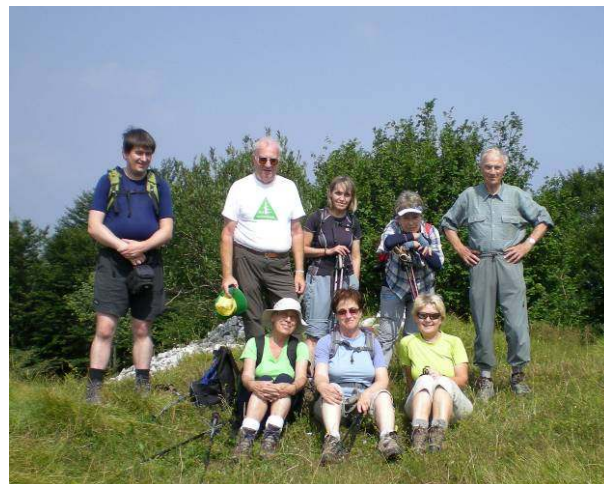
Osvojeni vrh Hudournika ki meri 1148 m.

Mi pa smo nadaljevali pot po cesti proti vrhu Hudournik, 1148 m, ki sicer ni izrazit vrh. Na robu prepadne stene je drog z vgrajenim žigom in s seboj moraš imeti blazinico za žigosanje dnevnika. Razgled pa je res lep. V bližnji okolici so Šebreljski vrhovi, na obzorju pa se vidijo vrhovi nad Baško grapo s postavnim Poreznom.