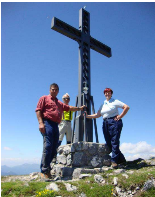
Na vrhu Monte Zermule 2143m.

Z vztrajnim korakom smo dosegli vrh z mogočnim železnim križem. Na vrhu se nas je zbrala narodnostno pisana družina in še kakšno prijetno presenečenje: tuji planinec nas je vse počastil z izvrstnim pecivom.