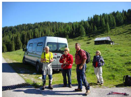
Tam gori je naš cilj.

Gora je mogočna skalna vzpetina, ki je bila v prvi svetovni vojni zelo pomembna strateška točka. Od takrat je vojaško zaznamovana še z vidnimi ostanki kavern, bunkerjev, jarkov, mulatjero pa še danes uporabljamo za lažji pristop na vrh.