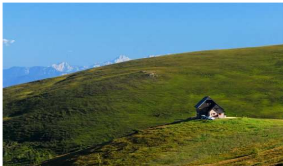
Goli greben Svinške planine.

na popolni čistini lahko že občudovali planinsko kočo (Wolfsberger Hutte ), ki je bila naš končni cilj. Pogumno smo pričeli našo pešpot, kljub temu da na nebu ni bilo nobenega oblčka, med potjo pa nobenega drevesca, ki bi nudilo vsaj malo sence.