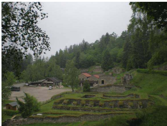
Ostanki keltskega naselja Noreja.

Predvideva se, da je naselje nastalo v času keltske kraljevine Norik in je obstajalo od okoli 2. stoletja pred našim štetjem do mirne vojaške zasedbe Rimljanov okoli leta 15 pred našim štetjem. V času cesarja Klavdija, ki je Norik uredil kot rimsko provinco, so se prebivalci Štalenske gore okoli leta 45 našega štetja preselili v Virun.