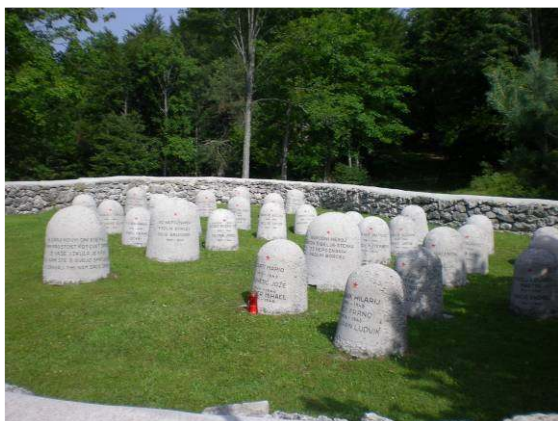
Partizansko pokopališče na Vojščici.

Po polurni hoji smo prišli do partizanskega pokopališča na Vojščici, kjer je pokopanih 305 borcev NOB, padlih v zadnji nemški ofenzivi aprila 1945. Pokopališče je lepo urejeno, na kamnih so izpisana imena borcev, predvsem tistih, ki so bili poznani, med njimi tudi dva narodna heroja.