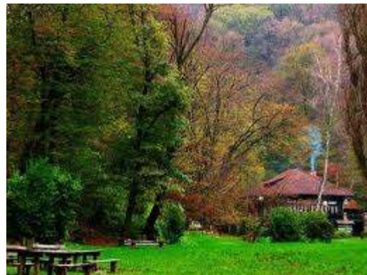
Utrinek s Fruške gore.

Naše člane in druge zainteresirane planince še posebej opozarjamo in vabimo na izlet na Fruško goro v Vojvodini , ki ga naše planinsko društvo sicer ni planiralo v letnem planu izletov, vendar smo se zanj odločili naknadno zaradi popestritve naših izletov.