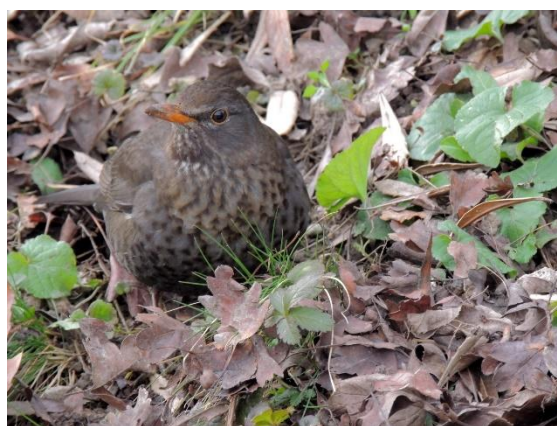
Kaj me gledaš tako zvedavo? Kosova samica, Špica