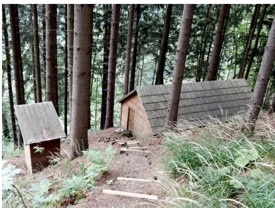
V pol dneva smo našli bolnišnico, ki je sovražnik ni našel v letu vojne.