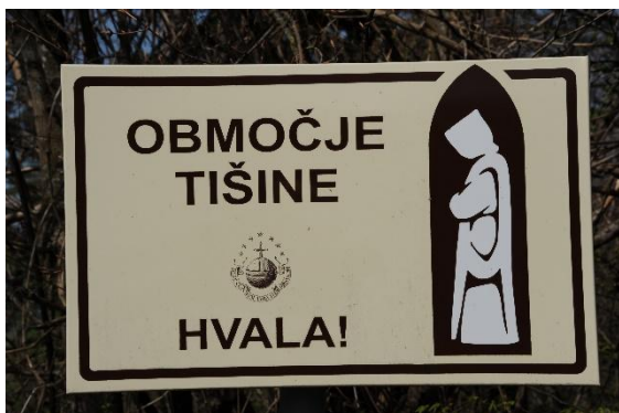
Tabla stoji več kot pol ure hoda od samostana Pleterje. Menihi kartuzijanci živijo v strogi tišini.

Nič več se nismo ustavljali, le popili smo še zadnje kaplje vode in že smo se znašli v bližini samostana, ki so ga menihi označili za »Območje tišine«. Res smo sprva obmolknili, a kmalu na to pozabili. Razmišljanja v tišini navadni smrtniki ne zmoremo (več).