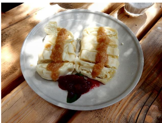
Človek si mora tudi kaj dobrega privoščiti!!