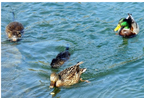
Mi štirje smo najlepši par - nutriji in par rac mlakaric. Špica.

Vsekakor velja omeniti še trgovinico Biotehniškega izobraževalnega centra (BIC), ki se nahaja ob konservatoriju. Lahko bi rekli na pol poti od Špice do Botaničnega vrta. V KRUHariji in CUKRniji prijazna dekleta in fantje postrežejo z dobrotami, ki jih ustvarjajo učenci BIC-a ob podpori učiteljev. Kaj dobite v trgovinici, je že ime samo dovolj povedno.