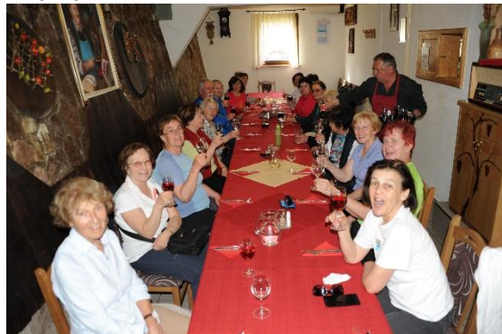
V vinotoču pri Drči so nas postregli z odličnimi postrvmi in odojkom, zraven pa sta se prilegla še domač cviček in modra frankinja.

Že pošteno utrujeni smo se odpeljani na Drčo k domačinu z vinotočem. Ponudil nam je odličen cviček in frankinjo, nas okrepčal s sočnim odojkom in hrustljivo zapečenimi postrvmi. Nato pa pot do Ljubljane skozi Novo mesto, od tu naprej pa samo še »koma«.