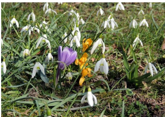
Igra barv, Botanični vrt