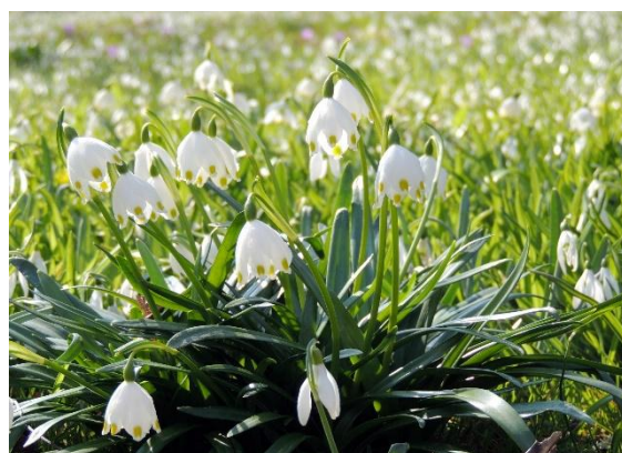
Moj poklon, Botanični vrt