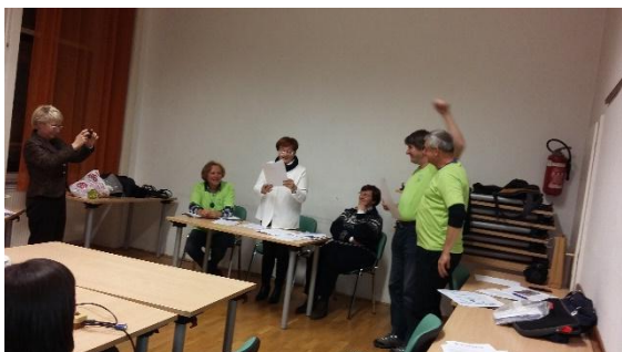
Veselje ob prejemu zlatega častnega znaka

Predsednik društva je v nadaljevanju podelil spominske plakete ob življenjskem jubileju, in sicer: