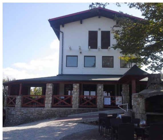
V pritličju je na novo preurejena grajska terasa.

z okolico, je pod novim najemnikom dostopen vsem obiskovalcem brez omejitev.