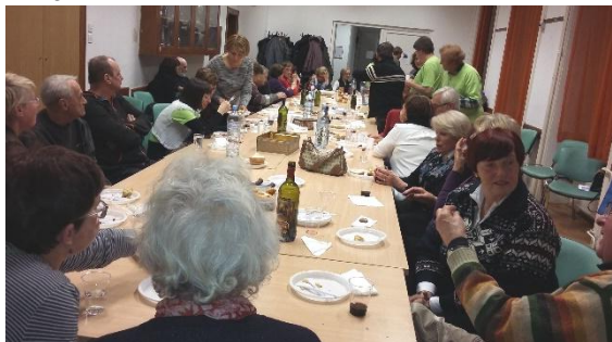
Mize se počasi praznijo.

Po koncu občnega zbora je sledilo tradicionalno druženje. Pohvala in zahvala vsem, ki so pripomogli k bogato obloženim mizam.