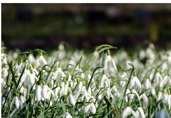
Uh, koliko nas je! Botanični vrt