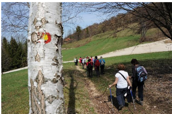
Čez Javorovico vodi tudi Evropska pešpot E 7.

Z vrha hriba smo se spustili na pot mimo lovskih prež in se kmalu spojili z že prehojeno. A zdelo se mi je, kot da hodimo drugje, saj čudovitega brezovega gozda prej sploh nisem opazila. »Le zakaj Javorovica, morala bi biti Brezovica,« je bistro pripomnila Alenka.