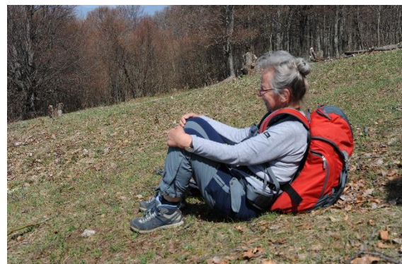
Tudi Alenki je dobro del počitek na sončnih travnikih Pirčevega hriba.