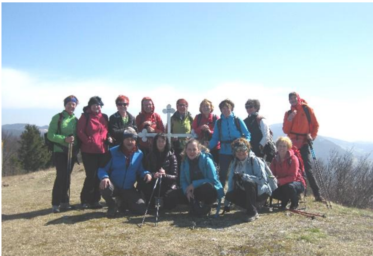
Gasilska z vrha Kovka