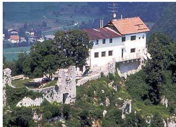
Stari grad z ostanki ruševin in novejšim objektom

Pa še nekaj stavkov o zgodovinskih dejstvih gradu. Leta 1202 se v Kamniku omenjata dva gradova, in sicer Spodnji grad, danes poznan kot Mali grad, in Zgornji grad, danes kot ruševine Starega gradu. Slednji je bil postavljen visoko nad mestom in dobro utrjen z obrambnim zidom. Izredna lega je omogočala dobro obrambo in nadzorovanje prometne poti, ki je vodila s Štajerske skozi Tuhinjsko dolino mimo Kamnika na Gorenjsko in Primorsko. Leta 1511 ga je močno poškodoval potres, kasneje pa ga je prizadel še požar. V 16. stoletju je bil tako grad opuščen in takrat se je pričelo njegovo propadanje.