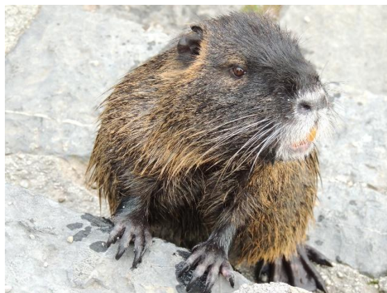
Nutrija se na ogled postavi. Špica