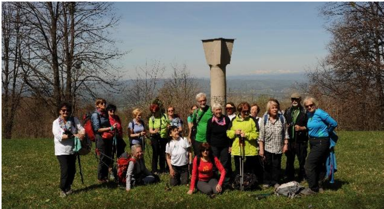
Na Javorovici je spomenik 146 borcem četrtega bataljona Cankarjeve brigade, ki so marca 1944 padli na Javorovici.

Dobro smo se spočili in se nato preko gorjanskih košenic strmo povzpeli na tristo metrov višji Pirčev hrib. Razgleda sicer nismo imeli, smo pa spotoma občudovali zgodnje pomladno cvetje, šope trobentic, vijolic, podlesnih vetrnic. Pobočje hriba je bilo polno posekanega grmovja, menda zaradi evropskih donacij. Kar je sicer dobro za kontrolo, da posest res služi subvencioniranemu namenu, je pa sprto s potrebo pašnih živali po senci v opoldanski poletni pripeki.