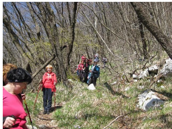
Povratak v dolino

Nadaljevali smo pot po razglednem grebenu vse do Podrte gore (827 m), saj smo se vračali po drugi, nekoliko daljši in še lepši poti. S Podrte gore se je v ledeni dobi od masiva odlomil večji kos stene in kamenje se je zakotalilo v dolino. Še danes so na širnem balvanskem polju vidne skale, nekatere tudi v velikosti hiše. Sivino skalovlja pa z zelenjem poživlja posebna vrsta plazečih cipres.