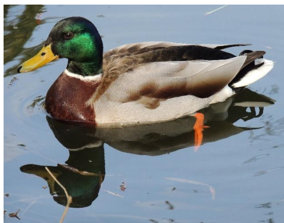
Lepo pozdravljeni v Botaničnem vrtu. Samec race mlakarice