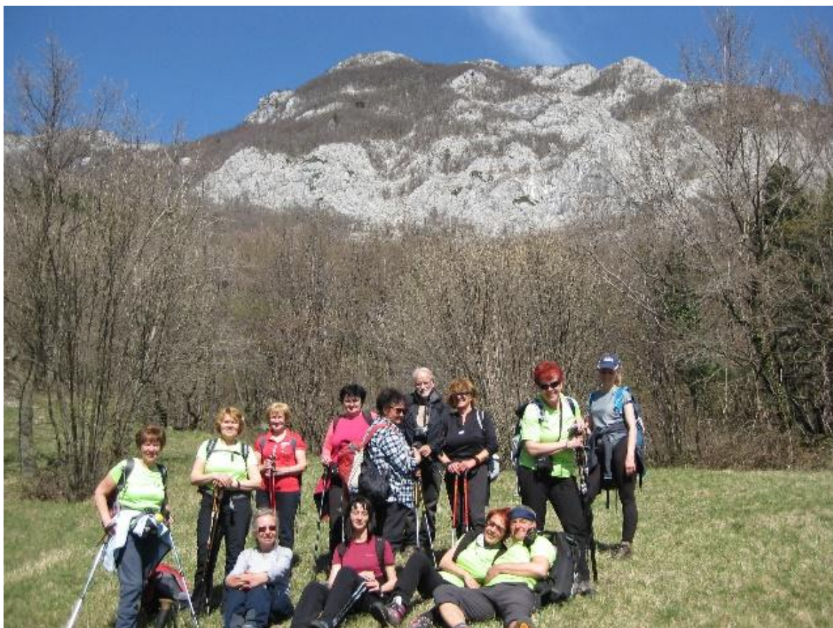
Skupinska pod Podrto goro

Turo smo zaključili ob domačih dobrotah gostišča na Colu. Polni prijetnih vtisov in dobrovoljni smo si "viharniški planinci" zaželeli: