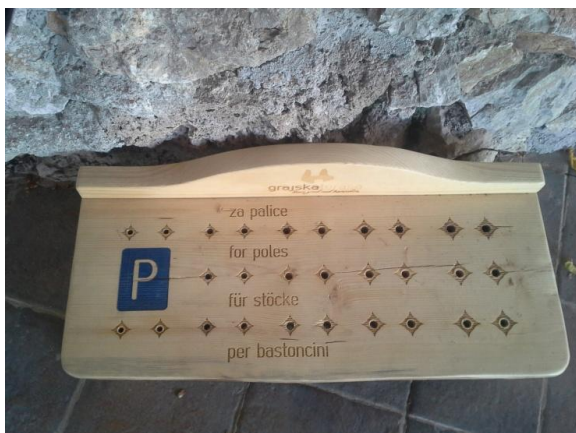
Parkirno mesto za pohodne palice

pohodniške palice. Ali naj jih odložimo pred vhodom, ali pa naj jih vzamemo s seboj in nato iščemo primeren kraj, kjer jih lahko odložimo, pod klopjo, na obešalnik?