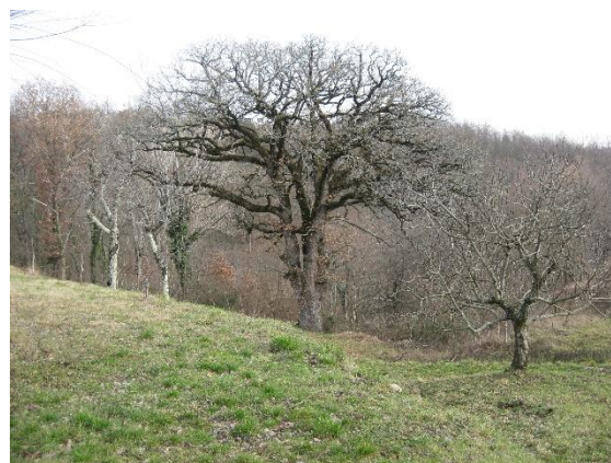
Znameniti hrast cer

Graciani je prava legenda Abitantov. Pokazal nam je znameniti petsto let star hrast cer, ki raste nedaleč stran na začetku vasi. Ustavili smo se tudi pri znamenitem abitantskem vodnjaku - fontani. V vasi je bilo 25 fontan, vendar je v bila v času velikih suš voda samo v tej fontani in vsak dan jo je vaščanom delil Giacomo Perič, prednik Graciana Periča. Giacomo je bil zaslužen mož, veliko je naredil za vas, zato je ob spomeniku tudi spominska plošča njemu v čast. Prvi prebivalec Abitantov se je pisal Perič in je v začetku 16. stoletja prišel živeti v te kraje.