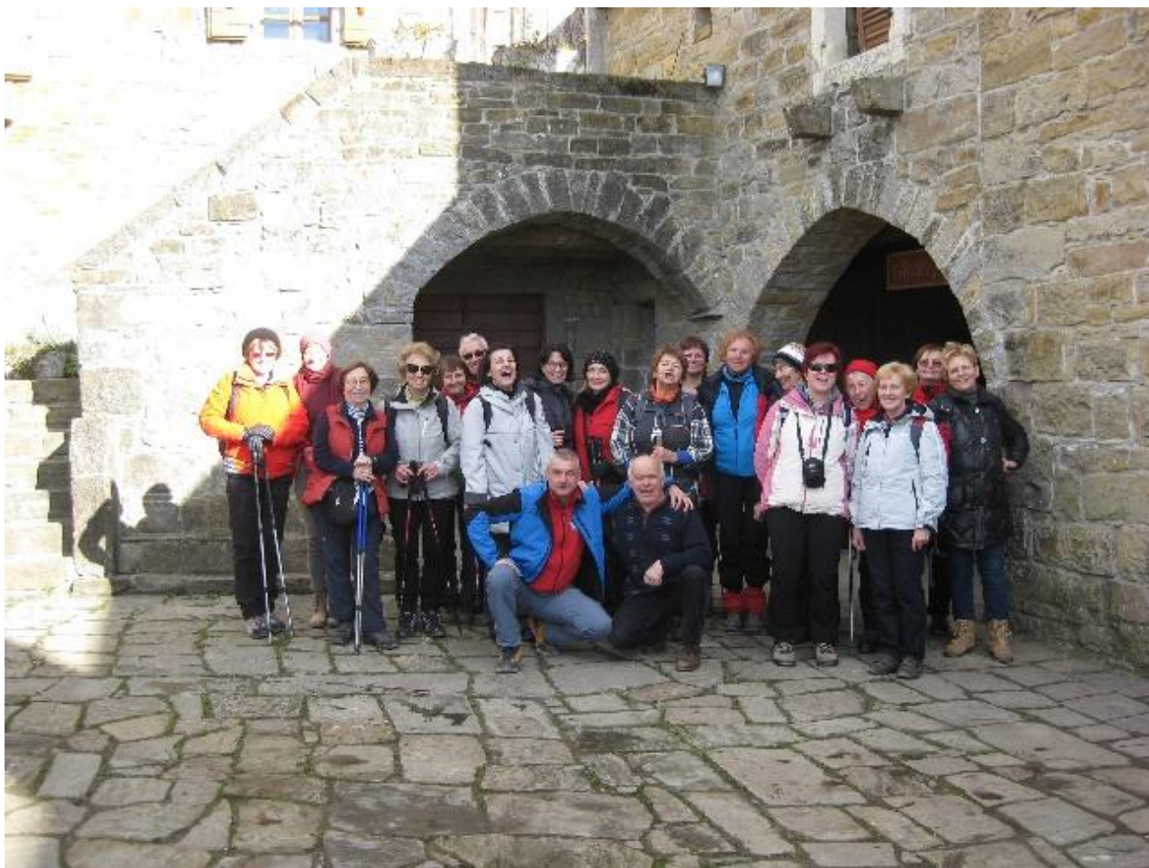
Pred domačijo Grondali

Leta 1987 je bila cela vas Abitanti razglašena za kulturni spomenik lokalnega pomena. V vasi je ohranjena istrska arhitektura - kamen in suha zidava. Ljudje so z lastnimi rokami brez veznega materiala gradili hiše, ki so dolga leta same kljubovale zobu časa. Na Gracianovi domačiji Grondali smo si privoščili domačo malico z njihovim cenjenim refoškom. Slasten pršut, sir in istrski kruh je kmalu izginil z naših miz.