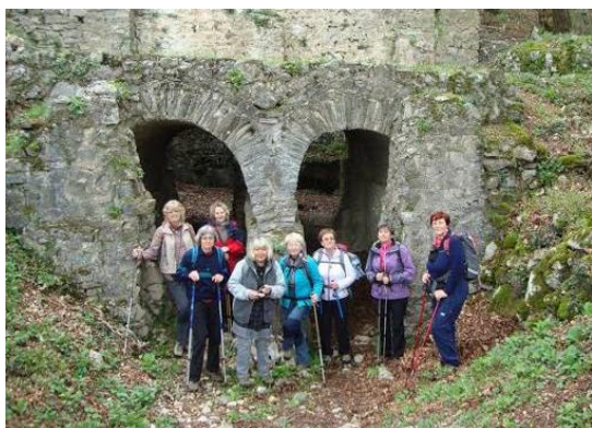
Vodni stolp iz rimskih časov

Kasneje so na njem Rimljani zgradili vojaško postojanko, ki je bila v bližini rimske ceste, ki je vodila od Ogleja do Emone. Po tej poti smo hodili tudi mi in prišli do še ohranjenega obzidja in vodnega stolpa iz 5. stoletja. Vodni stolp meri v višino 11 m in je najvišja ohranjena tehnična rimska zgradba na Slovenskem. Arheološke raziskave še niso končane, nova odkritja bodo prav gotovo razkrila nove značilnosti življenja rimske utrdbe.