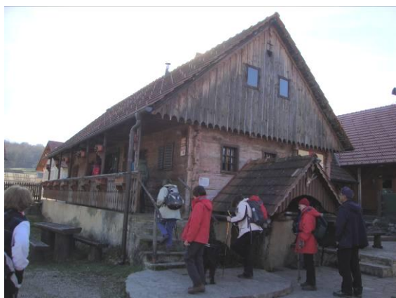
Globočice, turistična kmetija »Pr Martinovih«

maščobe. Meso krškopoljskega prašiča je zelo cenjeno tudi v visoki kuhinji. Za časa cesarja Franca Jožefa so reje krškopoljskih prašičev prepovedali, ker so imeli premalo mastnih tkiv. Tako se vrednote, tudi mesne, skozi desetletja in stoletja spreminjajo. Seveda pa brez dobrega cvička ni šlo. Martinovi so pred leti dobili priznanje »kralj cvička« za najboljši cviček.