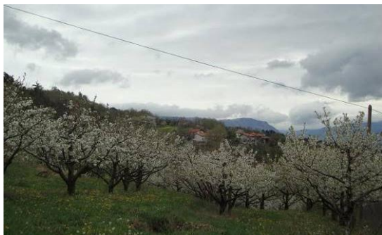
Češnjev nasad v cvetju

Hodimo mimo bujno cvetočih nasadov češenj do Školja sv. Pavla nad Vrtovinom, ki je bil naseljen že v železni dobi.