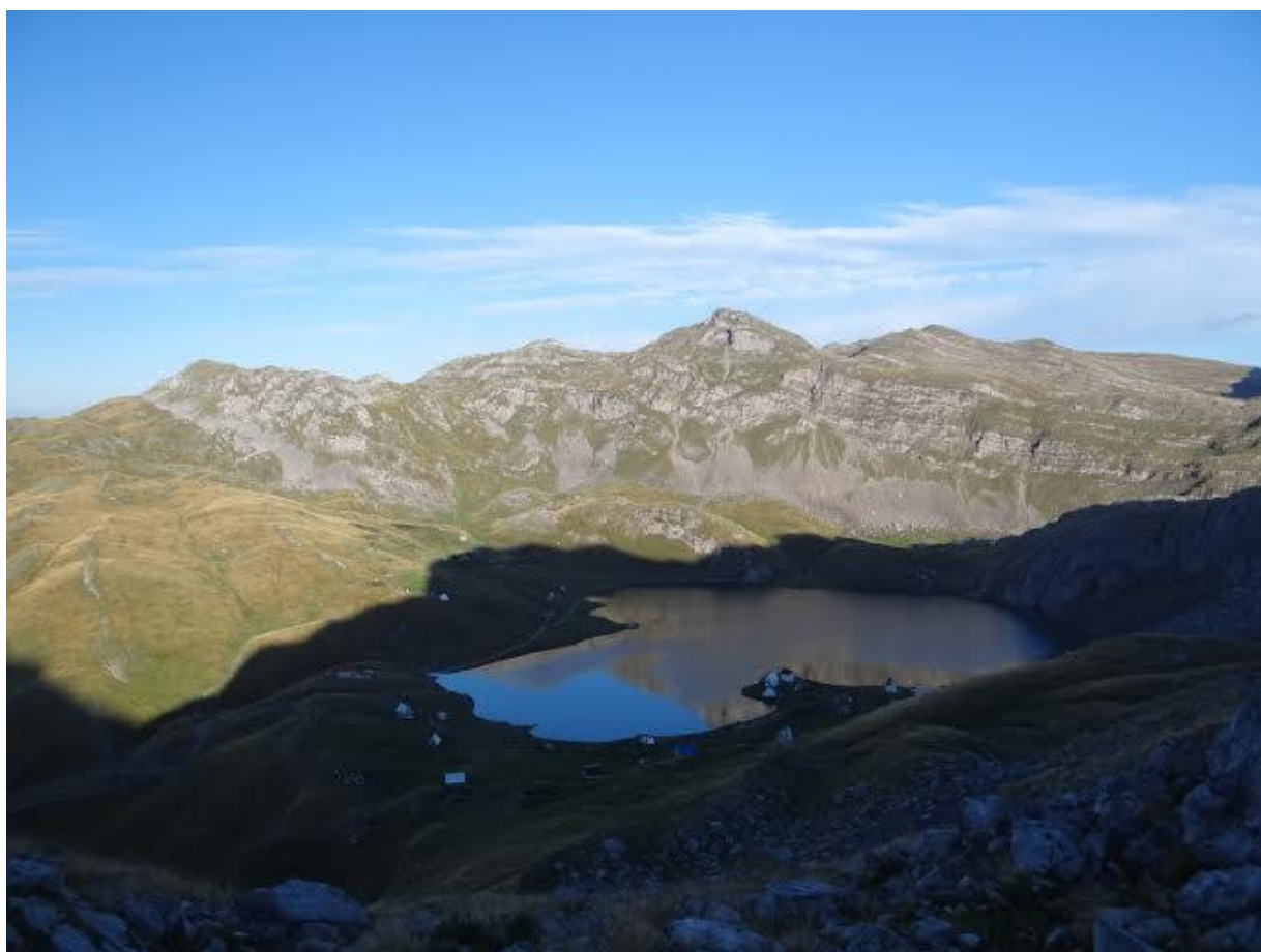
Jutro pri Kapetanovem jezeru, Črna gora

Letnik XLI – april 2016, št. 2 ISSN 1318-9484