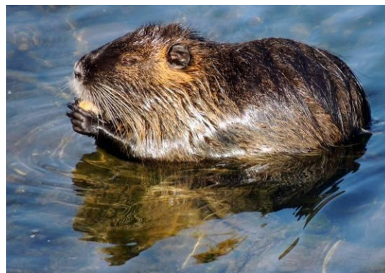
Uh, kako mi paše!

Mnogi ji pravijo tudi močvirski bober. V naše kraje je prišla iz njene domovine Južne Amerike. Živi v zmernem pasu od Čila do Paragvaja in Patagonije. V dolžino meri od 45 cm do 50 cm, značilen dolgi rep meri 40 do 44 cm. Prekriva jo gost, mehak in dolgdlak kožuh, ki je ob straneh živahno rdeč, spodaj pa sivo do črno rjav. Trup je precej potlačen, s kratkim in debelim vratom. Glava je dolga in sploščena, ki se konča s topim gobcem. Nos in ustne votline so svetlo sive. Oči so srednje velike in precej izgubljene, ušesa pa so zelo majhna. Njene noge so kratke in zelo močne, zaključijo se s petimi prsti in močnimi ostrimi kremplji. Med prsti zadnjih nog ima plavalno mrežo. Rep je vretenast, kockasto luskast ter porasel z redkimi ščetinami.