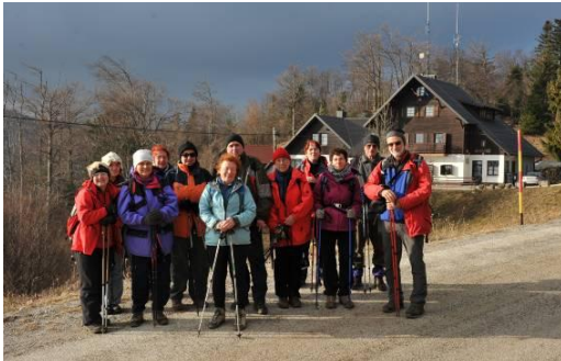
Pred kočo na Bohorju, pred spustom v dolino

kočo, se okrepčali s toplo hrano na žlico, veselo kramljali, nekateri pa celo spremljali smučarsko tekmo Zlata lisica in se prešerno veselili krasnega uspeha naše veleslalomistke.