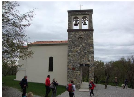
Na Školju - cerkev sv. Pavla

Povzpne se še na vrh Školja, kjer je lepo obnovljena cerkev Sv. Pavla, ki stoji na temeljih stare cerkve iz 16. stoletja. Po koncu druge svetovne vojne so jo domačini sezidali v nekaj tednih v spomin in zahvalo, da so hudi časi vojne mimo. Vanjo so vzdane plošče z imeni vaščanov, umrlih med II. svetovno vojno.