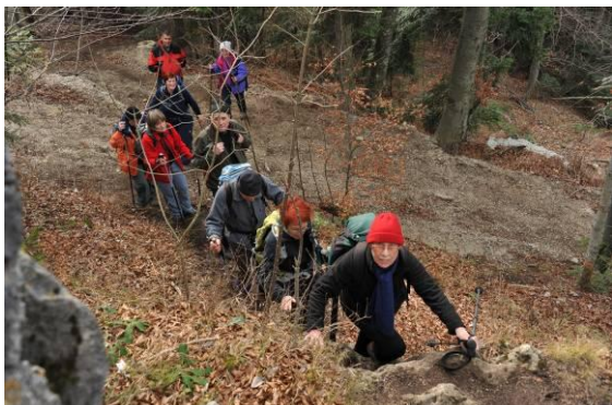
Pričetek strmega vzpona iz grape

Po ogledu te naravne lepote smo se iz grape strmo vzpenjali po visokih strmih stopnicah in se istočasno oprijemali jeklenice, ki je bila pri tem vzponu nujno potrebna za varen korak.