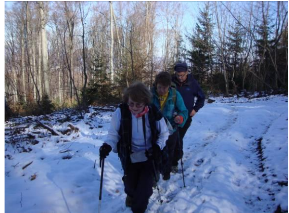
Proti vrhu Cirnika nas pričaka snežna odeja.

Pot smo nadaljevali po gozdni poti, veter je bil tudi v gozdu močan, tu pa tam so bile snežne zaplate.