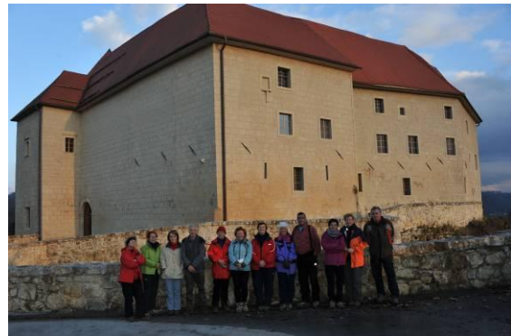
Pred kratkim prenovljeni grad Rajhenburg

takrat del njihovega stanovanja. Leta 1947 so jih iz gradu preselili drugam.