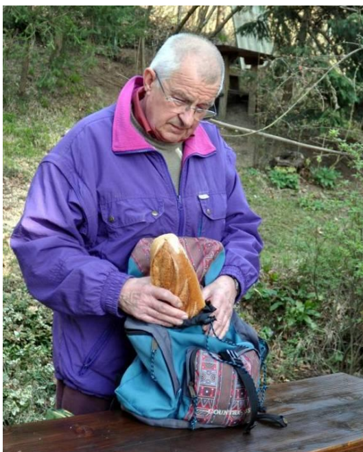
V nahrbtniku je bilo še dovolj prostora za darilo.

Po kakšni uri hoje smo prišli na vrh do cerkvice Svetega Miklavža, se malo oddahnili in se kar hitro spustili do kmetije odprtih vrat. Domači gospodinja smo povedali zgodnico o podarjenem kruhu, ki sem ga iz nahrbtnika položil na mizo in jo prosil, naj ga nareže. Drugi pohodniki so iz nahrbtnikov izvlekli še svoje malice. Gospodinja je štruco odnesla v kuhinjo in se vrnila s košarico z narezanim kruhom, zraven pa je prinesla še krožnik s klobaso in ocvirki kot njeno darilo h kruhu. Zelo nam je teknilo.