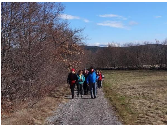
...in mu tudi z veseljem sledimo.