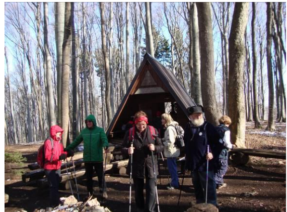
Na vrhu Cirnika 630m» ZAVETIŠČE VESELA MICKA«

Občudovali smo čudovit borov gozd in modro sinje nebo. Na vrhu Velikega Cirnika, ki je visok 630 metrov, smo tretjič žigosali naš dnevnik. V svoje zavetje nas je sprejel bivač »Pri veseli Micki«.