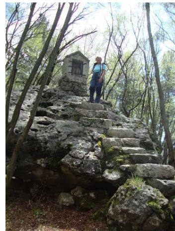
Balvan s kapelico sv. Lucije, zavetnice slepih in slabovidnih

Pozornost nam pritegne velika skala s tolmunčki, v katerih je voda, ki menda nikoli ne izhlapi, tudi v največji vročini ne. Na vrhu skale je majhna votlina, v katero so domačini položili kipec sv. Lucije, zavetnice slepih, in skalo poimenovali po njej.