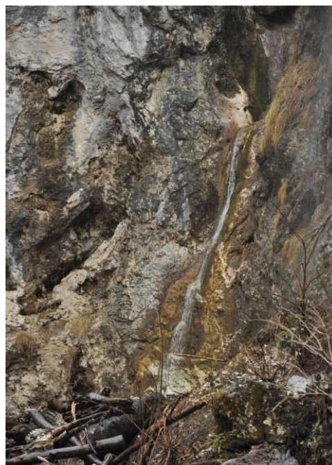
Izjemen slap Ubijavnik

Pot nas je naprej vodila po hudourniški poti potoka, ga večkrat prečkali in pazili smo, da nam ne spodrsne na mokrem kamenju. Naš trud je bil poplačam, ko smo po približno pol uriče hoje prišli do lepega slapu Ubijavnik. Že samo ime govori o poti in o slapu samem. Lahko bi rekla, da potok teče po neokrnjeni divjini.