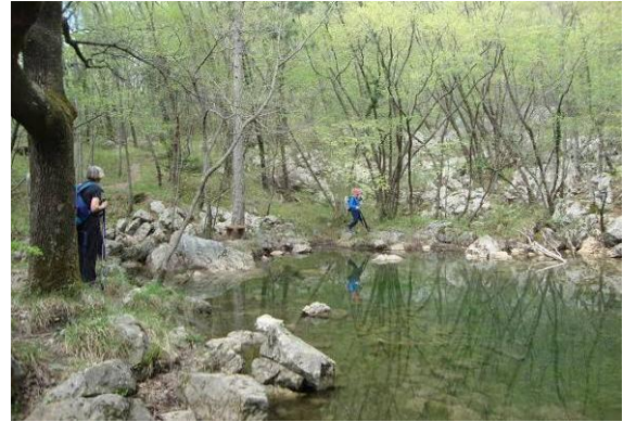
Vitoveljsko jezero za bresti

Na naše začudenje pa v tej malo večji mlaki nismo našli žab, temveč ribice. Komaj opazen pritok čiste vode izpod Trnovskega gozda se zbira v tem plitvem jezercu, ki omogoča življenje ribic v njej. Na nekdanji podor planote pričajo ogromne skalne gmote, mimo katerih vodi steza.