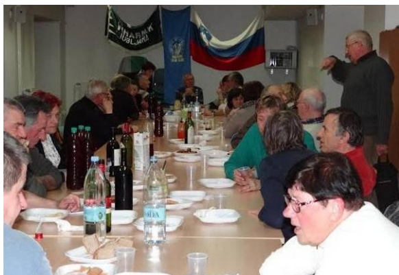
Pogostitev in druženje po zaključku OZ