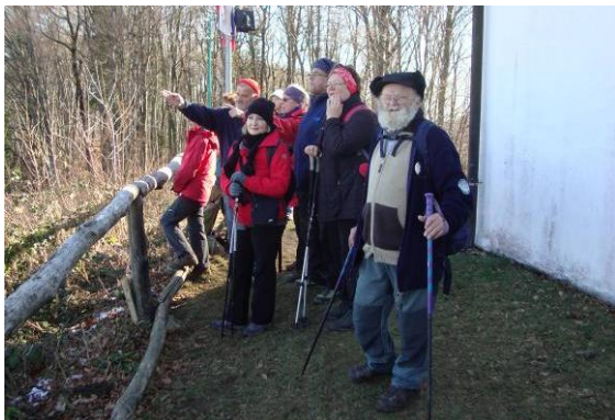
Pri cerkvi sv. Vida

Pot nas je vodila najprej na bližji Šentvid in zelo kmalu smo se vzpeli do cerkvice sv. Vida. Bil je lep sončen dan, veter je močno pihal. Razgled po Brežiški ravnini je bil jasen, od jedrske elektrarne Krško do gradbišča nove hidroelektrarne ter vse do Brežic in turističnega naselja Čatež.