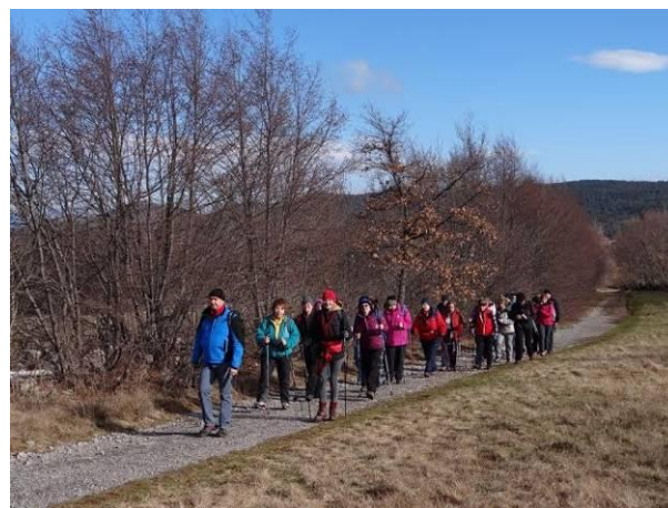
Na Kokoš nas je šlo kar 23!

Tako je udeležba na društvenem izletu kar priljubljena rešitev. Za prevoz je poskrbljeno. Srečaš znane obraze in spoznaš nove. V skupini preskakujejo iskricice humorja. Tovarištva. Nekaj nas povezuje. Imamo skupni cilj. Dobiš žulj - ni problema. Najmanj troje rok ti ponuja obliže. Počutiš se varnega.