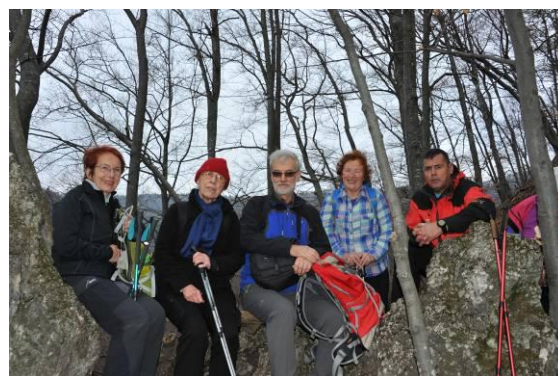
Kratek oddih po napornem vzponu

V bukovem gozdu smo opazili prve znanilke pomladi, lepo rumeno rožico jarico, ki je značilna za ta okoliš, drugje menda ni razširjena. Jarico sedaj lahko brez posegov v naravo posadimo tudi v domačih vrtovih, saj jo nekateri vrtnarji že imajo v svoji ponudbi trajnic