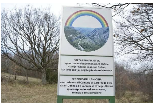
Na krožni poti prijateljstva

Ko zapustimo hiše, se nam pogled pne v strma pobočja, ki padajo v kanjonsko dolino Botač. Zapira jo 36 m visok slap Supet, a vodna kotanja se nato nadaljuje v skromno strugo z malo vode. Menda je je bilo pred gradnjo avtoceste obilo, miniranja pa so povzročila, da je gladina občutno upadla in reka je postala onesnažena. O burni zemeljski zgodovini te pokrajine priča tudi nenavadna sestavina kamenin. Desna