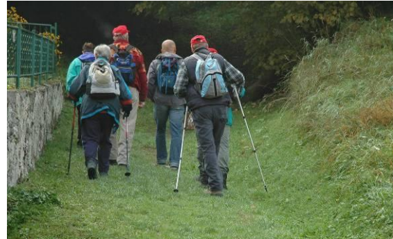
Zadišalo je po kruhu

Prečkali smo naselje in nadaljevali po pešpoti med redkimi kmečkimi hišami. Rahel veter je prinesel meni znan vonj, zadišalo je po kruhu.