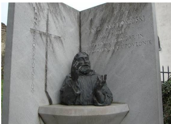
Pridigar Janez Svetokriški v Vipavskem Križu

Danes so v samostanu samo še trije patri. Naselje ima 60 hišnih števil; približno 180 prebivalcev; osnovno šolo do 4. razreda in 2 cerkvi. Ogledali smo si Kapucinsko cerkev, v kateri je naša vodnica lepo zapela pesem Santa Marija. Naselje se počasi obnavlja. Obnovo infrastrukture in tlakovanje ulic znotraj obzidja so omogočila evropska sredstva. Tako kot prijazen domačin, smo tudi mi pogrešali kakšen gostinski lokalček, ki bi nam podaljšal čas bivanja tam. Žejo smo si tako pogasili v nekdanjem "prvem disku v Sloveniji" in se nato veselili, polni lepih vtisov, vračali proti domu, v rdečem gasilskem kombiju, ki je pritegnil kar nekaj pozornosti domačinov, saj je gasilec šofer vozil 8 postavnih gasilk.