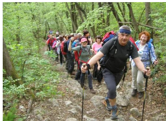
Skozi gozd sopihamo proti cilju.

Sama pot na Korado ni preveč razgledna, se pa lepo vzpenja, včasih strmeje, včasih položno... tako razgibano. Malo stečem naprej in slikam skupino navzdol, pa se potem spet zaklepetam na repu... in tako se zgodi, da kar nekaj zastanemo.