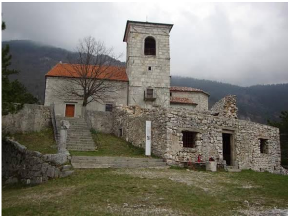
Romarska cerkev sv. Marije iz 14. stoletja

Notranjosti cerkve si nismo mogli ogledati, ker je bila zaprta. Cerkev je gotska; notranjost baročna; oltar iz druge polovice 18. stoletja; na oltarju se hrani lesena gotska plastika Marije z otrokom iz 15. stoletja; grb iz 17. stoletja pa stoji nad glavnim portalom.