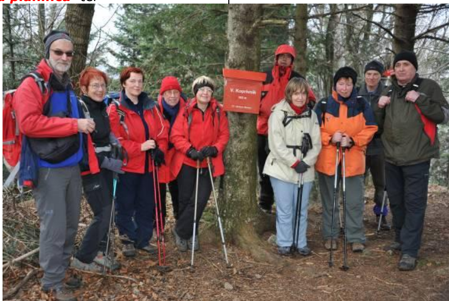
Osvojeni vrh Velikega Koprivnika, ki pa ni razgleden.

Jaz sem klopca »Kačja slinca«, narejena za planinca ter