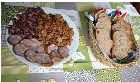
Uh, kako nam je teknilo

Po kakšni uri hoje smo prišli na vrh do cerkvice Svetega Miklavža, se malo oddahnili in se kar hitro spustili do kmetije odprtih vrat. Domači gospodinja smo povedali zgodnico o podarjenem kruhu, ki sem ga iz nahrbtnika položil na mizo in jo prosil, naj ga nareže. Drugi pohodniki so iz nahrbtnikov izvlekli še svoje malice. Gospodinja je štruco odnesla v kuhinjo in se vrnila s košarico z narezanim kruhom, zraven pa je prinesla še krožnik s klobaso in ocvirki kot njeno darilo h kruhu. Zelo nam je teknilo.