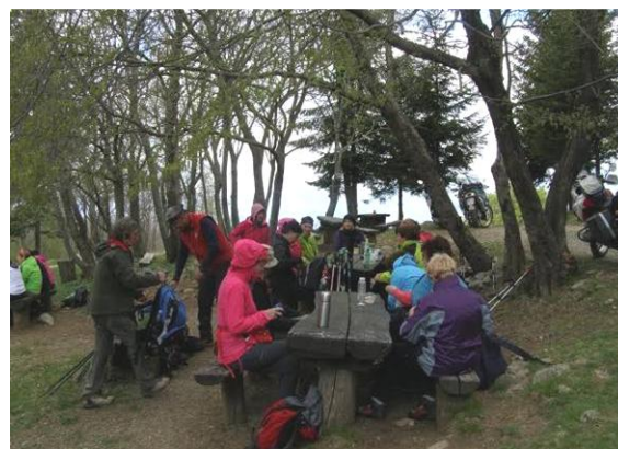
Zaslужen počitek in uživanje kraških dobrot na vrhu Korade