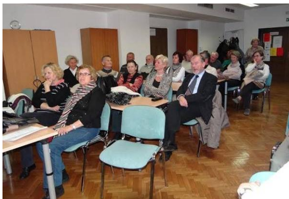
Viharniki na zboru

S tem smo občni zbor zaključili, sledilo pa je še tradicionalno druženje po občnem zboru.