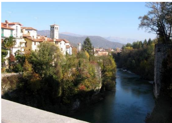
Nadiža, modra kot safir (fotografija s Hudičevega mostu v Čedadu)

Avtorica poezije in fotografij: Alenka Dobeč