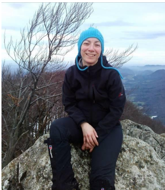
Počitek na Donački gori

Staršem sem se rodila kot četrti otrok in kot težko pričakovana hči ;) Odraščala sem s tremi starejšimi brati na Bizeljskem in dejansko do pubertete živela bolj fantovsko življenje. Po končani osnovni šoli sem odšla v Ljubljano v srednjo farmacevtsko šolo ter živela v internatu. Po srednji šoli sem se vrnila za leto dni domov, nato sem se pa zaradi službe preselila v Ljubljano. Delam še vedno v Ljubljani, živim pa v Stični, kjer imam čudovit hribček Gradišče za vsakodnevno »luftanje«.