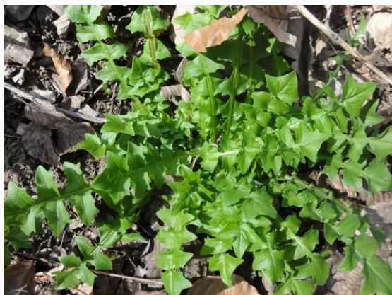
Smrdljivka ali gozdni regrat, ki je okusen in ima duh po krompirju.