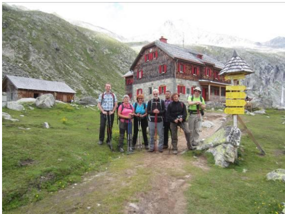
Da smo vsi na sliki, je bil prijazen avstrijski fotograf ob poslavljanju od koč.

Pojedli smo vse energetske ploščice, čokolade in sendviče, popili čaje in limonade in naredili na desetine fotografij. Pot navzdol je bila lažja in tudi mi smo bili lažji in srečni. Še juhica v koči in pot navzdol do avta.