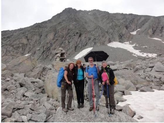
Na pol poti smo se zaradi dežja obrnili in vrnili v kočo, v ozadju Sauleck.

Po dveh urah hoje, ko smo bili nekje na pol poti, kjer so velike granitne plošče in posebne naravne skulpture, ki spominjajo na kipe ljudi, je pričelo deževati, zato smo se odločili za vrnitev v toplo in prijazno kočo DOSNER HUTTE.