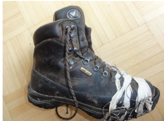
Moj nesrečni čevlj znamke MILLET.

Tik pred vrhom je moj čevlj »zaaaaziiiijaaaal«, podplat se je odlepil do prstov in komaj sem pristopicala na vrh, kjer so že od sreče vriskali planinci. Meni je šlo na jok, kaj sedaj? Šesturni sestop po ostrem kamenju in ploščah, s tankim podplatom, skoraj kot v nogavici, ne bi bil prijeten.