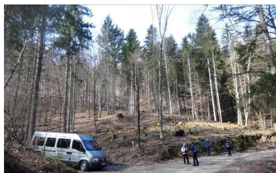
Pričetek naše poti na Goško ravan

Ker je ves teden deževalo, nas je prišla v soboto zjutraj k Borisovemu malemu avtobusu le šesterica, kljub temu se je vodnik odločil, da nas bo popeljal proti Kropi in Lipniški dolini, od tam pa do planote Talež in do Goške ravni. Že pri »Hostar – baru«, kjer smo se ustavili zaradi jutranje kavice, smo bili poplačani za svojo odločitev.