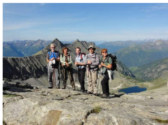
Na poti navzgor je bil sonček, razgled na Visoke Ture in samo 5 nas je naskočilo vrh.

Neki avstrijski planinec je vzela iz nahrbtnika svilen »hanzaplast« in mi na debelo povil čevlj, tako da je pritrnil podplat. Oddahnila sem si in veselo smo se objeli, slikali in žigosali vse mogoče knjižice. Pogled in razgled iz vrha Saulecka je bil fantastičen.