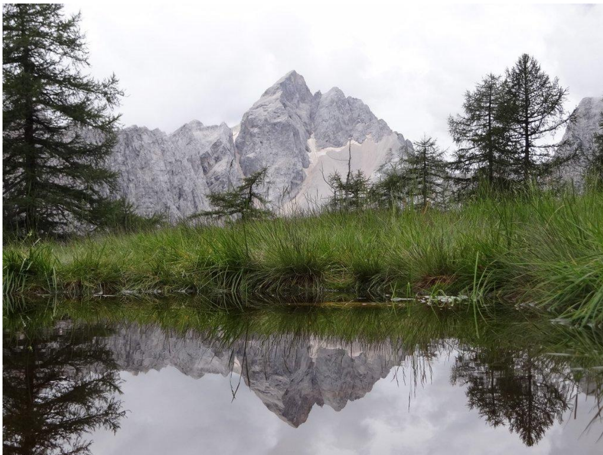
Jalovec s sedelca pod Slemenovo špico