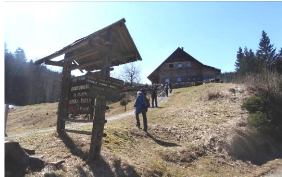
Tik pred našim ciljem – koča na Goški ravni

Sledila je pot do Goške ravni. Ob planinskem domu sem prebrala, da je Jelovica vključena v Naturo 2000, ker v njenih gozdovih domuje veliko ptic in parkljarjev. Žal smo mi srečali le dve beli gosi, za ogrado pa čudnega kozla in njegovo ženo kozo. Žal prav nobena izmed videlih živali in ptic ni bila avtohtona. Tudi krave, ki se bodo poleteli pasle na Goški ravni, ne bodo avtohtone.