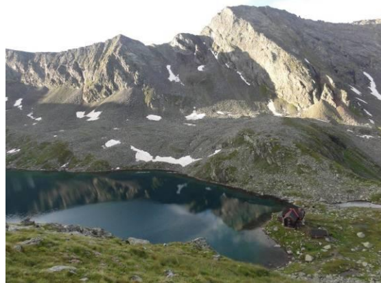
Pogled nazaj na kočico Artur von Schmid haus in jezero Dosner see