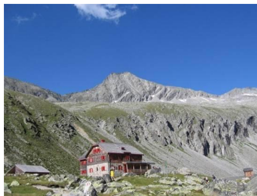
Kočica Artur von Schmid haus 2.281m, v ozadju Sauleck.

Arthur-von-Schmid-Haus je avstrijska planinska postojanka v Visokih Turah. Koča, zgrajena v letih 1910/11, prenovljena 1978/79, se nahaja na višini 2.281 m na zahodnem robu ledeniškega jezera Dösener See ob vznožju gore Säuleck, v skupini Ankogla. Vir : Wikipedija