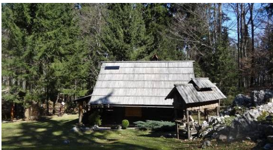
Na poti smo naleteli tudi na zelo lepo urejeno posestvo.

Sledila je pot do Goške ravni. Ob planinskem domu sem prebrala, da je Jelovica vključena v Naturo 2000, ker v njenih gozdovih domuje veliko ptic in parkljarjev. Žal smo mi srečali le dve beli gosi, za ogrado pa čudnega kozla in njegovo ženo kozo. Žal prav nobena izmed videlih živali in ptic ni bila avtohtona. Tudi krave, ki se bodo poleteli pasle na Goški ravni, ne bodo avtohtone.