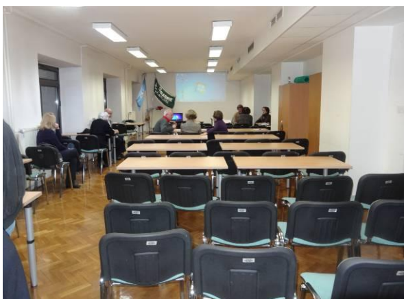
Pogled na sejno sobo v poslovni stavbi na Zarnikovi 3 v Ljubljani

Po daljšem iskanju in analiziranju podatkov o vrsti poslovnih prostorov, dvoran, sejnih sob itd., ki jih razne pravne in fizične osebe oddajajo v najem za plačilo, je UO društva uspelo izposlovati preko Četrtna skupnosti Ljubljana-Center brezplačni najem sejne sobe na Zarnikovi ulici 3 v Ljubljani.