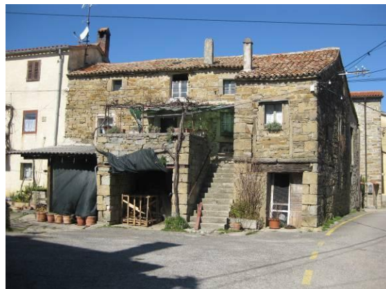
Zanimiva stara arhitektura istrske družinske hiše

Pomjan ni zanimiv samo kot zgodovinski kraj, pač pa je tudi stičišče raznih poti, ki vodijo ali pa se križajo v vasi. Je priljubljena izletniška točka kolesarjev, planincev, trimčkarjev, pohodnikov itd.