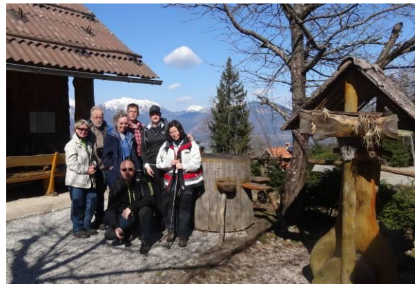
Udeleženci izleta pred kočo na Goški ravni

Gibčne bohinjske cike dajejo namreč premalo mleka, zato imamo raje »uvožene« krave s tako velikimi vimeni, da se komaj premikajo. Temperamentne cike so le ljubljenske in žal zelo redek okras v hlevih nekaterih Bohinjcev. Koliko cik ste že videli? Prav gotovo manj, kot smo videli jelk na Jelovici, ki bi že davno zaslužila ime Smrekovica.