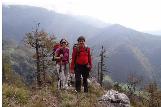
Pripravniška tura (na Babo)

Za prvi izlet sem izbrala meni zelo poznano pot na Goli vrh in tja peljala prijatelje, vendar sem imela vseeno malo treme pred vodnikom, pravzaprav tako zelo, da sem v mojih najljubših gorah (Kamniških Alpah) zamenjala Grintovec za Kočno ali obratno, se ne spomnim več. V bistvu sem še danes jezna sama nase zaradi tega spodrsaljaja, predvsem zato, ker res poznam Kamniške Alpe in so mi nekako najljubše, ampak nisem verjela vase in sem hotela samo pokazati svoje znanje. Ampak po drugi strani je pa tudi to bila super izkušnja, ki me je naučila, da ni nič narobe, če rečeš kdaj »ne vem, tega pa ne poznam«