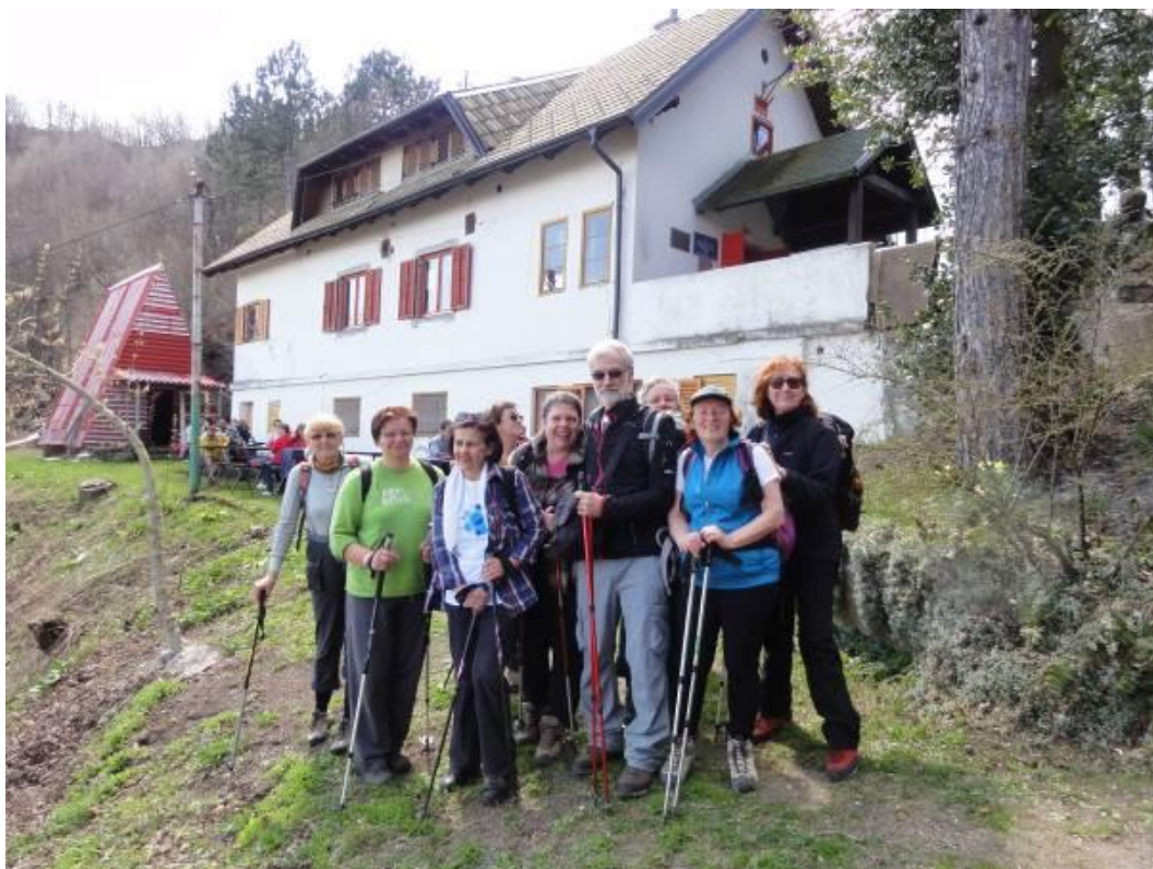
Pred kočo v Velikem dolu na poti nazaj.