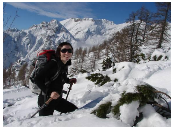
Uživanje v snegu (Viševnik).

Najraje imam seveda Kamniške Alpe, vendar pa le-te kaj dosti ne pridejo v poštev za vodenje, ker imam zaenkrat samo licenco kategorije A, kar mi ne dovoljuje vodenje v visokogorje.