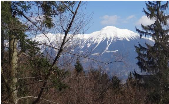
Enkratni pogled na zasnežene vršace med vzponom do našega cilja

jih bom v svojem naslednjem življenju videvala tam gori veliko več. Kadar se je gozd malo razredčil, so nas pozdravljale zasnežene gore – največkrat Stol, Vrtača in Begunjščica.