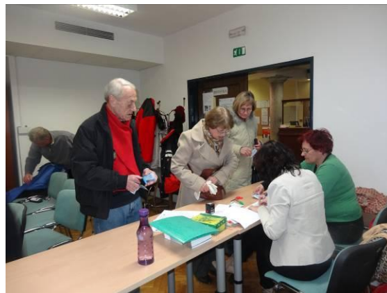
Pred pričetkom občnega zbora so člani lahko poravnali članarino.

običajno doslej. Glede na navedeno obstaja velika verjetnost, da bomo tudi v prihodnjem oz. v prihodnjih letih občne zборе imeli ob četrtek, če se seveda ne bo karkoli spremenilo.