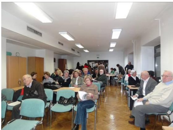
Utrinek s seje občnega zбора

Proti koncu leta 2014 pa je OU več časa posvetil pripravi programa izletov za leto 2015. Program je zelo obširen, saj je tako rekoč skoraj vsak vikend na programu kakšen izlet.