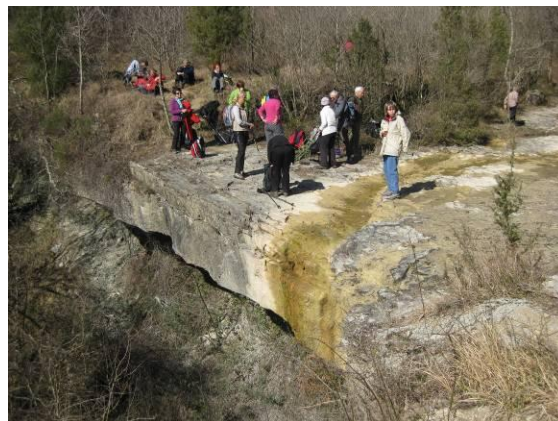
Slap Supot , ki je bil tokrat žal brez vode.

Slapa pa ob našem obisku zaradi dlje časa trajajočega sušnega obdobja, žal, ni bilo. Ob daljšem deževnem obdobju je slap Supot zelo markanten. Pri slapu Supot smo se vihniki odpočili, pomalicali in si nabrali moči za vzpon proti Pomjanu.