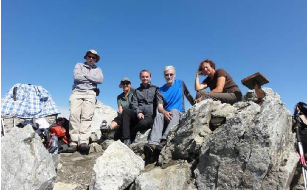
Končno vseh 5 na vrhu SAULECKA - 3086m.

Pojedli smo vse energetske ploščice, čokolade in sendviče, popili čaje in limonade in naredili na desetine fotografij. Pot navzdol je bila lažja in tudi mi smo bili lažji in srečni. Še juhica v koči in pot navzdol do avta.