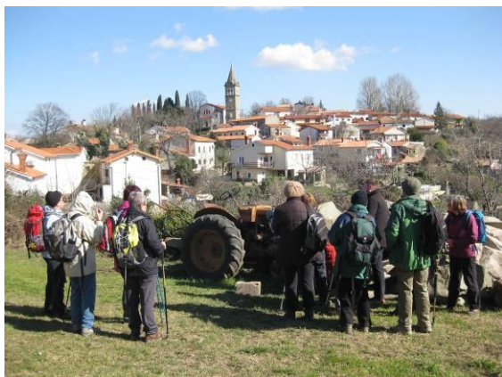
Pogled na Koštabono

Koštabona je ena najlepših strnjeno pozidanih istrskih vasi z dobro ohranjeno istrsko vaško arhitekturo. Vasico obdajajo šmarski, pomjanski in pučarski hribi na eni strani ter dolina reke Dragonje in hrib Brič na drugi strani.