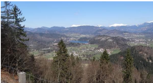
Pogled na Blejsko jezero s kočice na Taležu

Ob lovski koči na Taležu pa se je razprostrla vsa veriga Karavnak. Prav nikjer še nisem tako dobro videla Kepe v vsej njeni mogočnosti, kot sem jo zagledala na Taležu. Gledala sem vrhove in se spominjala, kdaj in kako sem lezla nanje – Dovško Babo, Golico, Struško. Ali bom letos videla ključavnice, ki bodo namesto sedanjega snega belile pobočja teh gora? Iz doline nas je kot modro oko zrlo Blejsko jezero. Zrak je bil tako čist, da smo lahko videli celo blejske hotele in cerkev na njegovem otoku. Pogledi so bili tako lepi, da bi ocenila izlet z najvišjo oceno, tudi če bi se na Taležu že zaključil.