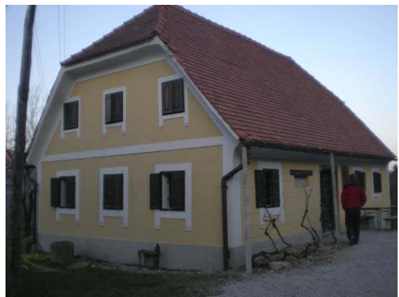
Rojstna hiša pesnika Antona Aškercja.

Predstavil nam je tudi življenjsko pot pesnika in njegovo napredno razmišljanje nasproti zakrnelim in zastarelim nazorom takratnih oblastnikov in kmečkega prebivalstva. Zaradi navedenega je bil kot duhovnik večkrat kazensko premeščen, v domačem kraju pa tudi ni bil najbolj zaželen. Vsi ga poznamo kot pesnika, manj znano pa je, da je veliko naredil kot arhivar v današnjem Zgodovinskem arhivu v Ljubljani, na kar smo bili ob obisku posebej opozorjeni. Pokopan je na starem ljubljanskem pokopališču Navje.