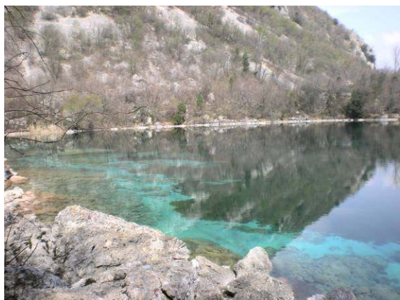
Sredi rezervata je majhno jezerce s kristalno čisto vodo.

Rezervat pri Corninu leži v predalpskem svetu, ki je s svojimi značilnostmi kot nalašč za pribežališče mnogim vrstam ptic: na eni strani skalne stene in na drugi strani grušč ob reki Tilment (Tagliamento).