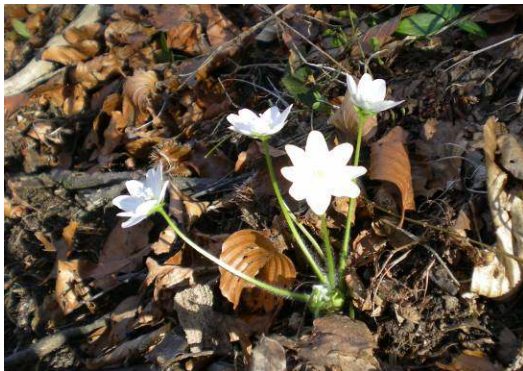
Beli jetrnik, ki je precej redek.

Kar nekaj časa smo se počasi vzpenjali in občudovali široko in lepo poseljeno dolino pod nami. Vsega lepega je enkrat konec in prišla je tudi strma pot skozi gozd, ki smo jo počasi, vendar vztrajno premagovali. Na tejle potki sem prvič videla tudi jetrnik bele barve, ki sicer zaljša gozdna tla s svojo izrazito vijoličasto barvo.