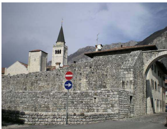
Obzidano mesto Venzone.

Po ogledu rezervata smo se odpeljali proti severu, v obzidano mesto Venzone (po slovensko Pušja vas, po furlansko Vençon).