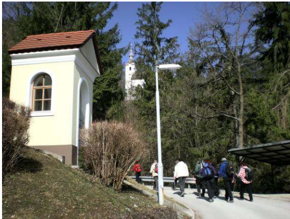
Približujemo se Lurdu.

Kar nekaj časa smo se počasi vzpenjali in občudovali široko in lepo poseljeno dolino pod nami. Vsega lepega je enkrat konec in prišla je tudi strma pot skozi gozd, ki smo jo počasi, vendar vztrajno premagovali. Na tejle potki sem prvič videla tudi jetrnik bele barve, ki sicer zaljša gozdna tla s svojo izrazito vijoličasto barvo.