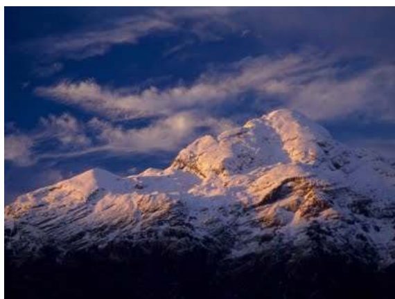
Avtorica: Nada LOMOVŠEK