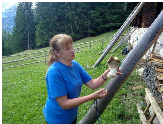
Kako neki bi, silni gobarki, ušel takšen primerek?

S temi besedami smo bučno, na ves glas, tudi s kakšno solzo, ki je od prevzetosti plavala v naših očeh, na znani napev začeli praznovanje rojstnega dneva, jubileja, ki je tako veličasten, da si ga komaj upam izgovoriti. Ob takem jubileju, 80-letnici, se človek nehote zdrzne, zamisli in se vpraša: kam, za božjo voljo, bežijo ta leta, kaj vse so nam prinesla, tudi odnesla, kaj smo doživeli in preživeli? Gotovo pa se je naša slavljenska takrat spomnila tudi lepih reči, ki so se nam dogajale in zgodile skupaj, v naši družbi. Za to je kar nekaj razlogov. Veliko skupnih jubilejev je za nami, takih in drugačnih praznovanj, planinskih taborov, da ogromnega števila izletov niti ne omenjam.