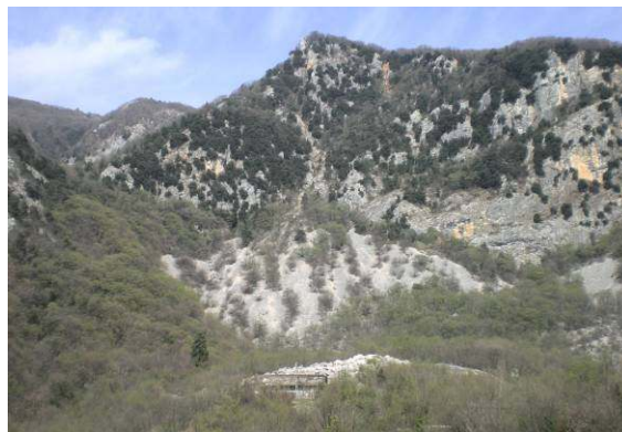
Rezervat jastrebov pri Corninu.

Sredi rezervata leži jezerce turkizno modre barve. Pravijo, da je veliko dobrih osem tisoč kvadratnih metrov in globoko do osem metrov. Napajajo ga podvodni izviri, voda pa prihaja predvsem od Tilmenta. Na vzpetini med jezercem in reko je razgledišče, kamor smo se seveda tudi povzpeli.