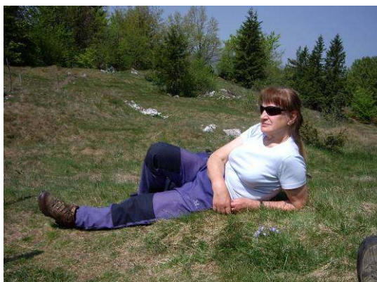
Kakšen neki je recept? Ne pove!.