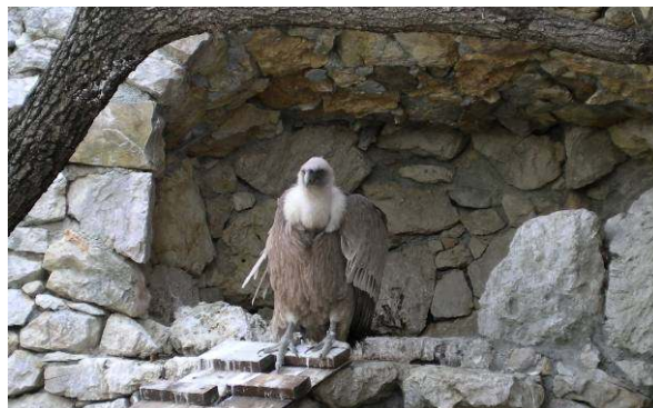
Beloglavi jastreb v rezervatu.

Italijani oglašajo rezervat v prvi vrsti kot bivališče beloglavih jastrebov. Kolonija jastrebov je bila ustvarjena namenoma, z nastavljanjem mrhovine.