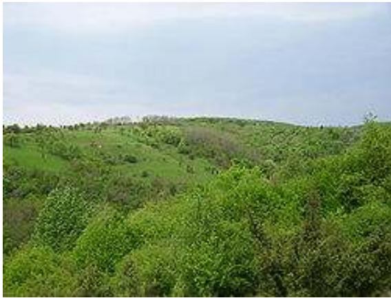
Fruška gora (internetne strani).