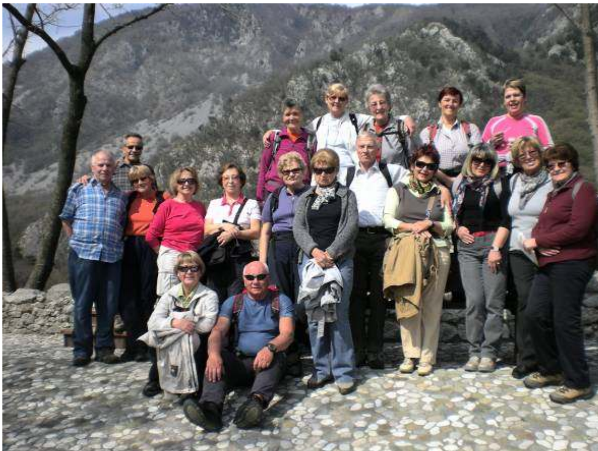
Večina udeležencev naravovarstvenega izleta. Nekateri so se fotografiranju izognili.

Po ogledu rezervata smo se odpeljali proti severu, v obzidano mesto Venzone (po slovensko Pušja vas, po furlansko Vençon).