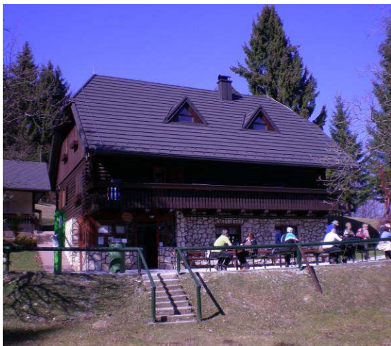
Pri povratku smo se ustavili pri koči na sedlu pod vrhom Kopitnika.