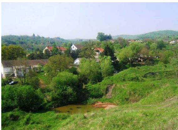
Fruška gora – Vrdnik (internetne strani).

Cena bo približno 150 €. Vključili bomo prevoz s posebnim avtobusom, 2 prenočišči v planinski postojanki, skupno večerjo v petek zvečer, 1 polpenzion v hotelu na Fruški gori ter skupno kosilo ob povratku.