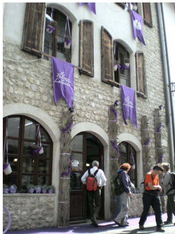
Trgovinice v starodavnem mestecu ponujajo razne izdelke iz lavande.

Kot v vsej Furlaniji je potres leta 1976 tudi tu prizadel precej škode. Tako so morali gotsko katedralo temeljito obnoviti, ostalo je malo umetnin, plastika Objokovanje in friz iznad vhoda.