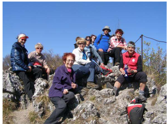
Veselo razpoloženje ob doseženem cilju.

Ko smo se malo okrepčali, smo veselo nadaljevali našo pot. Malo pod vrhom, na višini 865 m, stoji lična planinska koča, vendar smo se odločili, da se bomo ustavili pri njej pri povratku. Čez približno pol ure hoje smo se že povsem približali našemu cilju. Malo pred samim vrhom je bilo treba nekaj previdnosti zaradi ozkih in strmih pobočij, vendar nevarnosti ni bilo, saj je ta del poti opremljen z jeklenicami. Kopitnik se ponaša z 914 m višine, sam vrh pa je prepaden. Ime je dobil po svoji obliki, saj vrh gore res spominja na konjsko podkev. Z vrha je lep razgled na dolino Savinje in okoliško hribovje.