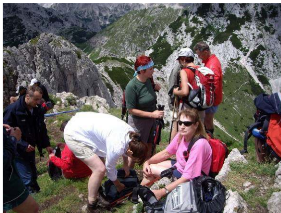
Počitek po naporni poti, malce razgleda, potem pa naprej.

vpisala s 1836 m visoko Golico, ki ji je sledila še malo višja Dovška Baba (1891 m). V istem dnevu, da ne bo pomote. V tistih časih smo jo dobro odnesli, če je bil pohod krajši od 8 ur.