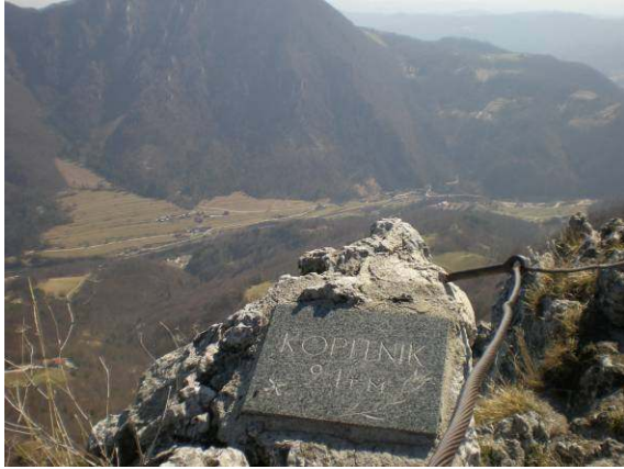
Označba na vrhu Kopitnika visokem 914 m.