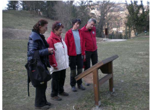
Postanek in sproščanje pri eni izmed 14 zdravilnih točk.

podrobnosti o življenju iz tistega časa. V hiši smo lahko občudovali jedilno mizo z intarzijo, ki jo je naredil pesnikov oče, v spalnici pa smo videli še dva pesnikova plašča.