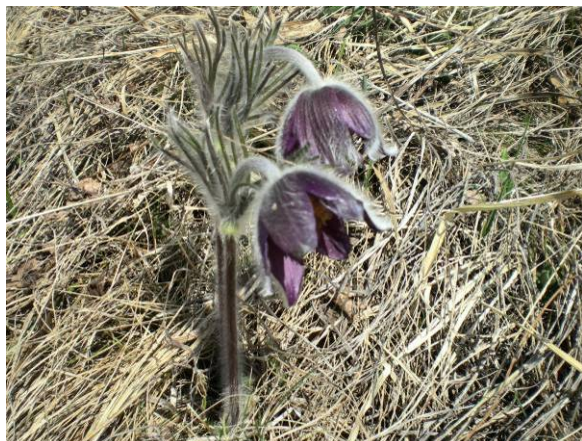
Prvi hip so nekateri zamenjali gorskega kosmatinca z velikonočnico.

traviščih, ki se razprostirajo tudi med Lipnikom in Goličem.