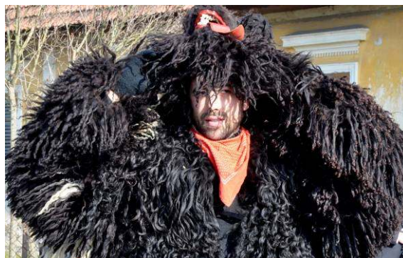
Korantova kapa, običajno je dlaka bela, izjemoma je črna.

Korant nosi kapo, ki je zadaj kosmata, obraz je iz starega usnja s prišitim nosom in izrezanimi odprtini za oči ter usta. Iz ust mu visi dolg rdeč jezik. Na kapi ima rogove iz usnja ali klobučevine, rogove pa zaključujejo gosje perje in večbarvni papirnati trakovi med rogovoma.