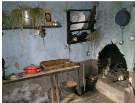
Ena izmed hiš je preurejena v muzej, ki prikazuje tipično razporeditev prostorov in značilno opremo ter predmete.

Nad staro arhitekturo vasi in dobro restavriranimi stavbami, razen nekaj izjem, smo bili vsi navdušeni. Najstarejše hiše so menda še iz srednjega veka. Grajene so ena poleg druge, med njimi so le ozke s kamnom tlakovane poti. Nekoč je imela vas okoli 400 prebivalcev, danes pa v njej živi le še 24 ljudi. V eni izmed hiš, preurejenih v muzej smo lahko videli skromno in enostavno opremo v posameznih prostorih, s katero so razpolagali v starih časih.