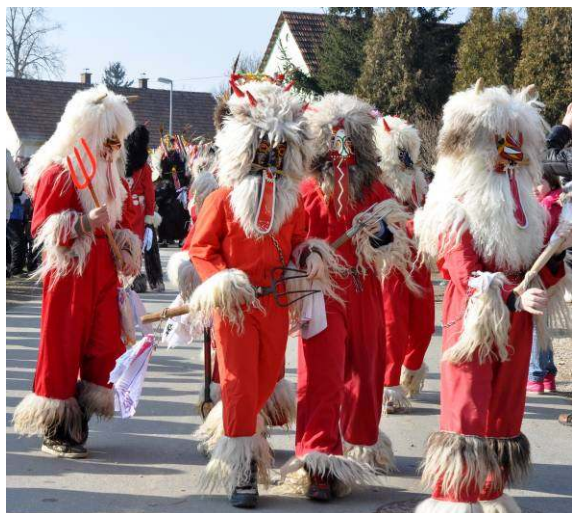
Hudički varujejo korante, ki so v ozadju.

O korantih in hudičkih bi lahko napisal še marsikaj. Vsak, ki ga to zanima, si lahko to ogleda na spodaj omenjenih spletnih straneh.