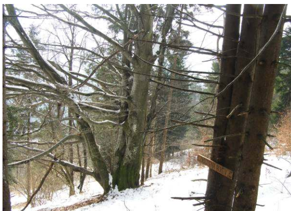
Opozorilna tabla za zaščiteno bukev.

Prijatelj, soimenjak, me je v mojih prvih službenih letih popeljal nekam visoko v poraščen hrib, med Režišami in Ravnikom. Tam, kjer se Mala cesta naveže na Keltiko. Po uhojeni stezici, zaraščeni z leščevjem in mladimi brezami s svilnatim belim lubjem, sva jo našla, pa ne prav kmalu, najdebelejšo bukev. Vedel je zanjo. Deblo debelo, da ga dva moška ne objameta. Iz panja rastoča stranska debela in množica stranskih vej. V višino je merila več kot petindvajset metrov. Stara, ogromna, štrleča, drvarija. Mati gozda. Zapomnil sem si jo, večkrat sem jo želel obiskati, včasih sem jo našel, navadno prej odnehal. Pot se je zarasla, grmovje prepletlo do neprehodnosti.