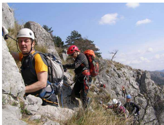
Takole počasi napredujemo.

Začetek šole je bil posvečen ustnim napotkom o pravilni uporabi pasu, napotkom za hojo oz. plezanje in poslušanje navodil vodnika, saj sta vsaka dva udeleženca imela svojega vodnika, ki je bil tudi njun nadzornik. Seveda smo se naučili tudi narediti tri alpinističnih vozle, osmico, bičevega in polbičevega, ter njih uporabo.