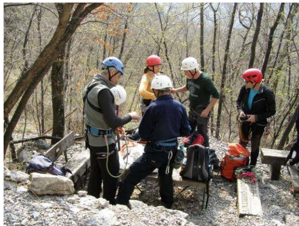
Skrbne priprave na vzpon - zapenjanje pasov.