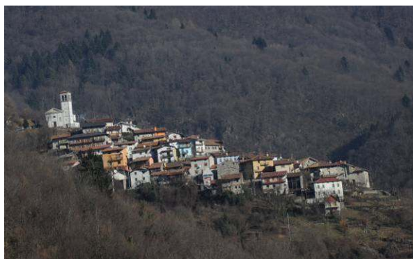
Slikovita vasica Topolo na strmem pobočju.

Sledila je strma in ozka pot. Na nekaj ovinkih je moral voznik avtobusa nekajkrat korigirati kolesa, da je lahko zvozil. Med vožnjo me je bilo pošteno strah, saj je avtobus zasedel celotno ozko cesto, pod nami pa so bila strma pobočja brez drevja, ki bi nas zaustavila v primeru morebitnega zdrs. K sreči se je vse dobro izteklo.