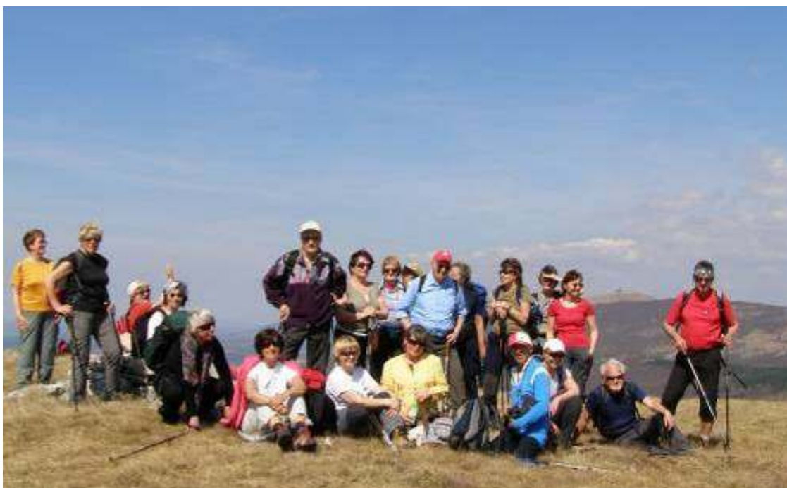
Skupinski posnetek na vrhu Malega Goliča.

zime zelenim rastlinjem in cvetjem, ki simbolizirata dolgo in radostno skupno pot. Na sredini prtona je obvezen sporočilni napis mladoporočencema, da pa vse ne bo šlo tako gladko, simbolizira še vprega oz. jarem. S skupno močjo pa bodo vse ovire premagane.