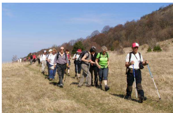
Pot je vodila preko širnih suhih travnikov.

zime zelenim rastlinjem in cvetjem, ki simbolizirata dolgo in radostno skupno pot. Na sredini prtona je obvezen sporočilni napis mladoporočencema, da pa vse ne bo šlo tako gladko, simbolizira še vprega oz. jarem. S skupno močjo pa bodo vse ovire premagane.