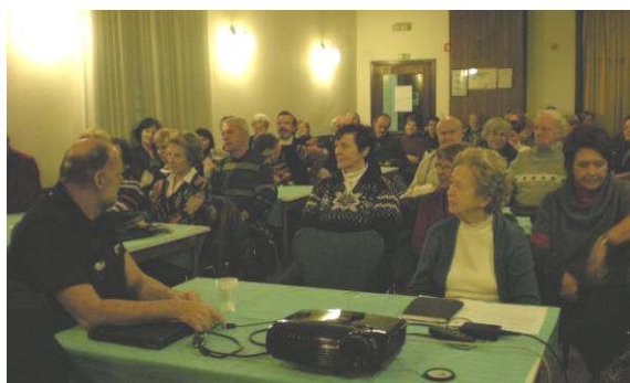
Utrinek z občnega zbora, ki mu je prisostvovalo 57 članov.

Predsednica društva je pri povzetku poročila posebej opozorila, da bodo prihodnje leto volitve. S tem v zvezi je spodbudila člane k tvornemu sodelovanju oz. iskanju kandidata oz. kandidatko, ki bi prevzel funkcijo predsednika društva. Sama namreč ne bo več kandidirala za to nalogo.