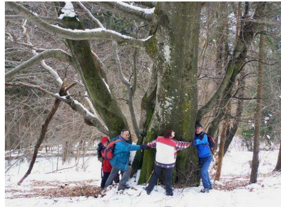
200-stoletno lepotico ni bilo lahko objeti.

Že dirjam od mize, od knjig, pa čez vrt, pa v breg, po znanih poteh pod Ostri vrh, pa ob vodovodu, pa levo, pa na vse štiri pod grmovjem, mimo robide, kot kača, kot krt, zadihan in pregret, se znajdem pred svojo bukvijo.