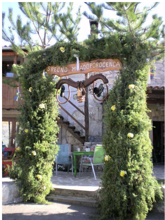
Primorski prton za mladoporočenca.

Prav na ta dan sta se »vzela« lastnika hostla (Ljubljančan in Dolenjka) in smo nekateri, ki nismo šli na oba vrhova, prisostvovali pri poroki, ki je bila po vseh pravilih poročnega obreda. Prijetni spomini.