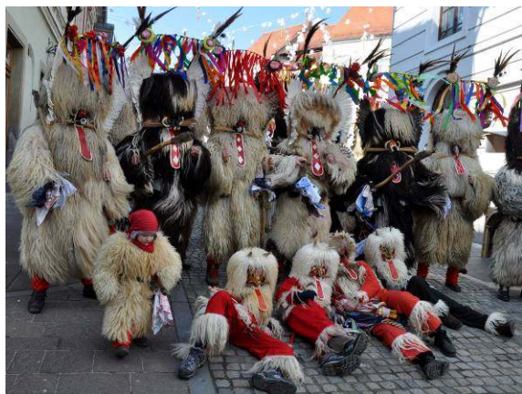
Koranti in hudički.

hudička je, da spravlja korante v skupino in skrbi, da se kateri od korantov ne izgubi ali pa ne zaide, tako da bi postal plen drugim.