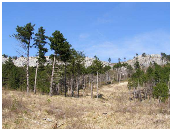
Vsa pokrajina v okolici Goliča je travnata, z redkimi drevesi in opravičuje ime najvišjega vrha.

partizanskim spomenikom, ki spominja na težke čase med drugo svetovno vojno. Tudi preproste cerkvice sv. Martina iz leta 1697 ne smemo pozabiti, ker je sveti Martin vaški zavetnik in praznujejo 11. novembra Martinovo.