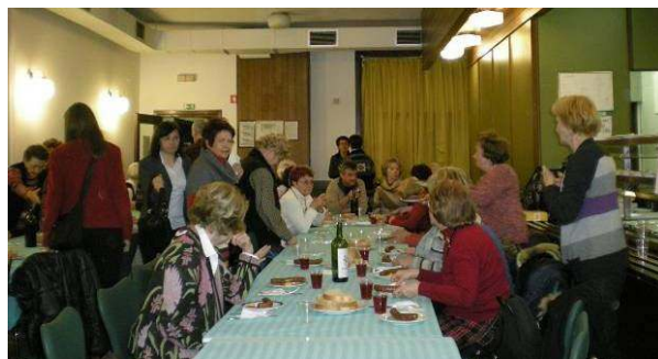
Prijeten klepet članov društva po uradnem delu občnega zbora.

Tudi v letu 2010 je bilo nekaj članov društva, ki so si prislužili priznanja PZS ali PD Viharnik. Članici delovnega predsedstva sta prebrali obrazložitve za podelitev priznanj, ki jih je nato podelila predsednica našega društva.