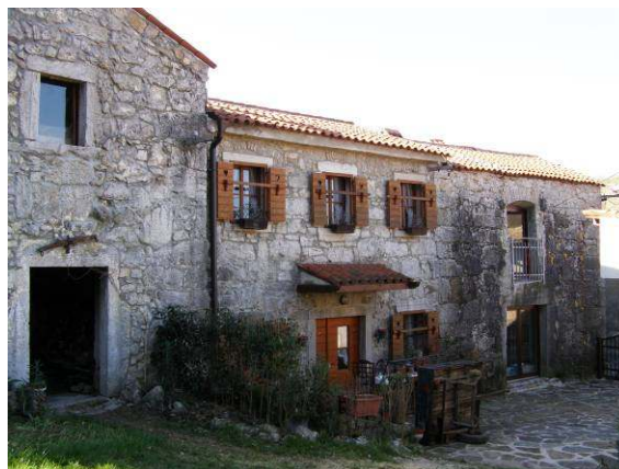
Lepo obnovljena hiša v vasi Zazid.

In kje je bil naš cilj? Kraški rob s svojimi razglednimi vrhovi Lipnik (804 m) in pa Golič (890 m). Začetek poti s prvo markacijo je v vasi Zazid (387 m), ki je pomembno planinsko izhodišče s svojimi potmi na bližnje in daljne vrhove.