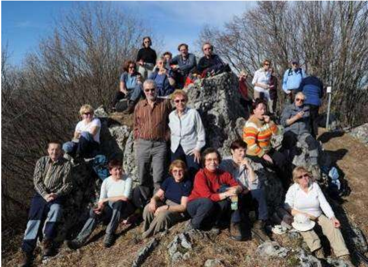
Skala na najvišji točki Svetega Martina je nudila lepo kuliso za skupinsko sliko.

Sledil je rahel spust do cerkvice svetega Martina na višini 987 m, ki je bila nedavno tega prenovljena. Pred vhodom so bile lesene klopi, kjer je ležal časopis napisan v slovenskem fonetičnem jeziku tukajšnjih prednikov. Vodnik nam je prebral članek iz časopisa. Kljub temu da je vseboval domače staroslovenske izraze in skovanke, na katerih se je kazal vpliv italijanskega jezika, smo besedilo dobro razumeli. Članek je opisoval težko življenje v teh krajih, zlasti po obeh vojnah. V vaseh ni bilo hiše, iz katere ne bi vsaj en član zapustil rodno vas in odšel s trebuhom za kruhom po svetu. Odpravili so se v tuje dežele, čeprav niso poznali niti ene besedice tujega jezika. Kljub temu so se v tujih krajih dobro znašli, dobili zaposlitev, nekateri ustvarili tudi solidno premoženje. Sedaj, v zrelih letih, se vsaj enkrat letno vračajo v rodni kraj. Tako je postala tradicija, da se vsi izseljenci enkrat letno dobijo, se poveselejo in se pogovarjajo o težkih časih njihovega življenja. Ob tem si obljubijo, da se bodo prihodnje leto ponovno srečali, če bodo še živi in zdravi.