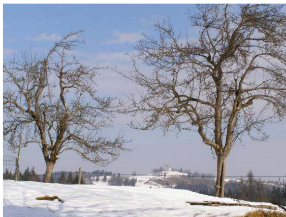
Do tja in še naprej moramo. Cerkvica sv. Barbare v vasi Ravniki pri Hotedršici.