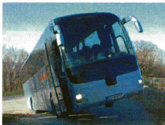
Za svojevrstno doživetje je poskrbel tudi šofer avtobusa, ki je speljal le s tremi kolesi.

Da je bilo samo potovanje tokratnega izleta resnična dogodivščina, pa je poskrbel še šofer velikega avtobusa, saj se je tokratnega izleta udeležilo kar 49 viharnikov. Na zadnjem strmim ovinku, tik pred ciljem, smo obtičali, saj šofer ni uspeli speljati ostrega ovinka. Avtobus se je začel rahlo tresti ter počasi, vendar vztrajno nagibati. Bili smo kar malo zmedeni in vsi smo želeli čim prej ven. Prednje levo kolo avtobusa je bilo že krepko v zraku, ko smo bili vsi na prostem. Nato je šofer s svojimi bogatimi izkušnjami zelo elegantno speljal in kmalu nato je bil avtobus zopet trdno na tleh na vseh štirih kolesih. Zaploskali smo od veselja, ko se je vse srečno končalo.