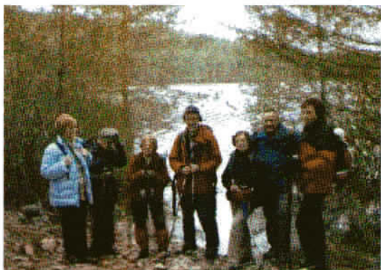
Nekateri viharniki smo preverili temperaturo vode Petelinjskega jezera .