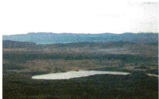
Z vzponom proti vrhu smo imeli vedno lepši pogled na presihajoče Palško jezero, ki leži severno od naselja Palčje.

Po kratkem postanku na bencinskem servisu v Postojni smo kaj hitro prispeli do našega izhodišča Vlačna. Poimenovanje je povezano z vleko lesa iz gozdov pod Sv. Trojico. Zapustili smo topel kombi in se odpravili proti našemu cilju, katerega vrh se je belil pred nami. Po slabih dveh urah smo bili na cilju, zadnjo tretjino poti smo opravili v snegu. Vrhu so pravili domačini tudi Lonica, ker je vrh podoben veliki seneni kopici, ki ji pravijo domačini lonica.