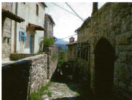
Glavna ulica v Humu.

V slovenskih krajih so prvi najstarejši ohranjeni napisi in grafiti v glagolici iz 15. stoletja v cerkvah v slovenski Istri, v Krkavčah, Koprju, Dolini pri Trstu, pa tudi na Gorenjskem, v Stari Fužini, Godešičih, Mošnjah, Mačah, ter na Dolenjskem in še kje na Primorskem. Tudi protestanti so se zanimali za glagolico, vendar je Trubar rekel, da gre za hrvaško pisavo, in res se je ta zelo razširila po hrvaškem Primorju, Dalmaciji in notranjosti Istre