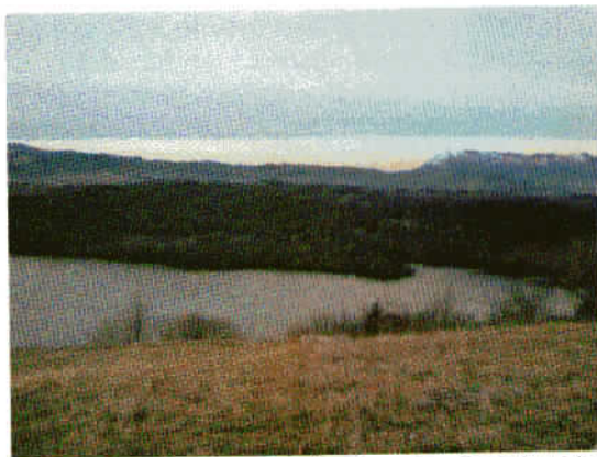
Pri spustu se nam je kazalo Petelinjsko jezero, v ozadju Nanos.