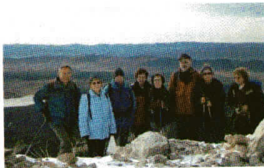
Na vrhu Svete Trojice smo naredili skupinski posnetek.