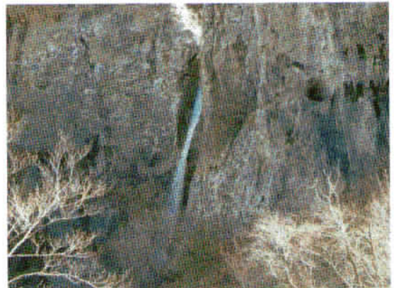
Slap Sapot, visok 23 metrov.

Na poti smo šli mimo ostankov rimskega vodovoda. Po pobočju se vije trasa opuščene železniške proge Hrpelje – Kozina – Trst (sv. Andrej). Posebnost te doline je nenadni prehod med zgornjim celinskim in spodnjim sredozemskim podnebjem. Vrste lokalnega rastlinstva so odvisne od te razporeditve podnebja. Tudi geološko se zgornji tok Glinščice bistveno razlikuje od spodnjega. Najprej teče po flišu, nato pa se preko slapu preljuje na izrazita kraška tla. Zaradi teh posebnosti je v dolini priložnost za preučevanje različnih geoloških pojavov, kakor tudi rastlinstva in živalstva.