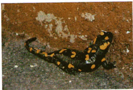
Vsak močerad ima svoj lasten vzorec rumenih peg na črnem telesu.

teče potoček in vsako leto spomladi in jeseni se pojavijo okrog hiše.