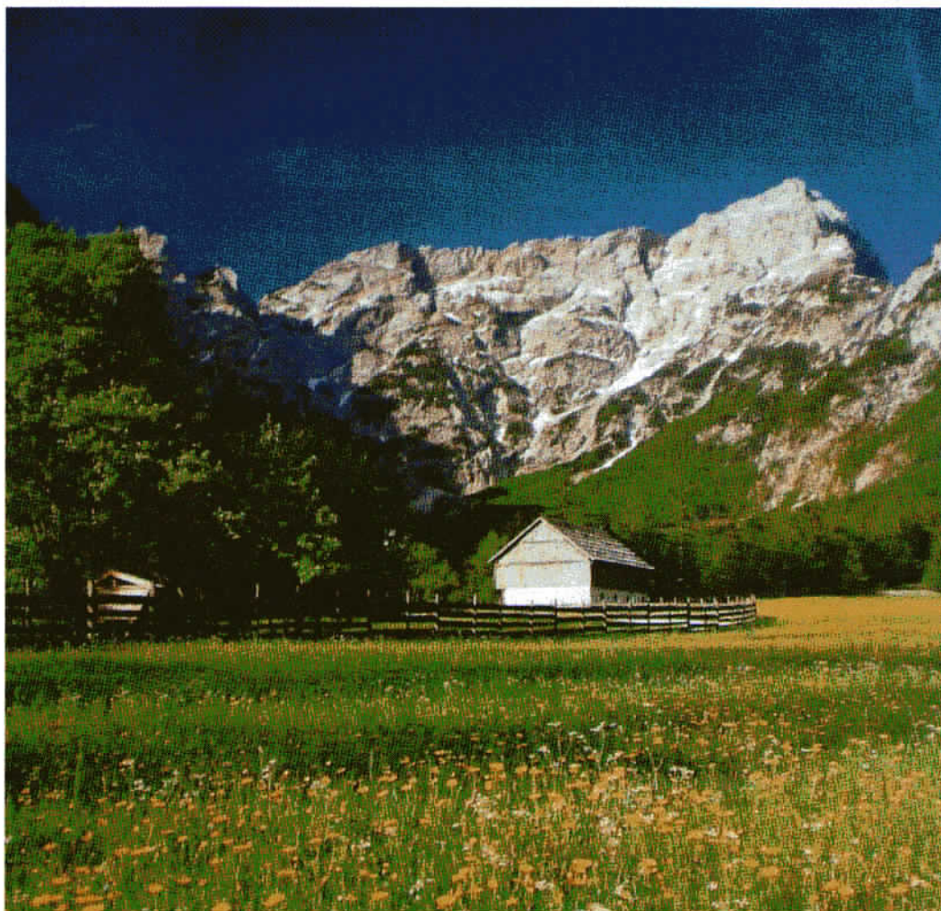
Robanov kot – v deželo je prišla pomlad.

LETNIK XXXIV – APRIL 2009, ŠT. 2 ISSN 1318-9484