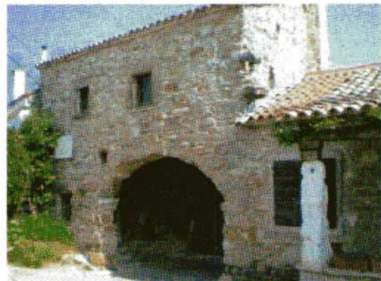
Del obzidja, kjer je tudi glavni vhod v naselje Roč.

Naš prvi cilj je bilo staro naselje Roč, kjer smo si ogledali zgodovinske znamenitosti iz 12. in 14. stoletja.