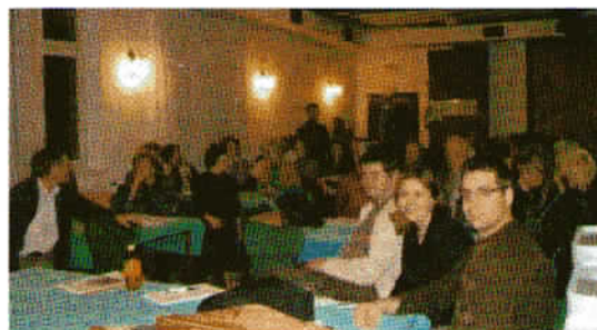
Podajanje poročila o opravljenih izletih v preteklem letu s strani predstavnika enote Tacen.

V okviru javne razprave glede prispevka o izgradnji novega planinskega muzeja je bilo največ različnih predlogov in mnenj o tem, kako upoštevati število članov društva, saj se je le-to v zadnjem letu nekoliko zmanjšalo, po pogodbi z ustanovo, ki skrbi za izgradnjo muzeja, pa bi morali upoštevati stanje članov društva konec leta 2007, ko smo imeli 242 članov.