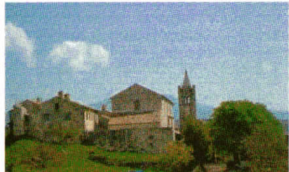
Hum, za katerega pravijo, da je najmanjše mestece na svetu.

Glagolica je najstarejša slovanska pisava, to je prva, glasovnemu sestavu stare cerkvene slovanščine prilagojena pisava. Sestavila naj bi jo brata Ciril in Metod (okrog 862), preden sta odšla na Moravsko, sicer pa je v glavnem obveljalo mnenje, da je to Konstantinovo delo. Glagolica je dobila ime po besedi "glagolati - govoriti". Njena raba je najdena v najstarejših starocerkvenih slovanskih spomenikih, pozneje se je uporabljala še v rimskokatoliških liturgičnih knjigah v Dalmaciji. V glagolici so bile napisane prve slovanske knjige za cerkveno in posvetno rabo.