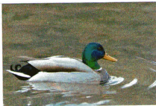
Račji samec se ponaša z bogatimi, bleščečimi barvami.

obarva spomladi v času parjenja v prelepe barve, konec pomladi pa se obarva v podobno obleko kot samica. Samec ima temno zeleno glavo z belim obročkom okoli vratu, rumen kljun in rjave prsi, perutnice in hrbet so svetlo sivi, črni zadek pa mu zaključuje par repnih peres-krivčkov.