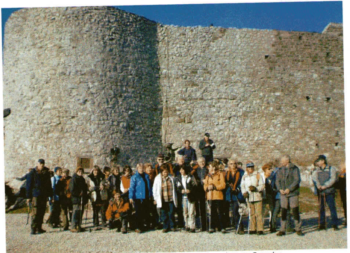
Pred pričetkom pešpoti obvezen skupinski posnetek pred gradom na Socerbu.

Cerkev v Črnem Kalu, ki smo si jo tudi ogledali, je tudi posvečena sv. Valentinu. Notranjost ni posebno bogata, saj zadnje prezidave sodijo v novejšo dobo. Posebnost cerkve pa je, da ima nagnjen zvonik, zato bi lahko rekli, da gre za slovensko različico stolpa iz Pize. Zvonik cerkve se menda nagiba zaradi drsenja flišnih tal.