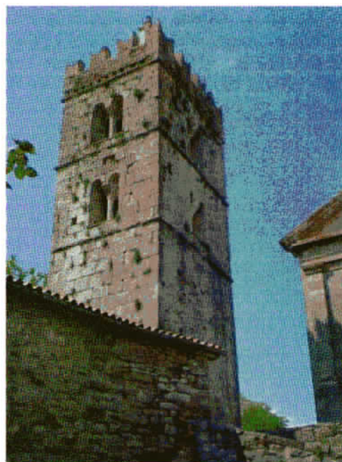
Zvonik ob župnijski cerkvi v Humu, z vgrajenim spominskim kamnom v glagolici.

Hum ima v današnjem času že zelo primerno urejeno podobo, ohranjen je kot spomeniško mesto, nekateri prostori pa so uporabljeni tudi kot razstavnici in trgovinice.