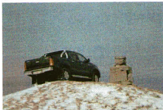
Terenski avto prav na vrhu Svete Trojice nad Pivko.

Viharniki smo mu bili priča na vzponu na Sveto Trojico nad Pivko meseca decembra. Ravno ko smo zapustili vrh na sliki in si nekaj metrov nižje iskali zavetja pred obzidjem istoimenske cerkvice, smo videli počasi vzpenjajoč se temen terenski avto.