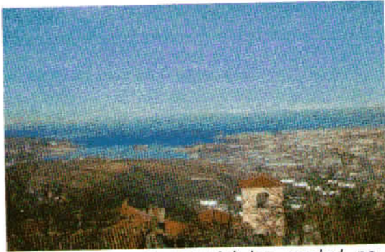
S Socerba se je ponujal lep pogled na Tržaški zaliv.

Nato smo veselo pričeli našo pešpot, ki je bila zelo razgibana, vendar sploh ne naporna, saj praktično ni bilo vzponov. Stezice so vodile po tipičnem obmorskem svetu, levo in desno porumenela trava, razno grmičevje, istrski hrast, tudi borovcev ni manjkalo. Venomer pa smo imeli lep pogled na morje. Za nami smo puščali Trst, pred nami pa se je počasi odpiral pogled na Koper in celoten Piranski zaliv.