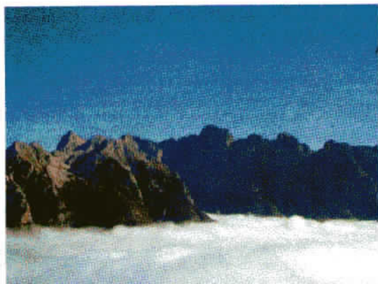
Špik in Škrlatica nad meglo.

prav neprijetno vreme, nad okoli 1500 m pa je bilo lepo sončno in toplo vreme.