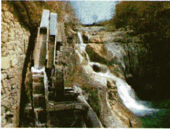
Kotli, na reki Mirni so še ostanki mlinskih koles.

Zadovoljni, polni vtisov, smo se odpeljali proti domu, najprej proti mejnemu prehodu Sočerga in se nato na slovenski strani takoj ustavili v domači gostilni, kjer smo se okrepčali s hrano. Nato pa smo se peš podali v hrib na razgledno točko, kjer smo imeli prelep pogled na hribovito hrvaško Istro, na Buzet in druge bližnje kraje.