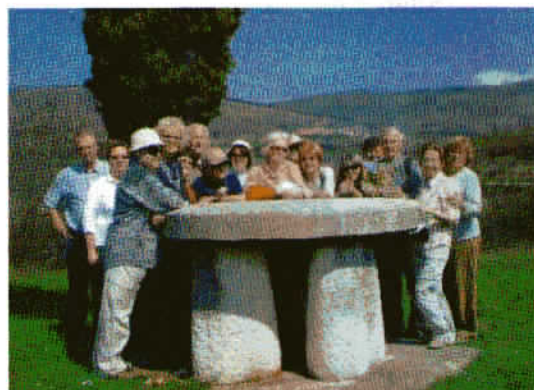
Viharniki pri Stolu Cirila in Metoda. Na obodu je ime spomenika, navedeno v latinici, cirilici in glagolici.

oddaljena enokrilna cerkev sv. Antuna Opata, ki je poznana po zavihku z asimetrično preslico. V Roču je bilo odkrito tudi večje število grafitov. V cerkvi sv. Antuna Opata so izpisani grafiti v razdobju od 13. do 15. Stoletja, med katerimi je najpomembnejši "Ročki glagoljski abecedarij" , ki je nastal okrog leta 1200. Tudi v cerkvi sv. Roka je ohranjenih več grafitov iz 14. in 15. stoletja.