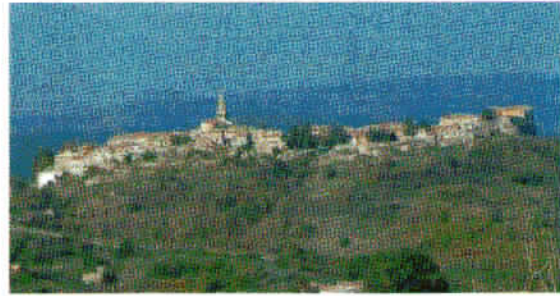
Roč - ogledali smo si zgodovinske znamenitosti iz 12. in 14. stoletja.

mejnemu prehodu Sočerga, zato smo se pravočasno preusmerili na staro cesto in na koncu Črnega Kala zavili na levo, na cesto, ki vodi proti mejnemu prehodu in mestu Buzet.