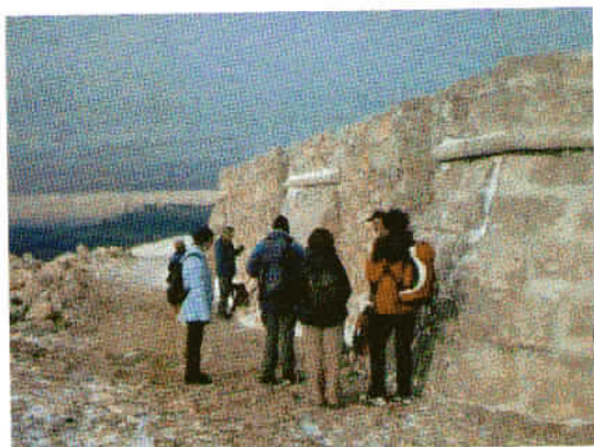
Pred ponovno pozidano cerkvico Svete Trojice nad Pivko.

Med sestopom smo srečali lovca, ki je na avto-prikolici vozil jabolka na krmišče. Z dovoljenjem lovca smo si tudi mi izbrali okusne sadeže.