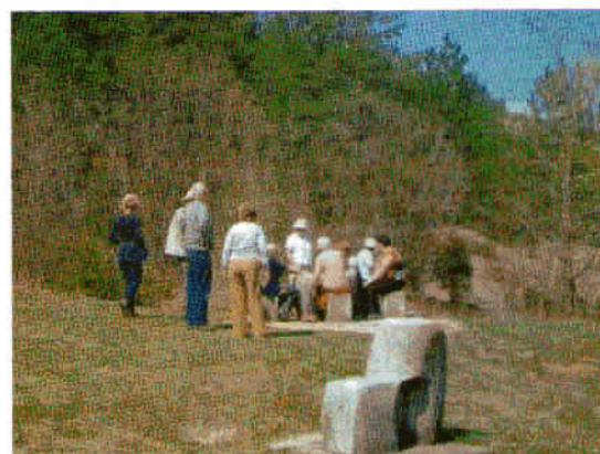
Postanek pri spomeniku Uspon Istarskog razvoda, kjer so iz kamna izklesane nekatere črke iz glagolice.

Zelo pomembna in značilna so glavna mestna vrata Roča (Velika vrata) na severnem delu mesta. Nad vrati je nekoč bila stražarnica, spodaj pa konjušnica. Ti prostori so bili kot deli obzidja v zadnjih letih obnovljeni in se uporabljajo za razstave in druge kulturne dogodke. Roč je poznan tudi po tiskarstvu, ki je tukaj cvetelo v preteklosti. Ob vhodnih vratih v Roč je lapidarij srednjeveških kamnitih spomenikov.