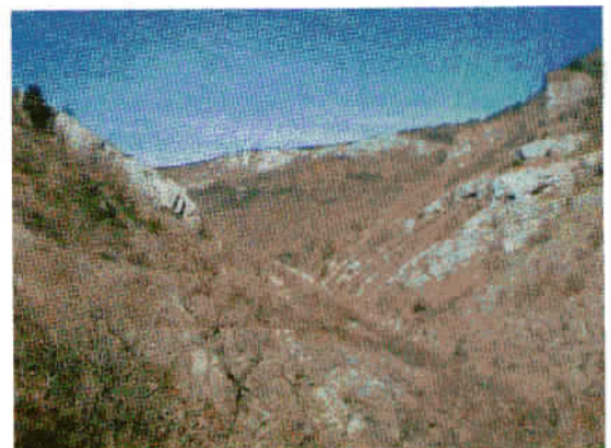
Spokojna dolina Glinščice.

Danes je ta dolina oaza za ljubitelje narave, ker je le nekaj kilometrov od mestnega hrupa, onkraj neokrnjene narave, z endemičnim cvetjem, predvsem spomladi, poleti pa se je v bistri vodi moč lepo ohladiti. Dolina je tudi uradno zaščitena kot narodni park.