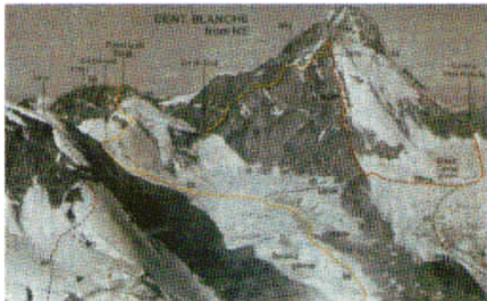
Skica dostopa in sestopa na Dent Blanche. Na sliki je z rdečo barvo označen dostop, z rumeno barvo pa sestop.

košček zaledenele pancete mi niti najmanj ne tekneto, za ovomaltine in ovsene kosmiče pa menda ni časa. Če sem iskrena, se mi ne gre naprej in najraje bi ostala, kar tukaj, kjer sva, da se vsaj odtajam in dobro naspim. Bine mi pojasni, da je pač tako na vsaki alpski turi in zato dva ali tri dni lahko le sanjava o topli postelji in dobro založeni mizi ali vrčku hladnega piva. Ne preostane drugega, da odrineva naprej.