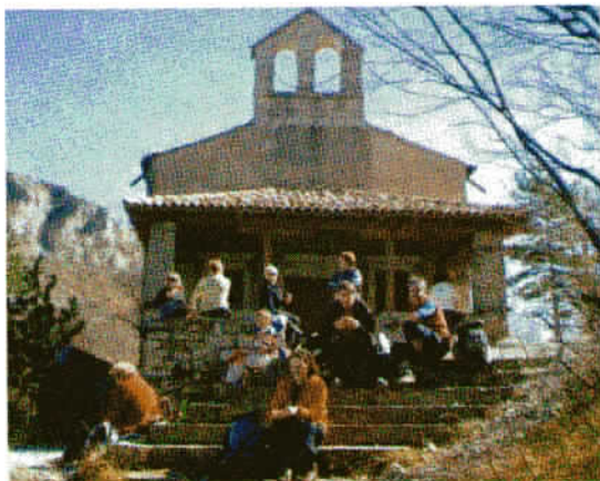
Počitek pri cerkvici sv. Marije na Pečah.

Po hudi, vendar kratki strmini smo se vzpeli do cerkvice, posvečene sv. Mariji na Pečah. Posedli smo po kamnitih stopnicah, odprli nahrbtnike in se okrepčali, vmes pa smo opazovali drugo skupino naših planincev na nasprotnem bregu, ki so plezali v ferati. V soteski je vse od leta 1929 plezalna šola, ki jo je ustanovil tržaški plezalec Emilio Comici. Vodnik nam je kazal tudi strmino nad cerkvico, od koder je bojda lep razgled, vendar ni premamilo nikogar. Spustili smo se navzdol k vodi in opazovali ter slikali slap Sapot, ki je bil sedaj lepo viden pod vasico Botač na začetku doline. Naša pot je vodila naprej do konca doline, kjer kraljuje veliko naselje Boljunec.