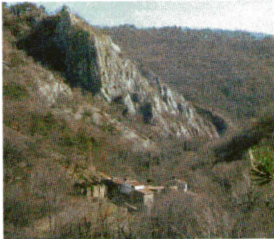
Majhna, stara vasica Botač, na začetku doline Glinščice.

No, kaj pa so mleli, saj dolina ni posebno široka za žitna polja? To so bili mlinci za obdelavo začimb, ki so prihajale po morju do tržaške luke. Tako so mlinci mleli predvsem začimbe in droge, ki so nato skupaj s soljo iz tržaških solin potovale naprej proti srednji Evropi.