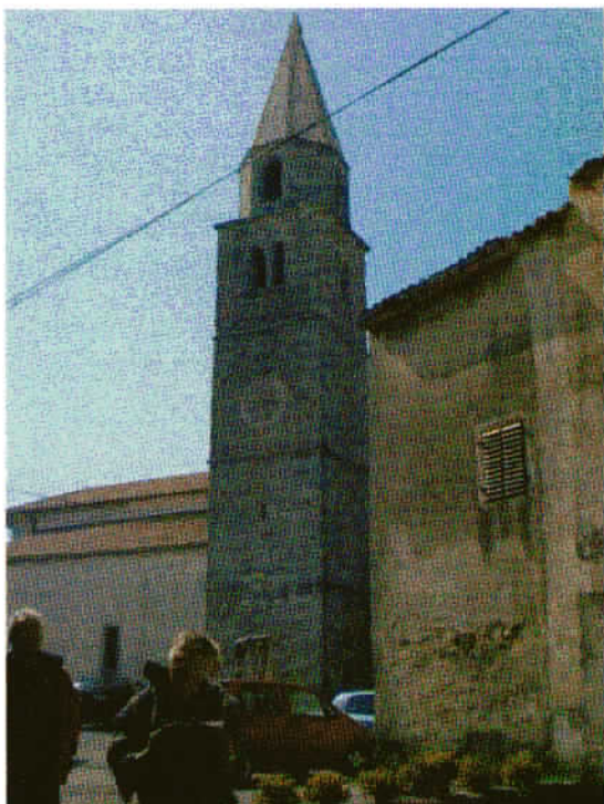
Gotska cerkev v Roču, posvečena sv. Bartolu

Prispeli smo torej do simpatičnega naselja Roč, ki se omenja že leta 1064, po najdbah sodeč je bilo naseljeno že v prazgodovini in v ilirskem obdobju. Roč je nastal kot utrjeno naselje na mejnem področju in ugotovljeno je, da je bila ta ugodna lokacija na hribu naseljena že v rimskem in bizantinskem času. Roč kot urbano naselje pa se je oblikovalo v obdobju od 12. do 14. stoletja. Osrednji del se je nahajal na ploščadi v severozahodnem delu naselja v notranjosti obzidja, bil je povezan s pravokotnimi ulicami s trgom in cerkvami v središču mesta ter z mestnimi vrati. Danes je ročko obzidje le delno ohranjeno, vendar dovolj, da je možno prepoznati celoten obrambni sistem z več stolpiči in z Velikimi in Malimi grajskimi vrati. Najpomembnejši srednjeveški spomenik Roča je romanska cerkev sv. Roka. Njena notranjost je poslikana z dvema slojema fresk iz 14. in 15. stoletja.