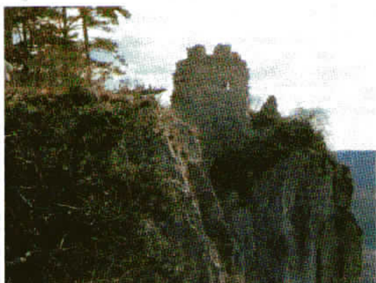
Ostanki starega gradu iz 11. stoletja nad Črnim Kalom.

Naše potepanje smo zaključili v primorski gostilnici v Črnem Kalu, ob stari serpentinasti poti, po kateri smo se včasih potrpežljivo vozili proti morju. Najbolj urni so takoj po okrepčilu skočili še do bližnjega ovinka, kjer je postavljen spomenik Prekomorskim brigadam. S svojo značilno obliko treh premcev bark ponazarja pot mnogih Primorcev in Istranov.