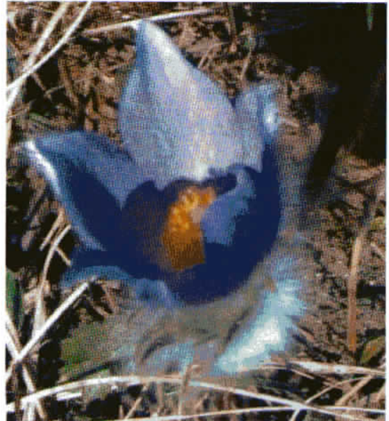
Velikonočnica uspeva pri nas na Boču in na Ponikvi pri Šentjurju.

na Boču, zelo znano pa je tudi na Ponikvi pri Šentjurju, kjer si tudi zelo prizadevajo ozavestiti obiskovalce, da je to zaščitena rastlina, ki cveti le tukaj. Ker je za njeno rast važna apnenčasta podlaga, ne bo nikoli uspevala na domačem vrtu, čeprav se je je marsikateri ljubitelj rož lotil.