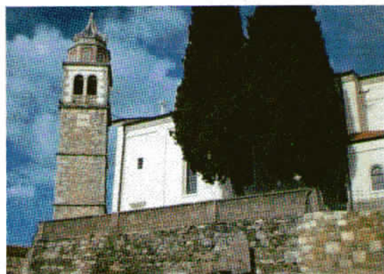
Cerkev, posvečena sv. Valentinu na Črnem Kalu. Zvonik je zaradi drsenja tal že precej nagnjen.

Naše potepanje smo zaključili v primorski gostilnici v Črnem Kalu, ob stari serpentinasti poti, po kateri smo se včasih potrpežljivo vozili proti morju. Najbolj urni so takoj po okrepčilu skočili še do bližnjega ovinka, kjer je postavljen spomenik Prekomorskim brigadam. S svojo značilno obliko treh premcev bark ponazarja pot mnogih Primorcev in Istranov.