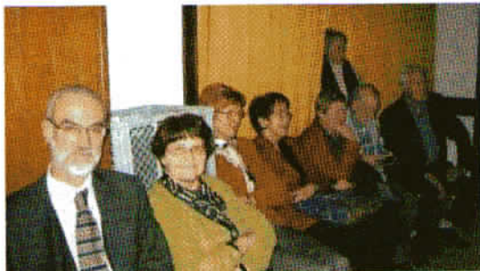
Udeleženci občnega zbora so z zanimanjem spremljali javno razpravo.

V nadaljevanju je bila obravnavana razširjena točka dnevnega reda glede spremembe Pravilnika o priznanjih PD Viharnik. Po dosedanjem pravilniku je lahko član društva z najmanj 15-letno udeležbo ob dopolnjenem življenjskem jubileju 70, 80 ali 90 let prejel spominsko plaketo le enkrat. Na občnem zboru pa je bilo besedilo ustrezno preoblikovano, tako da se glasi: