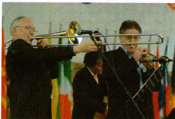
Utrinek z zabave ansambla Stari mački.

Tema natečaja, ki je bila razpisana v mesecu marcu, se je glasila: SREČAL SEM TUDI ZAPOSLENE STAREJŠE. To je pomenilo, da je bilo potrebno zajeti v objektiv fotoaparata razne trenutke, ko starejši ljudje opravljajo razne dejavnosti, se ukvarjajo s konjički, skrbijo za zdravje, se izobražujejo itd.