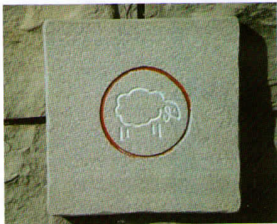
Celotna Pliskina pot je označena z ovčko plisko, ki z glavo tudi nakazuje smer. Ta markacija kaže pot na desno.

Opuščeni travniki pričajo o tem, da je bila nekdanj na tem območju zelo razširjena živinoreja, prodaja mleka pa je bil pomemben vir zaslužka. Največ mleka so prodali v Trst. Po drugi svetovni vojni je bil stik s tem mesto zaradi meje praktično onemogočen, zato je pričel Kras gospodarsko nazadovati. Mleko so oddajali le še v mlekarno v Sežani, ki ga je kmalu pričela uporabljati kot surovino za lepila. Iz nekdanje mlekarnice se je razvila današnja tovarna lepil Mitol.