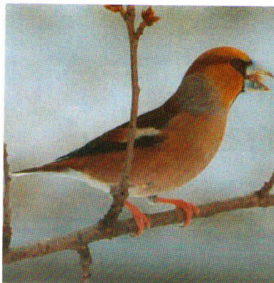
Živopisani dlesk, z značilnim močnim stožičastim kljunom.

ljubljski kotlini. Spomladi se hrani tudi s svežimi poganjki in popki.