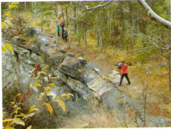
Peščeni spodmol – Slap pod Trebešami. Zaradi pomanjkanje vode tokrat slapa ni bilo.

Po krajši hoji smo prispeli do spodmola, ogromne peščenjakove plošče, preko katerega ob obilo padavin pada voda v slapu. Točka se imenuje Slap pod Trebešami. V času našega obiska je bilo vode zelo malo, zato nismo mogli v celoti občudovati te naravne znamenitosti.