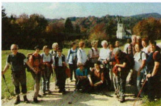
Na poti iz Prevega proti Rodežu. V ozadju cerkvija Sv. Brikcija.

Iz Ljubljane, ovite v vatko (meglo), smo se pripeljali do vasi Polšnik, ki je dobila ime po poljih (latinsko - gris gris), potem do vasi Preveg, kje so nam na kmetije gospe