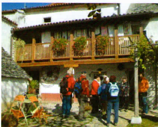
Pred mladinskih hotelom v Pliskovici, ki je urejen v tipični kraški hiši.

Vas naj bi dobila ime po ptici pliski, nekateri ji rečejo tudi bela pastirica, ki se je tukaj zelo pogosto zadrževala zaradi bližine pašnikov in kalov. Njena značilnost je, da živahno pliska ali udarja z repom ob tla. Pastirji so tudi najbolj živahne ovce poimenovali Pliska. Skozi ptico iz živahne ovce, naj bi torej vasica dobila me.