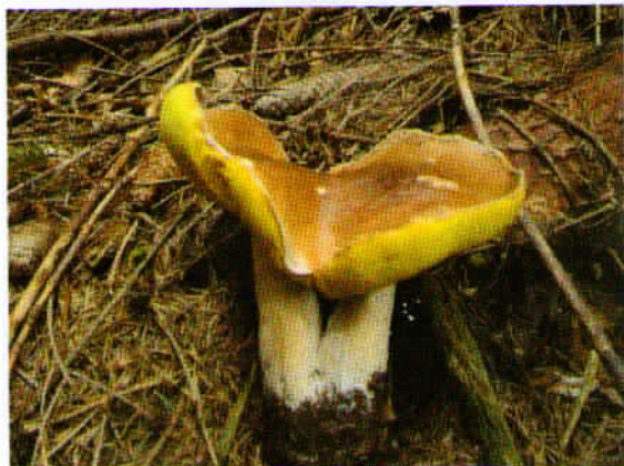
Jurček – siamski dvojček

Doma sem dvojčka z enim rezom zlahka ločila in iz njega je nastala sladna gobova juhica.