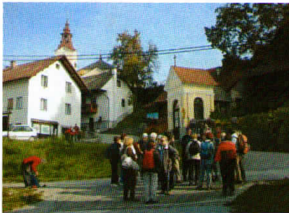
Pešpot smo pričeli v naselju Polšnik.