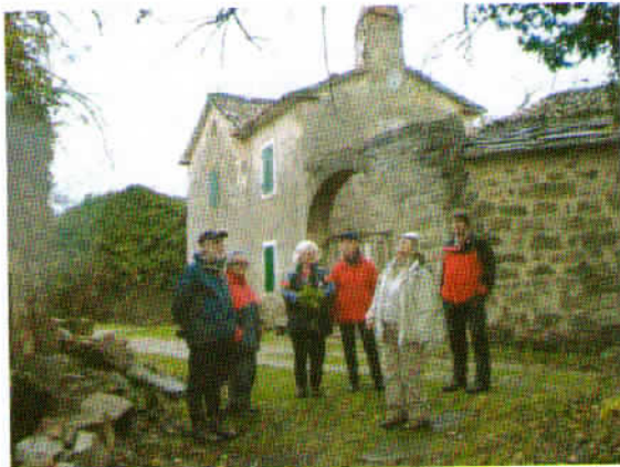
Viharniki med ogledovanjem zanimive arhitekturne zapuščine v Abitantih.

Abitanti so leta 1945 šteli 250 prebivalcev v 16 hišah, leta 2003 pa je umrla zadnja prebivalka. (Vir: Željko Kozinc – Lep dan kliče).