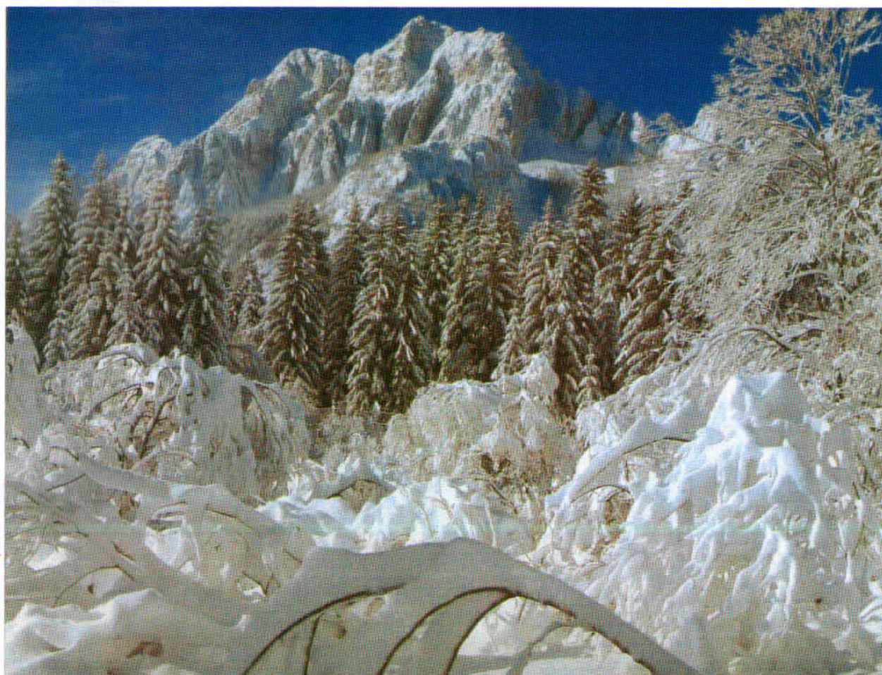
Okolica Rateč (Zelenci)

Letnik XXXIII – december 2008, št. 4 ISSN 1318-9484