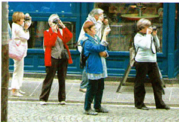
Udeleženci fotodelavnice pri praktičnem delu.