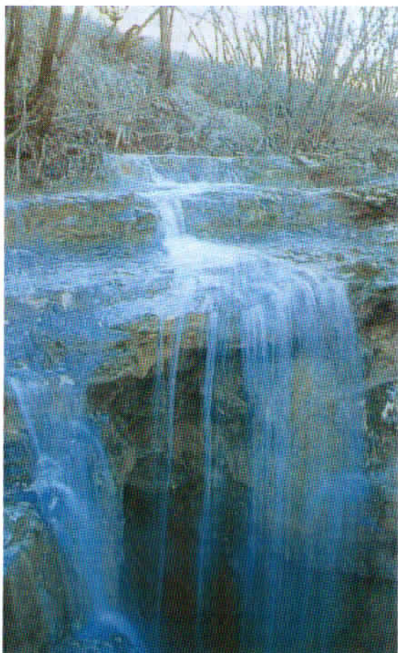
Ocizeljski ponorni slap.

Počasi pridemo iz podorov in ponorov nazaj na svetle travnike. Vojko predlaga še ogled partizanske bolnišnice. Ponovno se spuščamo globoko v eno od sotesk reke Korošice in na težko dostopnem in skritem mestu vidimo ostanke tragedije druge svetovne vojne.