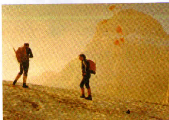
Naca na Bovškem Gamsovcu, leta 1972.

Izdatno mi je pomagal tudi pri neki monografiji iz zgodovine alpinizma, ki jo pišem že 17 let in jo bom nemara še enkrat toliko. Pa pustimo to. Ker imam v računalniku na zalogo nekaj deset neobjavljenih člankov, ki sem jih ob kakšni priložnosti napisal na dušek, takole bolj zase in za svoje veselje, potem pa jih nisem oddal v objavo, sem se vseeno odločil, da tri objavim v našem glasilu.