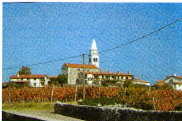
Slikovita vasica Pliskovica, s škrlatno rdečimi listi trte terana.

Nato smo z avtobusom nadaljevali pot do kraške vasice Pliskovice, z zelo lepo in veliko cerkvijo Sv. Tomaža, pred katero je mogočna lipa. Vas ima okoli 100 hiš, v njej pa prebiva le okoli 200 prebivalcev.