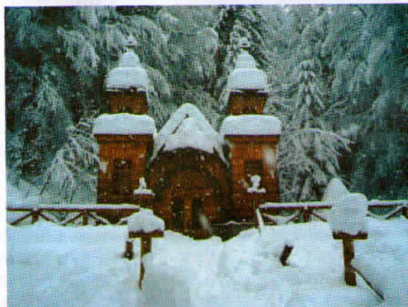
Ruska kapelica pod debelo snežno odejo.

Letošnje prvo sneženje je z debelo odejo prekrito zlasti severnejše predele države. Takole je znana Ruska kapelica gledala izpod bele preobleke, ki je zaradi obilice snega na prvi pogled težko prepoznavna.