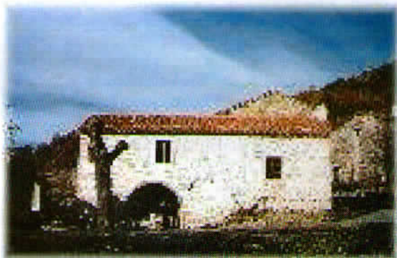
Bržanova domačija v Smokvici, kjer je viden prvi portal, vhod v stavbo.