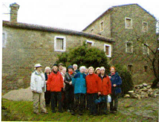
Udeleženci izleta pred dvema stavbama, katerih pročelje je že obnovljeno.

Polni mešanih občutkov smo vasico zapustili in se odpeljali do našega zadnjega cilja, to je prijetne gostilnice v Sočergi.