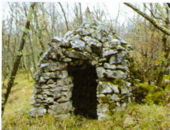
Iz kamna zloženo zavetje pred dežjem in soncem za pastirje, na Kuku.

Smokvica je tipična istrska gručasta vasica. Ime je menda dobila po figi – smokvi, iz katere pripravljajo vaščani odlične slaščice na praznik Sv. Magdalene. Ogledali smo si Bržanovo domačijo iz 16. stoletja, ki je lep primer istrske vaške arhitekture. Njeno posebnost pa predstavlja devet portalov, ki povezujejo celotno domačijo. Domačija je v slabem stanju, vendar jo je postopno začel renovirati Zavod za spomeniško varstvo v Piranu. Čelna stran stavbe je sedaj že prenovljena. Posamezni kamnoseški detajli pričajo o tem, kako bogati so bili nekoč lastniki te domačije.