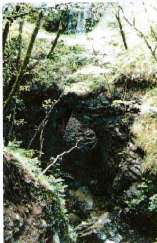
Naravni kamniti most.

hrastov, med katerimi je tudi cer, ki nas bo spremljal na naši današnji poti.