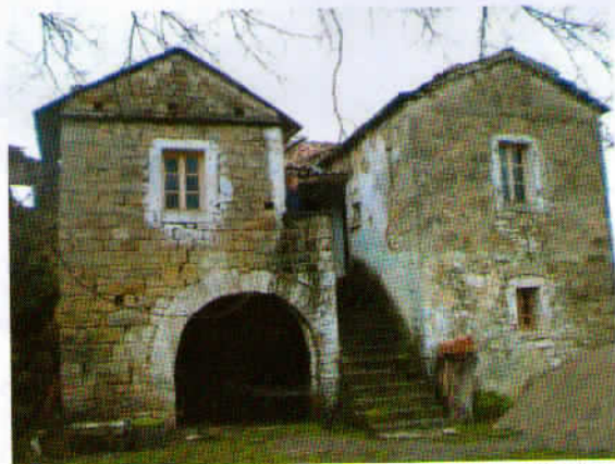
Enkratna arhitekturna zasnova stavbe. Pesek pred njo mogoče kaže na to, da se bo kmalu pričela prenova.

Kljub temu se zdi, da vasico Abitanti čakajo boljši časi, saj smo naleteli tudi na kup peska in drugega gradbenega materiala, ki nakazuje, da se bo nekje začela prenova. Dve izmed stavb pa sta vsaj po zunanjem izgledu že obnovljeni in se bohotita v lepoto istrske arhitekture. Pred tema stavbama smo udeleženci izleta naredili skupno fotografijo.