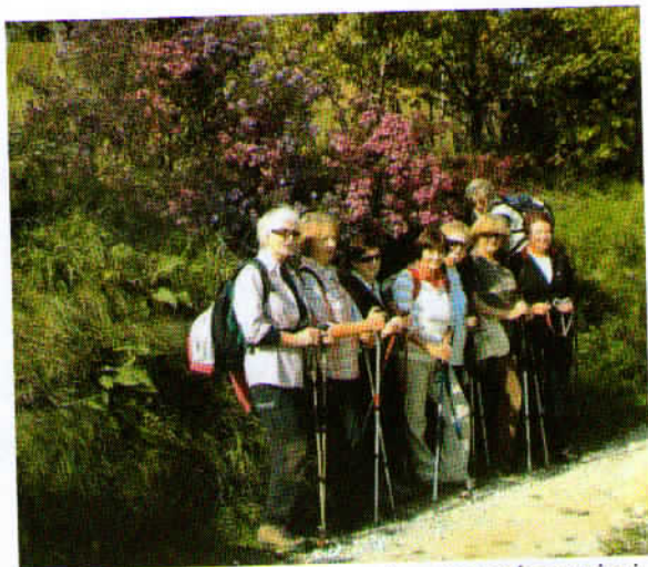
Rožice viharnice pred raznobarvnimi cvetočimi jesenskimi astrami.