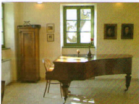
Klavir v rojstni hiši Srečka Kosovela priča o tem, da je bila družina tudi glasbeno izobražena.