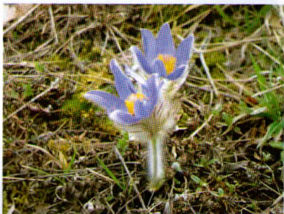
Velikonočnica – značilna, vendar zelo ogrožena cvetlica, ki uspeva na Boču.

Na poti na goro smo videli številne rastline in pestre drevesne vrste. Velikonočnica ali veliki kosmatinec je najbolj znana rastlina na Boču in z nežno vijoličnimi cvetovi, obilno porasla z dlačicami, predstavlja simbol gore. Suhi travniki na Boču so bili v preteklosti bogati z velikonočnicami, sedaj pa je to ena izmed najbolj ogroženih rastlinskih vrst v Sloveniji in tudi na Boču in se jo že težko najde, saj raste samo na določenih mestih. Ker je čas cvetenja velikonočnice bil že zdavnaj mimo, te cvetice tokrat seveda nismo videli.