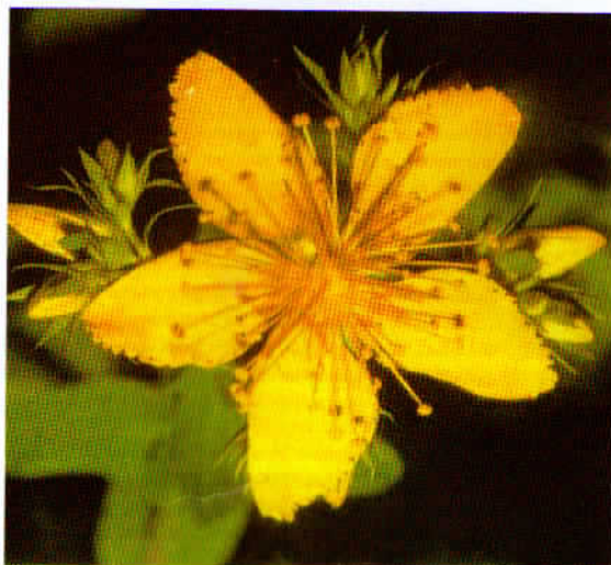
Santjanževka ali Kri svetega Janeza.

Zdravilne rastline večinoma sušimo, da so nam na voljo v času, ko jih ne moremo nabirati. Tako posušene rastline ali njihove dele imenujemo v farmaciji in fitoterapiji droge .