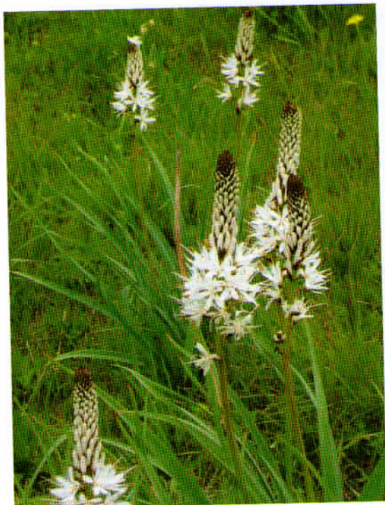
Zlati koren, z začetni fazi cvetenja.

Proti vrhu hriba smo naleteli na številne zlate korene, ki so bili v različnih fazah cvetenja.