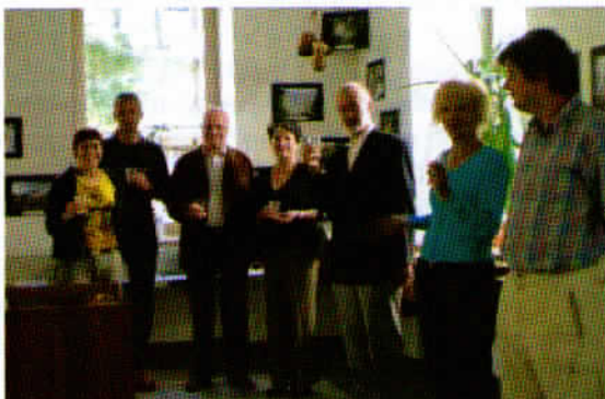
Otvoritev razstave PD Viharnik v prostorih bežigradske knjižnice.

Skratka v veselje vseh, ki so mi pri organizaciji pomagali s pomočjo brskanja po arhivih, stvareh in mislih, Viharnikove zgodovine in sedanosti; njim gre vsa čast ter zahvale, vam pa sporočam, da je razstava večinoma prejela pozitivne kritike.