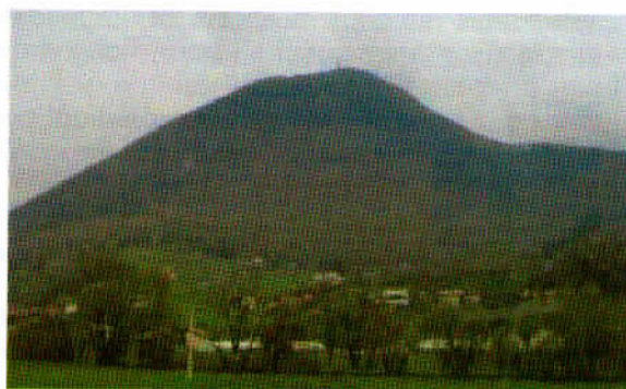
Boč – leta 1962 so na to goro postavili 20 m visok jekleni komunikacijski razgledni stolp.

Dosti lepega sem namreč že slišala o naravnih danostih Krajinskega parka Boč, pa tudi gora Boč za vzpon s svojimi skoraj tisoč metri nadmorske višine (979 m) ni kar tako, pot je celo prijetno planinsko strma, sem ugotavljala pri hoji navkreber.