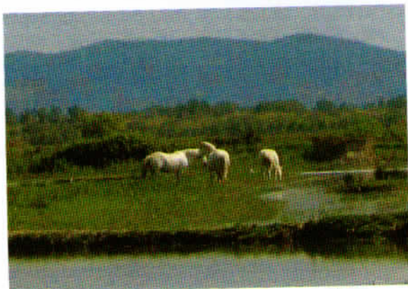
Divji konji se pasejo na prostem – rezervat na levem bregu Soče.

primerno življenjsko okolje številnim živalskim vrstam, prav tako pa se je zelo povečalo število specifičnih vrst rastlinstva. Za opazovanje živali so v rezervatu urejene številne opazovalnice.