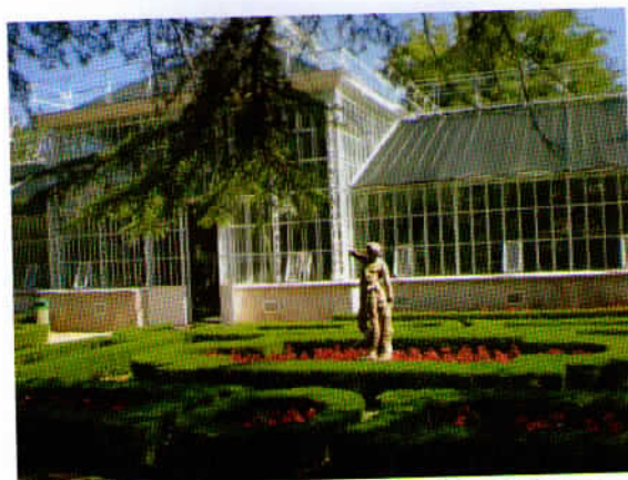
Palmarij in okrasne gredice iz pušpana v Sežanskem botaničnem vrtu.

Najprej smo si izpolnili duše z lepotami urejenega drevesnega parka v Sežanskem botaničnem parku.