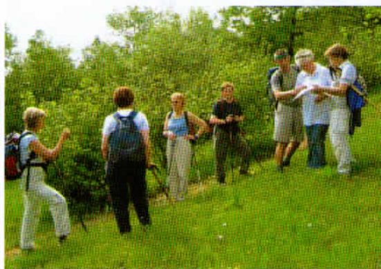
S pomočjo literature smo poizkusili prepoznati cvetlice, ki smo jih videli ob poti na Vremščico

Na travnikih ob naši poti je bilo obilo vsem dobro poznani cvetlic, kot so narcise, šmarnice, marjetice, travniška kozja brada, z velikim veseljem pa smo prepoznali manj pogoste rastline, kot so dišeča perla, poljski lan, šesterokotna homuljica, grebenuša itd.