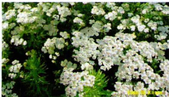
Rman, ki ima v ljudskem izročilu več imen, kot so jermanec, kačjek, rmenček itd.

Ali ste že slišali izraze za načine priprave čaja?