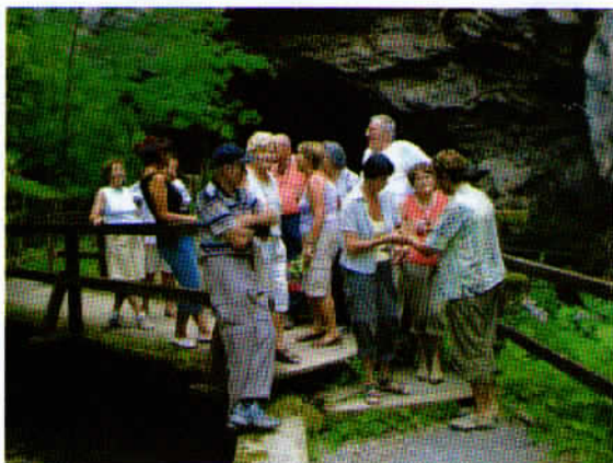
Veličasten vhod v Planinsko jamo.

Vprašali se boste, koliko se je pa hodilo? V sami jami smo hodili debelo uro, in to po samih stopnicah dol in gor. Peš hojo izpred jame v Lokev, kot je bilo prvotno predvideno, smo opustili zaradi vročine in se raje odpeljali v hlajenem kombiju do tristo let stare gostilne Muha v Lokvi na njoke in druge jedi, ki so bile vse zelo okusne. Slastne kraške jote pa si ni zaželel nihče. Neverjetno, verjetno zato, ker nismo bili nič pregreti.