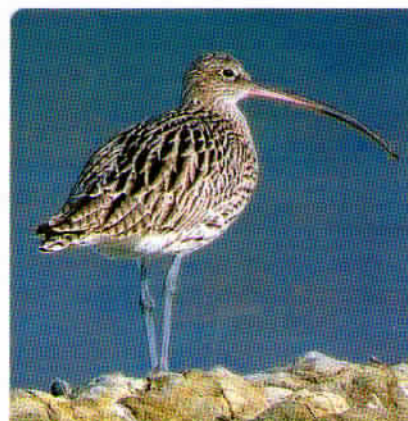
VELIKI ŠKURH – ptica, ki je zaradi sodobnega kmetovanja zelo ogrožena, v naravnem rezervatu izliva reke Soče v morje, pa je našlo primeren kraj za gnezdenje veliko parov.