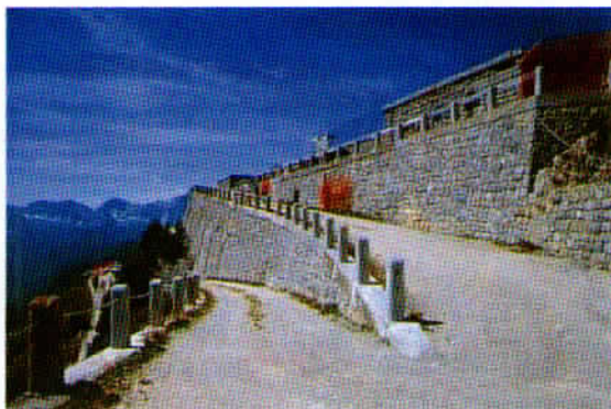
Utrinek z vrha Monte Rita.

Ko se vzpenjaš, se ti z vsakim korakom odpira pogled na imponantno gradnjo vojašnice, čeprav le v eni etaži. Notranjost je ravno tako veličastna.