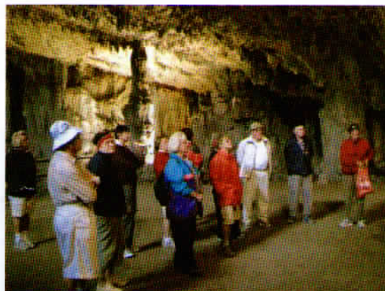
V Plesni dvorani jame Vilenica, kjer se podeljujejo mednarodne literarne nagrade.

rekordni julijski dan je bilo v jami od 8 do 10° C in v kratkih hlačah mi je bilo prijetno sveže. Kako pekleno vroče je bilo zunaj, sredi poletnega dne sem občutila na zadnjem delu stopnišča, pred izhodom iz jame, ko me je vroč val skoraj prikoval in mi kar naenkrat ni dal dihati. Kako so dihali ob vzpenjanju na Špik?