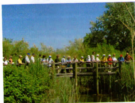
Leseno mostišče, speljano po močvirnem predelu desnega brega rezervata.

Pot je najprej speljana po zanimivem lesenem mostišču preko trstičja in mlak. Od tu smo lahko opazovali lep labodji par, ki je pravkar gnezdil.