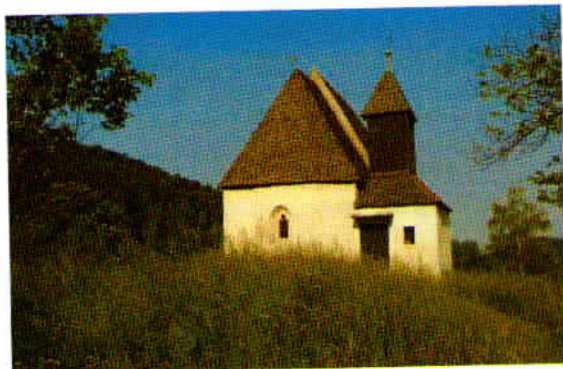
Cerkev Sv. Miklavža na Ravnem.

lovu izgubil, sv. Miklavž pa mu je pomagal najti pot iz neprehodnih gozdov.