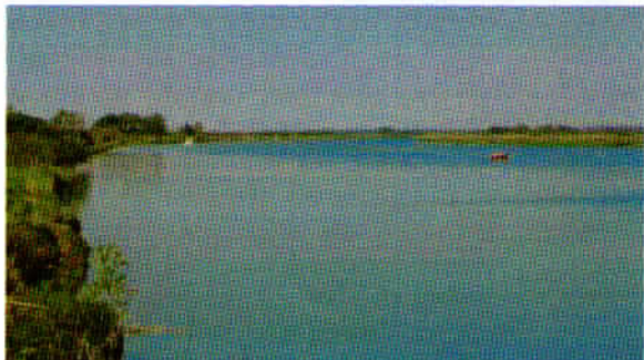
Reka Soča pred izlitem v morje.

zanimivih podatkov podal g. Tomaž Planina, ki je tudi pomagal pri vodenju naravovarstvenega izleta