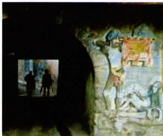
Detajl notranjosti Messnerjeva muzeja.

Na jugu se je kazala mogočna Civetta (3220) in v daljavi Agner (2872), na zahodu pa kar po vrsti Marmolada (3343), Pelmo (3168), skupina Tofan (vse nad 3200) in Antelao (3264); proti severu se gorski vršaci preko Marmarol (med 2800 in 2900) počasi znižujejo in v ozadju se že opazijo Karnijske Alpe; pogled na vzhod pa nam zapirajo vrhovi čisto pred našim razglednikom, saj so vsi visoki med 2500 in 2700 m.