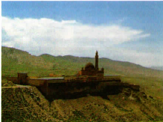
Detajl s poti po Turčiji, Ishak Paša, palača

Posnetki s poti po državah, preko katerih so potovali, zlasti pa posnetki izredno lepih in zanimivih pokrajin Turčije so bili enkratni.