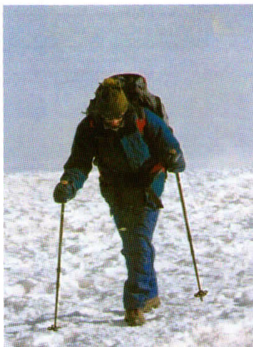
»VASJA IN ZADNJI METRI«: avtor Aljoša Dornik.

PRIZNANJE FOTOGRAFIJI z društvenega življenja