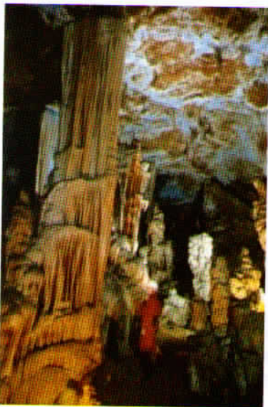
Mogočni steber v Beli dvorani jame Dimnice

Spuščamo se po vlažnih, spiralno speljanih stopnicah in pazimo na vsak korak. Vidimo dim, ki se dviguje iz globine, torej je res, da hudič tam spodaj suši pršut, kot govori legenda. Pot nas pelje mimo vhodne dvorane in plesišča, kjer so včasih prirejali koncerte in tudi ples.