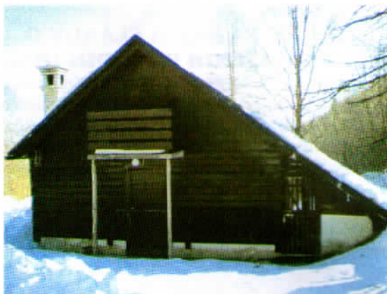
Prva lovška koča na naši poti proti vrhu.

Po okrepčilu smo še bolj pogumno premagovali zasneženo pot. Ko smo ravno menili, da smo tokrat na poti popolnoma sami, nam je nasproti prišel planinec domačin, ki je omenil, da gre v dolino, kamor je povabljen na kosilo, nato pa se bo vrnil na planino. Kar zavidali smo mu, da ima toliko moči.