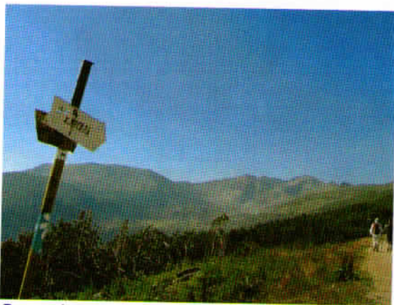
Smerokaz za Musalo 2925 m, Vir: internetne strani

Izlet za vse tiste, ki vas mika potepati se po starodavnem gorstvu Rodopi, povzpeti se na najvišji vrh Balkana – Musala (2925 m) in odkrivati arhitekturne, kulturne in duhovne znamenitosti zahodne Bolgarije.