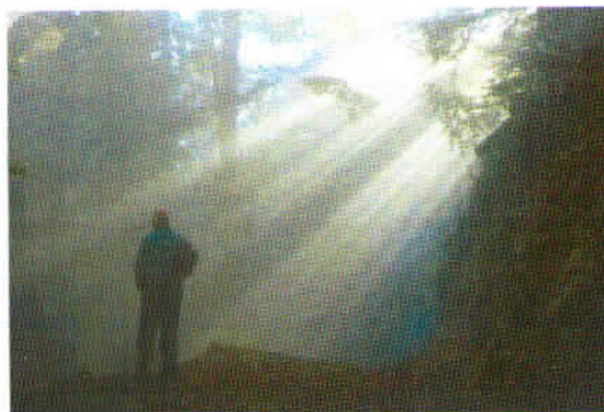
» JUTRO NA JURČIČEVI POTI «, avtor: Anton doma

V tematskem sklopu družabno življenje je prispelo manj fotografij.