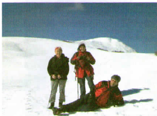
V ozadju vrh Kobariškega Stola, do katerega smo potrebovali še uro hoda.

Ko smo krenili proti našemu končnemu cilju, to je Stolu na višini 1673 m, sem menila, da ga bomo zmogli v pol urice, pa sem se krepko uštela. Nekoliko smo bili že utrujeni, dodaten napor pa je zahtevala tudi neudelana pot, ki je včasih zdržala našo težo, drugič se nam je pod nogami ugreznilo. Počasi, vendar vztrajno smo po skoraj uri hoje dosegli naš cilj. Sledile so ustaljene obveznosti: občudovanje okolice, slikanje, skodelica čaja, nato pa spust, saj je na vrhu resnično pihal močan hladen veter.