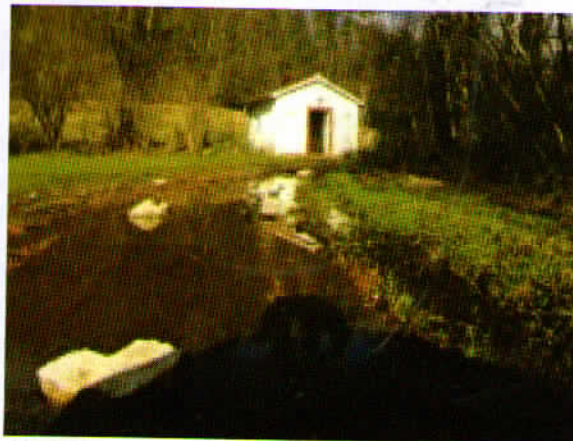
Utrinek s sredine doline Jezerina