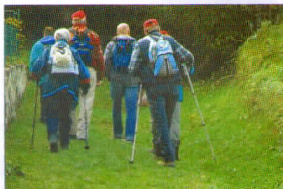
»Zadnjič po Jurčičevi poti«, avtor: Anton Doma.

Avtorju obeh najboljših fotografij Antonu Domi iskreno čestitamo in želimo, da bi naredil tudi v bodoče še veliko dobrih fotografij.