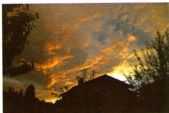
» PO NEVIHTI «, avtor: Anton Doma,

Oblačno nebo je sicer zelo pogost, a hvaležen in neizčrpen motiv z nešteti variantami. Pričujoča fotografija je razkošno barvita in dramatično razgibana. Izrazne možnosti barvne tehnike so odlično izkoriščene. Osvetlitev je brezhibna, ostrina natančna. Temne silhuete strehe na skrajnem spodnjem robu še povečujejo vtis globine in brezkončnosti neba, kar deluje na opazovalca meditativno.