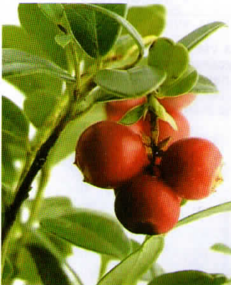
Brusnice so učinkovite proti bakterijam

Sestavine brusnic spreminjajo bakterije E.coli, ki so krive za številne bolezni, od vnetja ledvic do propadanja zob. Brusnice in še posebno brusnični sok imajo številne blagodejne učinke na zdravje, zlasti dragoceno pa je to, da preprečujejo vnetja sečil.