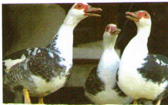
» KAJ SI ŽE REKLA ? «, avtor: Anton Doma.

Redek, izjemno posrečen motiv, poln prisrčnosti in humorja, res prava »družabnost«. Posnetek izpričuje mirno roko in sposobnost hitrega odločanja